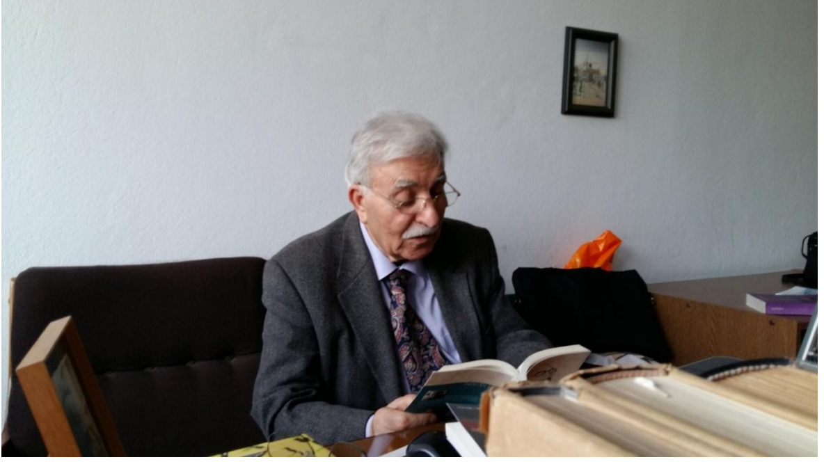
Değerli Hocamız Çalışma Odasında Misafirlerine Şiir Okurken 2015.