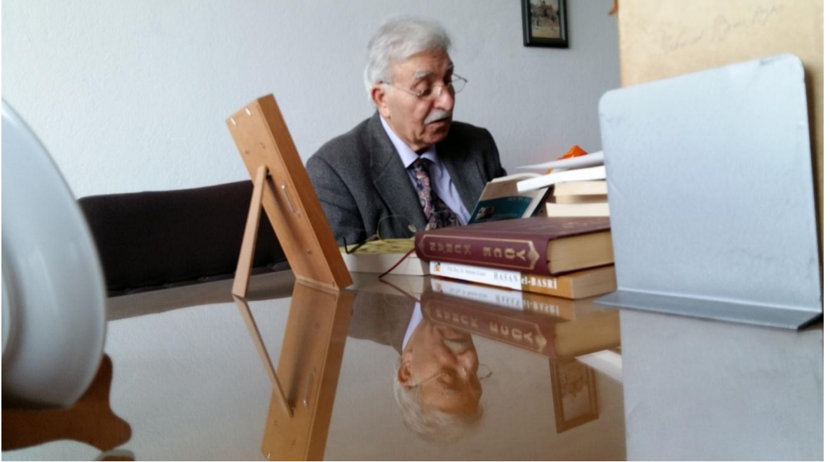
Dokuz Eylül Üniversitesi'ndeki Çalışma Odasında 18 Nisan 2015.