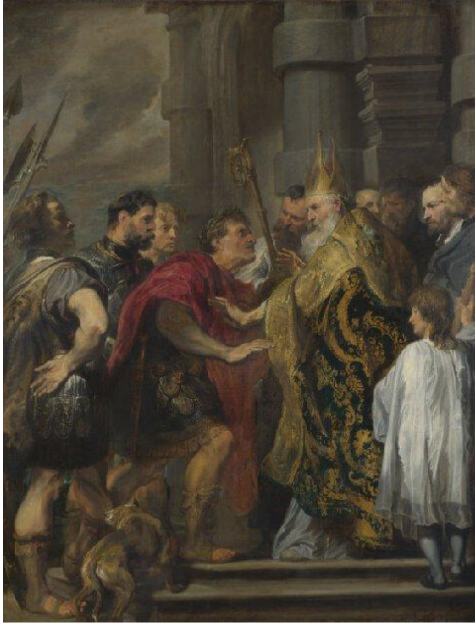
Anthony van Dyke, “St. Ambrosius’un Theodosius’u Milano Katedrali’nde Aforoz ediři” (The National Gallery koleksiyonu, Britanya)

Ambrosius’un ilk tepkisi, Theodosius ile görüşmeyi reddetmek oldu. Piskopos, imparatorluk makamında görüşülen konularda bilgi sahibi olduğunu dolayısıyla olup bitenin iç yüzünü çok iyi bildiğini açık bir dille ifade ediyordu. İmparatora ve kararlarına saygı duyduğunu belirterek, ondan ya da generallerinden korkmadığının da altını çiziyordu. Bununla yetinmeyerek vazifesinin zulmü dile getirmek olduğunu da söylüyordu (Ambrosius,