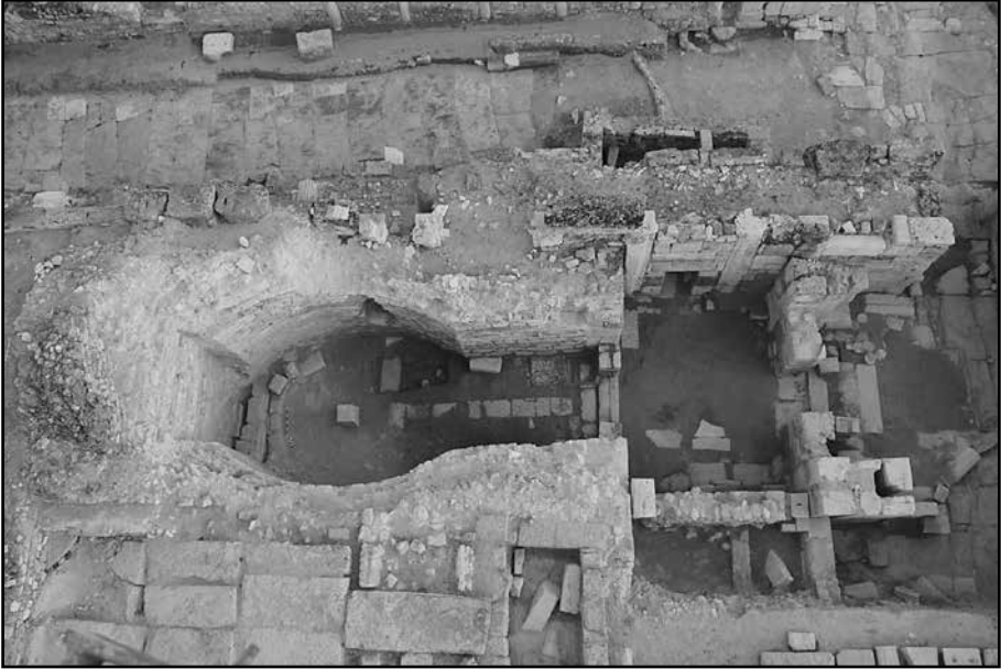
Resim 3: Erken Bizans Kilisesi çalışma sonrası hava fotoğrafı.