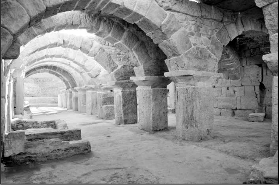
Resim 5: Kemerli Yapı kuzey yarısı, batıdan görünüm.