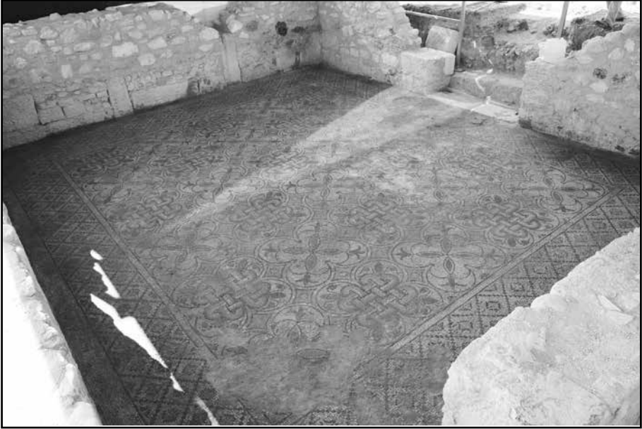
Resim 8: Mozaikli Konut Mekân 1 zemin döşemesi.