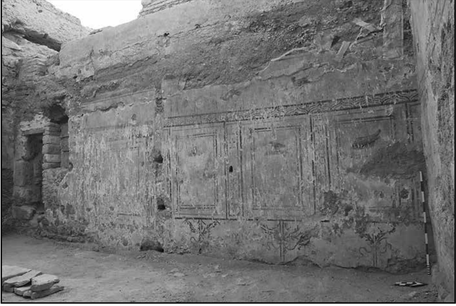
Resim 7: Mekân C Dođu Duvarı'ndaki fresk.