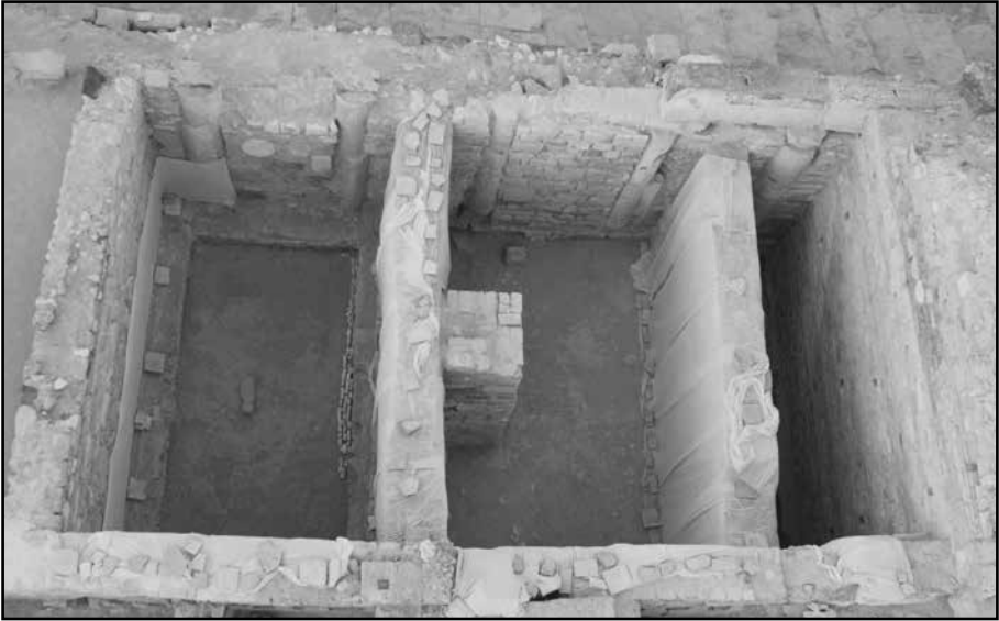
Resim 6: Mekân A, B ve C, hava fotoğrafı.