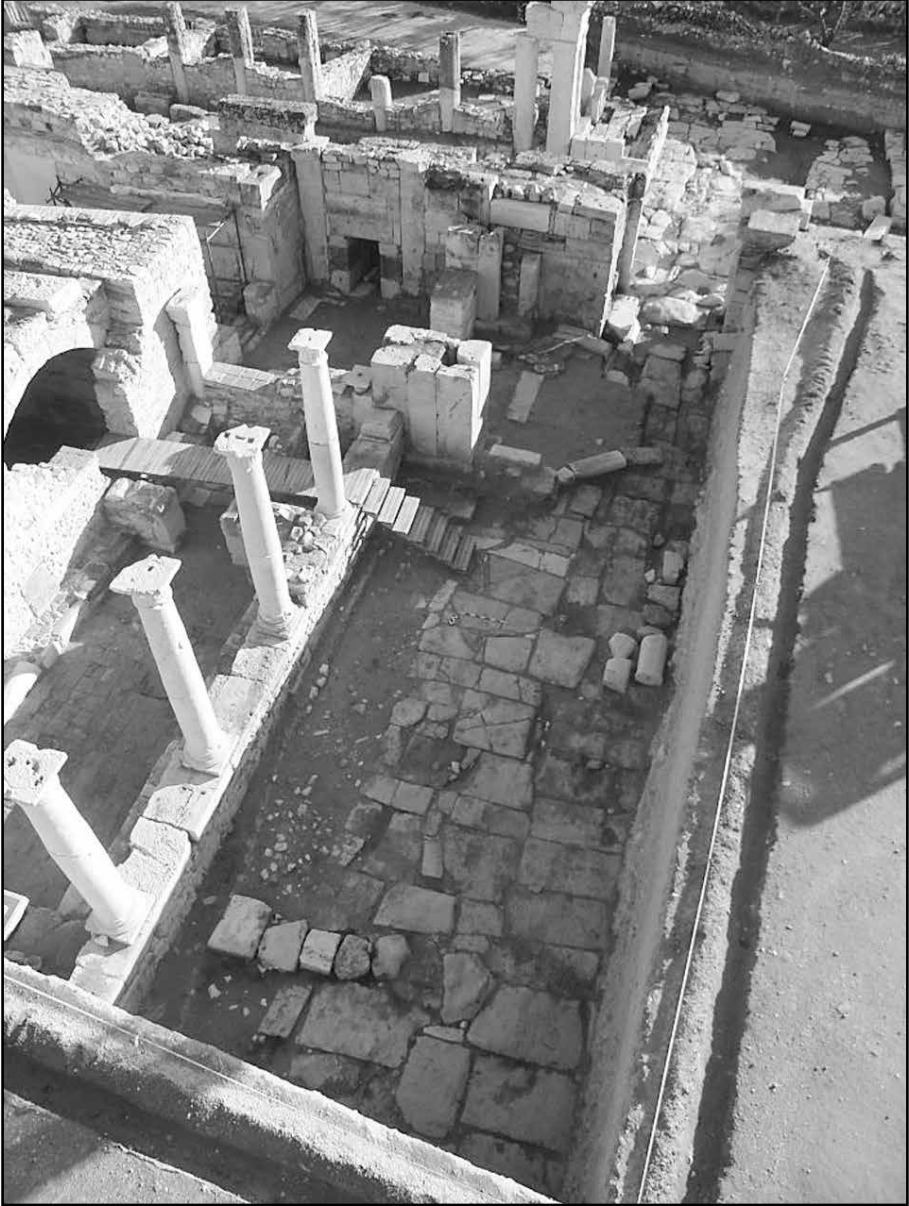
Resim 4: Hierapolis Caddesi hava fotoğrafı.