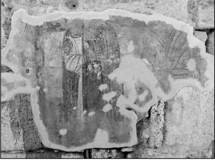
Resim 2: Erken Bizans Kilisesi kuzey duvarı üzerindeki iki aziz betimlemeli fresk.