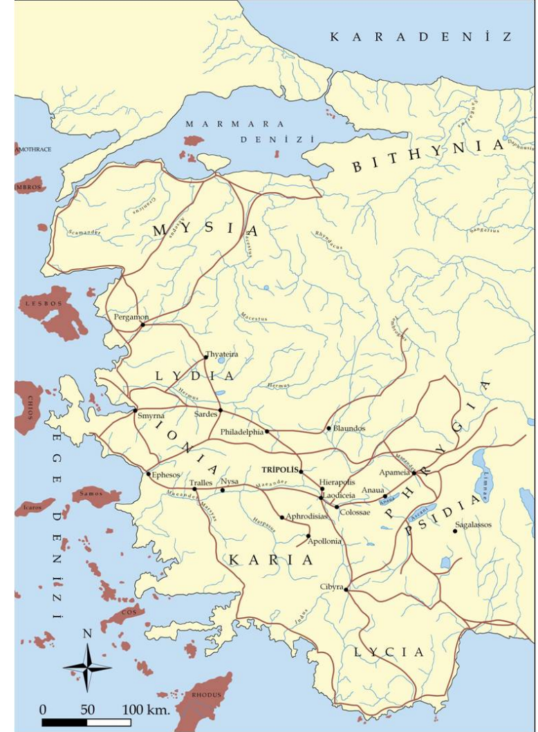
Fig. 1: Batı Anadolu Haritası

Toprak altında kalan mimari yapıları belirlemek amacıyla 4000 m 2 lik alanda Jeo-radar taramaları gerçekleştirilmiştir. Bu taramalar sonucunda antik kentin ızgara plana sahip olduğu ve 60 x 45 m'lik insulalarla (parşel-ada) oluşturulduğu tespit edilmiştir.