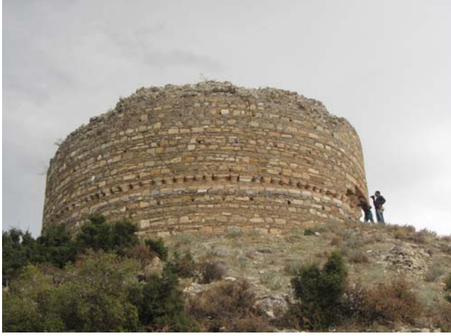
Fig. 2: 13. yy. Kalesi'ne ait kule.