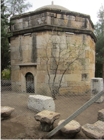
Fig. 3: 14. yy. Türbesi.