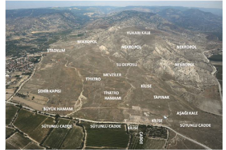
Fig. 5: Tripolis yerleşim alanı.