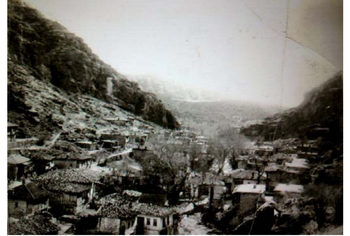
Fig. 4: 1950 civarında Narlıdere Köyü