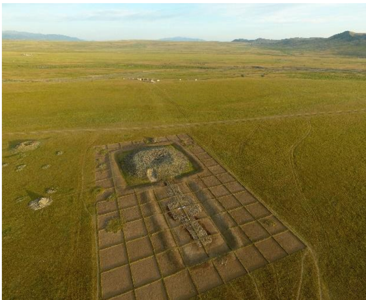
Рис. 19. Каганский культово-мемориальный комплекс. Начало исследования

Комплекс состоит из двух основных компонентов - каменного храма и примыкающих к нему, с восточной стороны, строений. Оба компонента комплекса имеют самостоятельные ограждения в виде прямоугольных каменно-земляных валов (рис. 19).