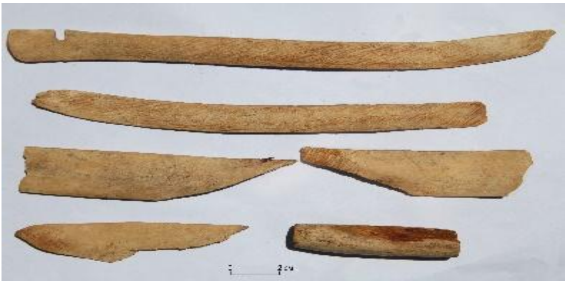
Рис.24. Костяные накладки на лук из впускного погребения древнетюркской эпохи

При нем зафиксированы костяное изделие, изготовленное из трубчатой кости, маленькие железные пряжки и костяные накладки на лук (рис.24).