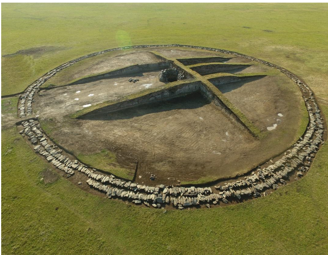
Рис. 7. Большой курган в процессе раскопок

В разрезе наземного сооружения, несмотря на многократные разрушения грабителями, а также норами и ходами сурков, в целом улавливается строительный прием, архитектурно-конструктивные элементы и последовательность возведения памятника и др (рис. 7).