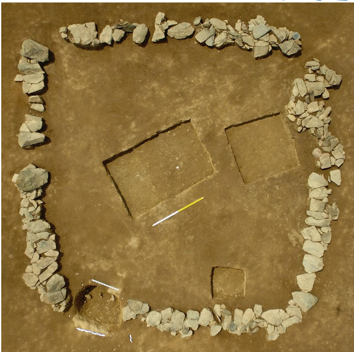
Рис. 21. Ограда-основа первоначального сооружения кургана древнетюркского времени с детским погребением в первой группе памятников Елеке сазы

Под северо-восточной стеной ограды зафиксировано разграбленное детское захоронение, совершенное в грунтовой яме (1,8 x 1,3 м, глубина - 0,7 м). При нем найдены глиняный сосуд, раковины каури и серебряная фигурка сэнмурва с отломанным хвостом (рис. 22).