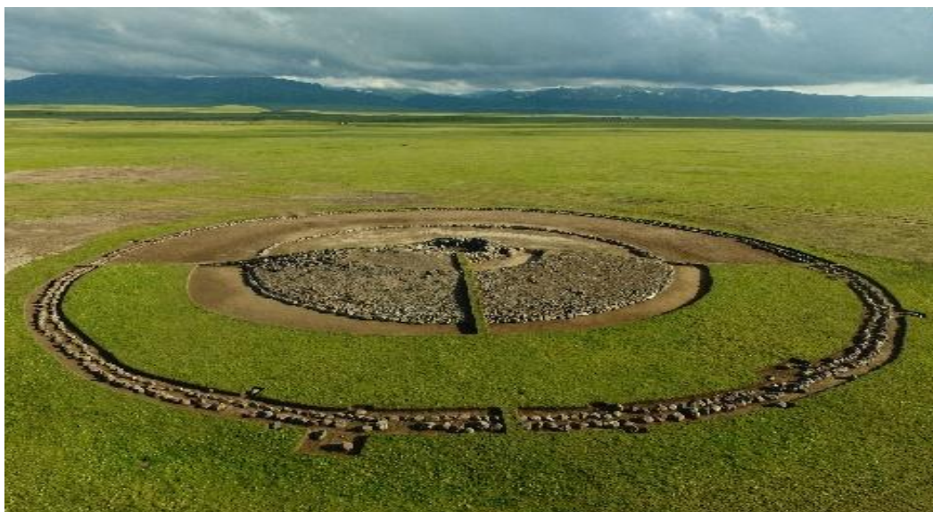
Рис. 27. Доследование наземной конструкции кургана № 4 для музеефикации

кургана № 4 для создания в перспективе музея под открытым небом (рис. 27, 28, 29).