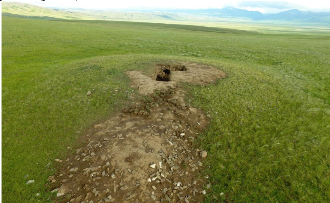
Рис. 16. Курган № 3 в шестой группе памятников Елеке сазы со следами разрушения

Курган № 3 расположен в 102м к югу от вышеотмеченного кургана № 2, на поверхности были видны обширные следы недавнего грабительского раскопа в виде глубоких прямоугольных траншей (рис. 16).