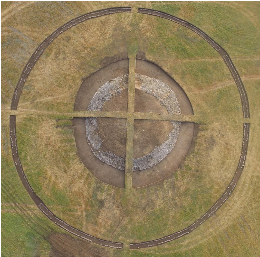
Рис. 14. Конструкция наземного сооружения кургана № 2 в шестой группе памятников Елеке сазы

Курган был покрыт каменным панцирем. Основание насыпи выложено кирпичом из крупных валунов (рис. 14). В восточной и западной стороне насыпи фиксируются дорожки, камни на них отсутствуют. А в основании их замыкают камни кирпичи белого цвета.