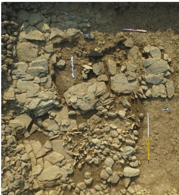
Рис. 2. Остатки каменных конструкции погребальной камеры

В центральной части наземного сооружения, на уровне древнего горизонта, просматривалась, несмотря на сильное разрушение, конструкция из плашмя положенных (местами в несколько слоев) крупных плит, общая конфигурация которой напоминает известный тип прямоугольной в плане формы погребальной камеры древних кочевников с примыкающим с восточной стороны дромосом (рис.2).