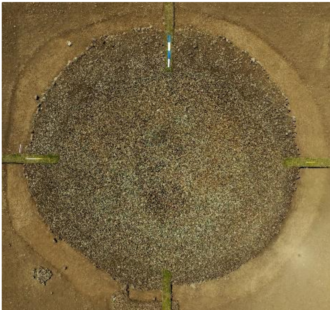
Рис. 1. Наземное сооружение каменного кургана после удаления дерна

На самой южной периферии второй группы памятников, ограниченной поперечной пологохолмистой возвышенностью, нами исследован незадернованный курган (рис. 1), который, несмотря на сильное ограбление, дал весьма важный материал для разработки вопросов становления раннесакского культурного комплекса и атрибуции большого количества случайных находок, происходящих из региона и сопредельных территорий. Он имел округлую в плане форму, сложен несколькими слоями крупных и средних камней, в основном из окатанных, и выделялся от других тем, что его наземное сооружение из камня не был задернован, за исключением периферии. Высота кургана -1,20 м, диаметр – 32,60х 32,15 м всю каменную конструкцию удерживала мощная крепида из двойного ряда округленных крупных камней.