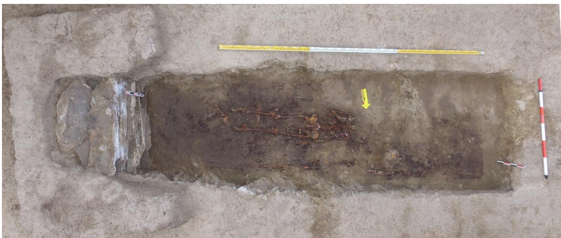
Рис. 12. Курган № 1 в шестой группе памятников Елеке сазы со следами разрушения

В 1,5 м на юг от центра насыпи кургана, было выявлено продолговатое могильное пятно, прямоугольной формы с закругленными углами (рис.12). Ее размеры составили 5,20x1,6 м. Длинной осью яма ориентирована по линии запад северо-запад — восток юго-восток.