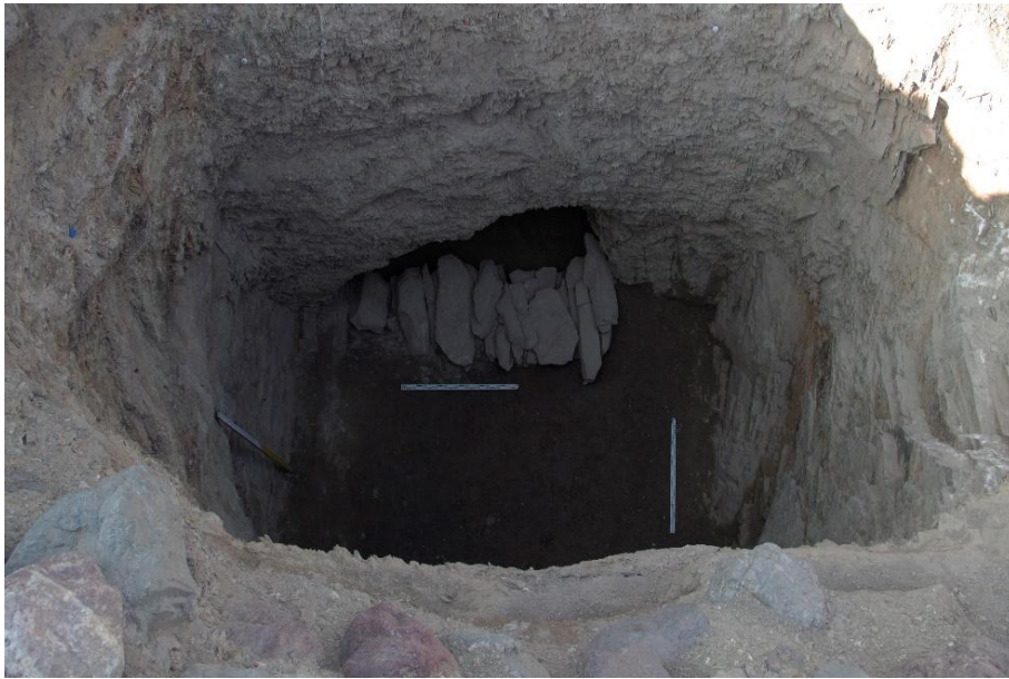
Рис.8. Погребальная яма с подбоем Большого кургана, вырубленная в скале

Могильная яма ориентирована длинной осью по линии северо-запад юго-восток. Длина 5,2 м, наибольшая ширина 5 м. Внутреннее пространство забутована большими булыжниками. Подбой врублен в северной стене, длина – 3,1 м, высота 1,2 м, ширина 1,9 м.