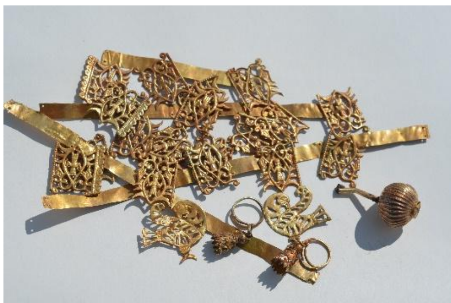
Рис. 18. Находки в яме кургана № 3

Интерес представляет подвеска в виде головки мака, нижняя часть которой украшена перегородчатой эмалью (рис. 18). Рядом была найдена краскотерка из серого с прожилками камня и с остатками красной краски. Возле остатков головного убора находилось зеркало из бронзы с большим содержанием белого металла, с плоской, расширяющейся к концу ручкой с остатками кожного чехла.