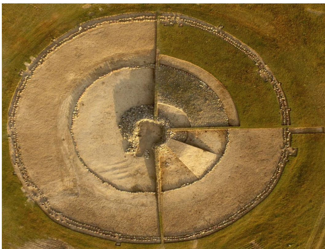
Рис. 28. Курган № 4, где найдены останки знатного юноши раннесакского времени, подготовленный для музеефикации