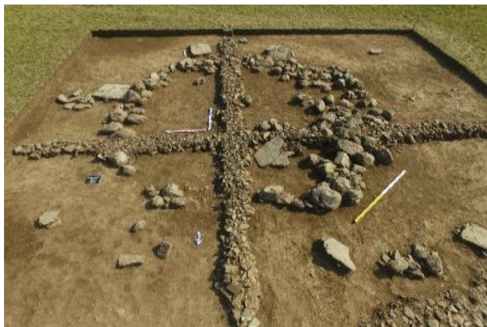
Рис.26. Древнетюркская поминальная оградка во второй группе памятников Елеке сазы

В отчетном году во второй группе памятников Елеке сазы проводилось исследование конструкции наземного сооружения