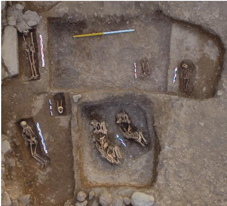
Рис. 3. Погребения людей и сопроводительное захоронения лошадей

Кроме упомянутых выше находок на месте, укажем на бронзовую бляшку от конского снаряжения в виде фигуры медведя и бронзового наконечника стрелы, которые были зафиксированы в грабительском лазе, но в пределах обширной погребальной камеры кургана (рис. 4).