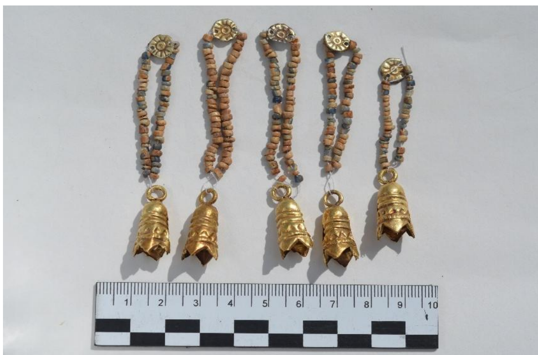
Рис. 13. Находки в яме кургана № 1

Возле скелета (женщины) обнаружены ажурные золотые нашивки прямоугольной формы с х-образным элементом внутри рамочки, пластина с растительным орнаментом, костяные изделия в виде трубчатых колечек и фиксатор. На месте сохранилось сложносоставное украшение из золотых колокольчиков, пастовых бус и круглых пластин с отверстиями (рис. 13).