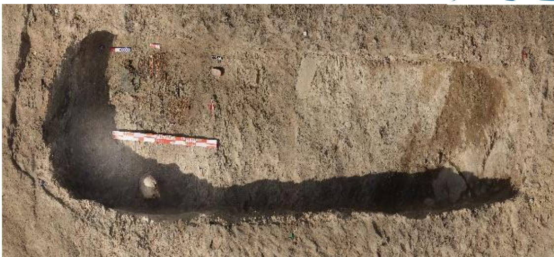
Рис. 17. Погребальная камера кургана № 3 в шестой группе памятников Елеке сазы

Интерес представляет подвеска в виде головки мака, нижняя часть которой украшена перегородчатой эмалью (рис. 18). Рядом была найдена краскотерка из серого с прожилками камня и с остатками красной краски. Возле остатков головного убора находилось зеркало из бронзы с большим содержанием белого металла, с плоской, расширяющейся к концу ручкой с остатками кожного чехла.