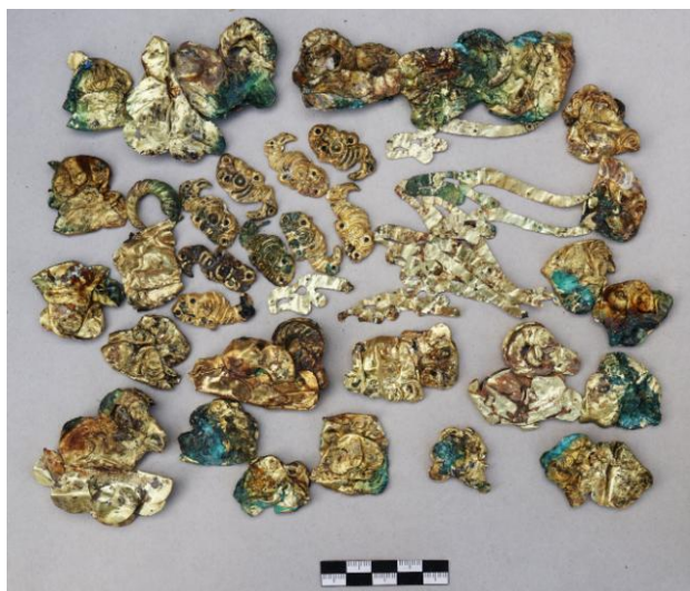
Рис. 10. Клад, спрятанный в камнях надмогильной конструкции Большого кургана

В последней седьмой группе раскопаны три объекта, два из них аварийные. Курганы расположены на продолговатых, холмистых возвышенностях, которые ориентированы длинной осью по линии север-юг. Высота местности над уровнем моря — 1470 м