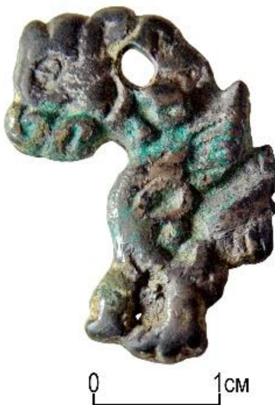
Рис. 22. Фигурка сэнмурва из детского погребения с отломанным хвостом

Изделия в виде фигурок сэнмурва и различные трактовки его образа встречаются в древнетюркских изобразительных памятниках, они указывает на относительно точные даты сооружения того или иного памятника раннесредневековой эпохи.