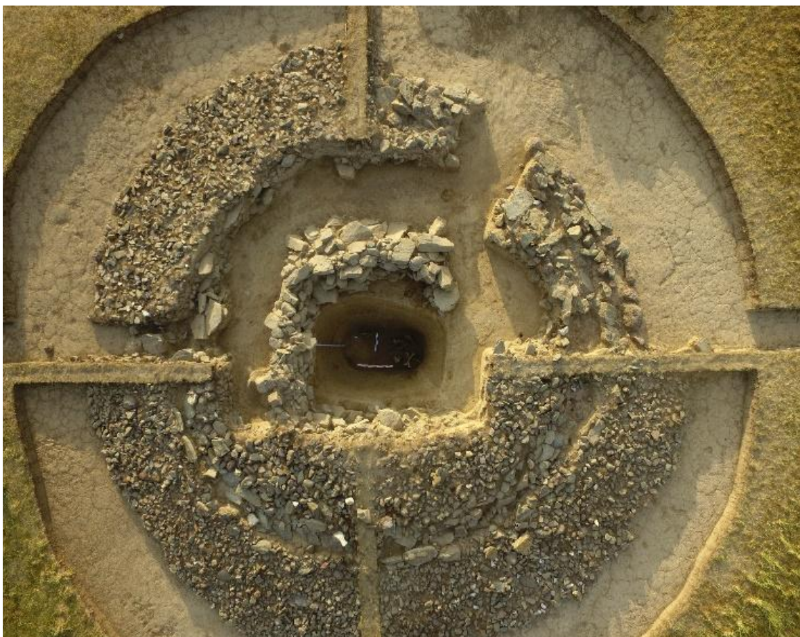
Рис. 5. Курган в северной группе с разграбленным погребением в грунтовой яме

Начиная с отметки 1,70м от верхнего края могильной ямы и до самого дна зафиксированы разрозненные кости погребенного человека (рис. 5).