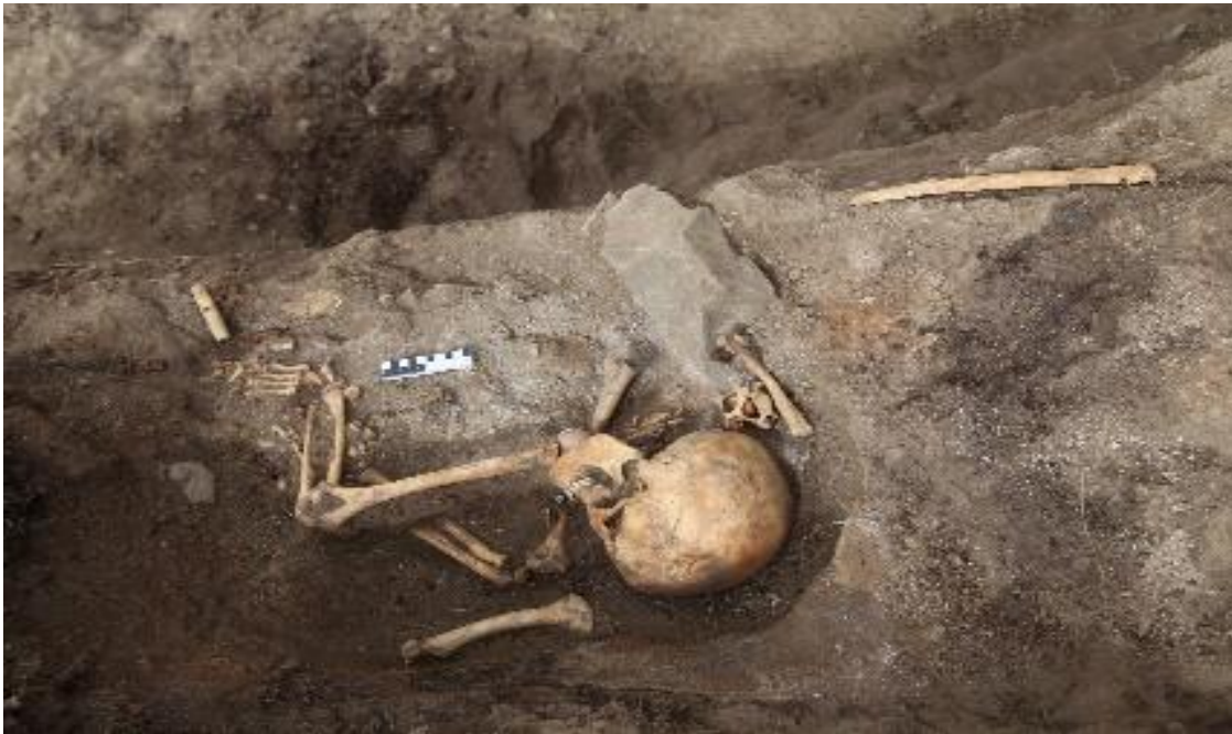
Рис. 23. Впускное погребение древнетюркского времени, совершенное в насыпи Большого земляного кургана в шестой группе памятников Елеке сазы

При нем зафиксированы костяное изделие, изготовленное из трубчатой кости, маленькие железные пряжки и костяные накладки на лук (рис.24).