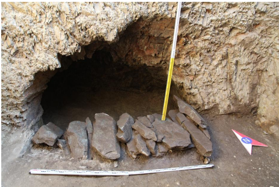
Рис.9. Подбой в северной стене погребальной ямы Большого кургана

Могильная яма ориентирована длинной осью по линии северо-запад юго-восток. Длина 5,2 м, наибольшая ширина 5 м. Внутреннее пространство забутована большими булыжниками. Подбой врублен в северной стене, длина – 3,1 м, высота 1,2 м, ширина 1,9 м.