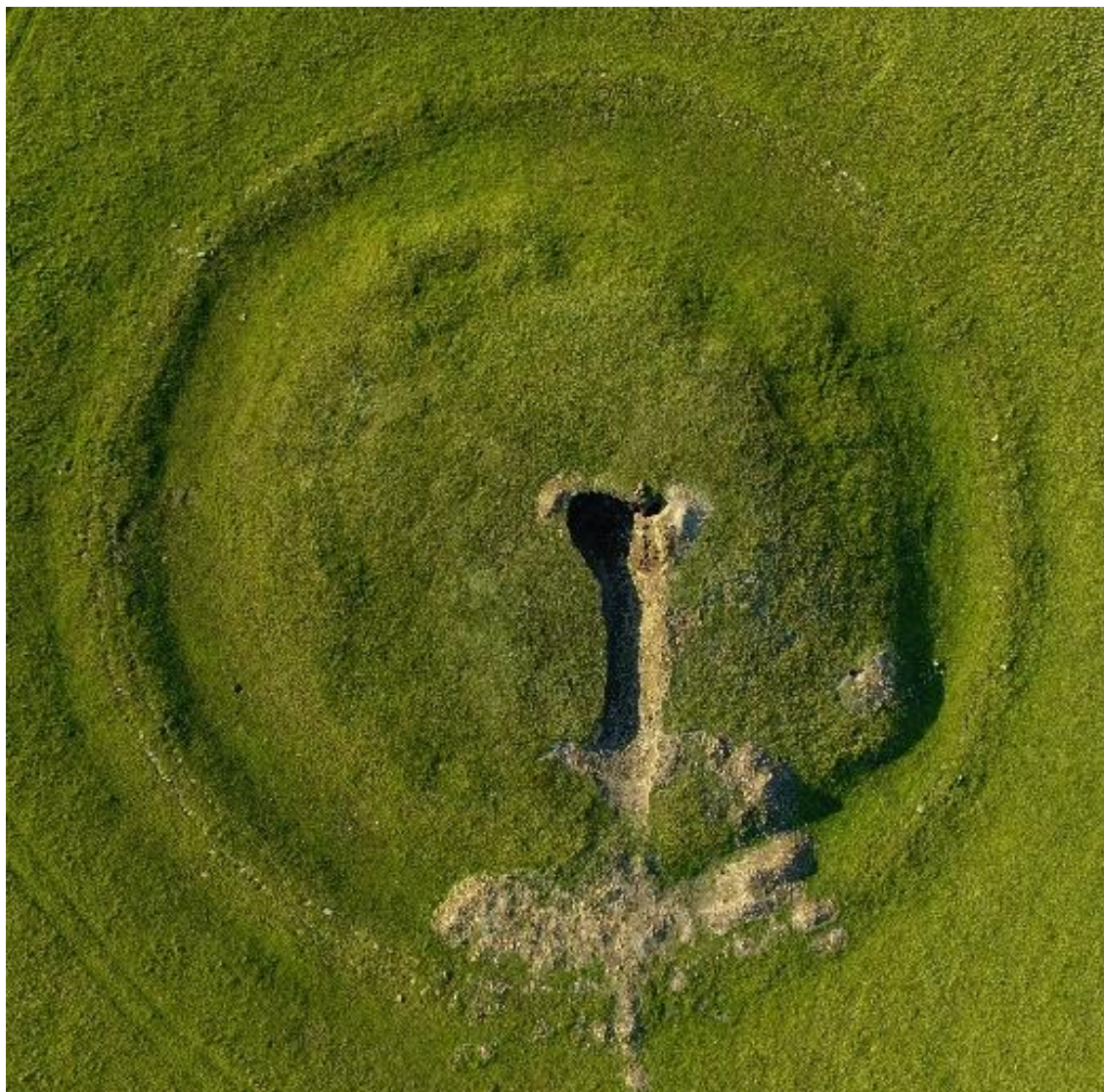
Рис. 6. Большой земляной курган со следами разрушения

На поверхности кургана имелась глубокая, практически до древней дневной поверхности траншея, проложенная современными грабителями, шириной 5 м, с углублением и расширением на конце, ближе к центральной части наземного сооружения (рис. 6).