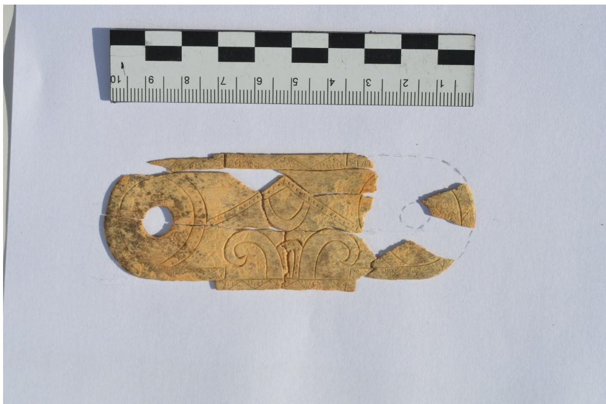
Рис.15. Гравированная костяная пластина из кургана № 2

У входа в яму была обнаружена золотая нашивка округлой формы с петлей на обороте. Еще были обнаружены золотая нашивка и тонкая гравированная костяная пластина с сквозным отверстием (рис. 15). Костные останки человека были обнаружены в грабительском лазе.