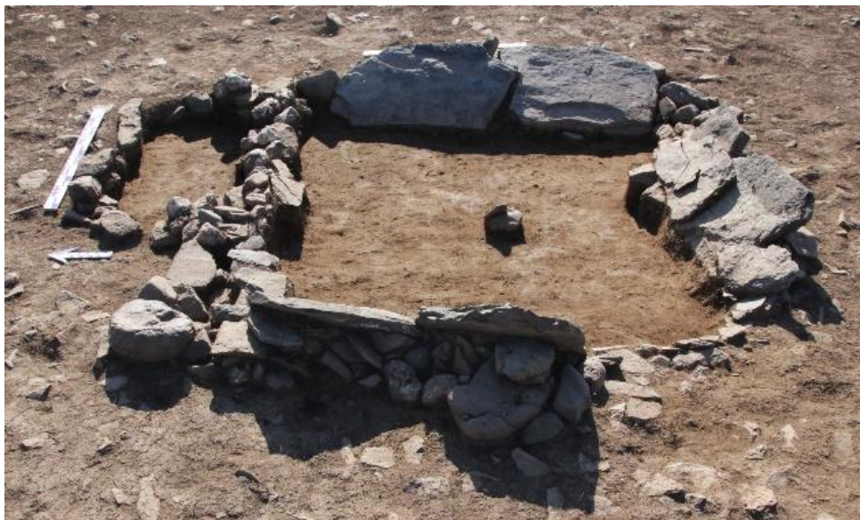
Рис.25. Древнетюркская поминальная оградка во второй группе памятников Елеке сазы

Во второй группе памятников Елеке сазы были раскопаны еще два объекта древнетюркского времени с прямоугольными оградками (рис. 25, 26).