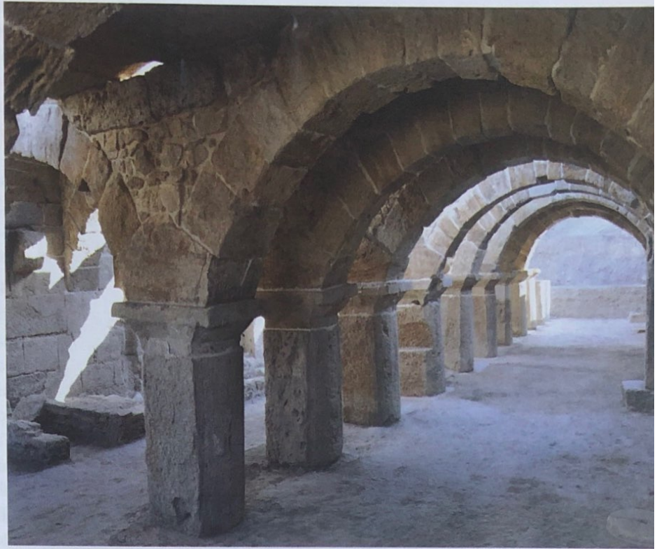
Kemerli yapı

Lydia Bölgesi'nin sınır kentlerinden biri olan Tripolis'in stratejik ve jeopolitik anlamda oldukça önemli bir noktada konumlandığını gösteren en önemli veri, ticaret yollarının geçiş güzergahında yer almasıdır. Smyrna, Pergamon (Bergama) ve Ephesos (Efes) gibi antik çağın önemli kentlerinden başlayan ticaret yolları, Tripolis'te birleşir ve Hierapolis, Laodikeia üzerinden geçerek Anadolu'nun doğu ve güney bölgelerine ulaşır.