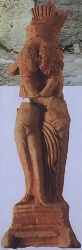
Eros ve Psykhe betimlemeli thymiaterion (tütsü kabı) © Tripolis Kazı Arşivi

Hierapolis Caddesi © Tripolis Kazı Arşivi