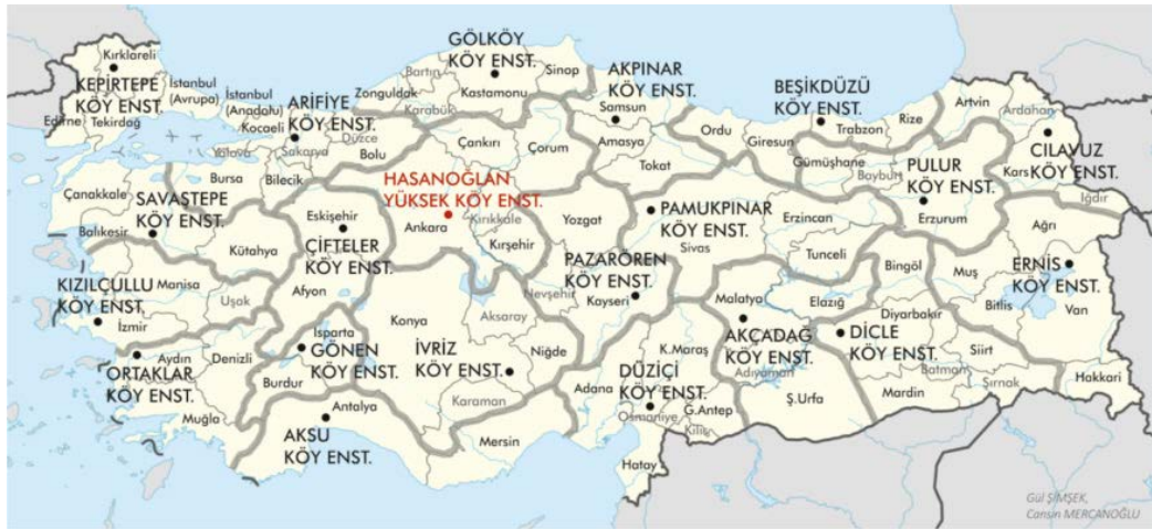
Şekil 2: Köy Enstitülerinin Harita üzerindeki dağılımı 702

Köy Enstitüleri ile her köyde bir okul ve bütün köyleri öğretmene kavuşturmak amacıyla bir plan hazırlanmıştır. Bu planda, önce her il ve ilçenin öğretmen, okul ihtiyacı saptanmış sonra da bu ihtiyacı on yıl içinde karşılayacak şekilde köy enstitülerinin her yıl alacakları öğrenci sayıları belirlenmiş ve ayrı ayrı hesaplanmıştır. Bu plana göre 1956 yılında okulsuz tek köy kalmaması planlanmıştır. 8-10 köy bir sağlık memuruna bir ebeye bağlanacak ve 1956 yılında bütün köyler sağlık kontrolü altına alınacaktı. 703 On yıllık zaman içinde 1956 yılında ulaşılmak istenen hedefte 37.955 öğretmen, 7.455 eğitmendir. 704 Köy Enstitülerinde aynı zamanda sağlıkçı da yetiştirildi. 1943 yılında 7 enstitü de sağlık kolu açıldı. Köy sağlık memuru yetiştirilmesi maksadıyla 1943 yılında Köy Enstitülerinden mezun olup öğretmenlik dışında iş yapmak isteyenlere iki yıllık özel bir eğitimle yetiştirilmelerine karar verilmiş