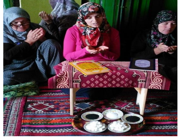
Foto.14 Ölünün ikinci günü Ağız açma.