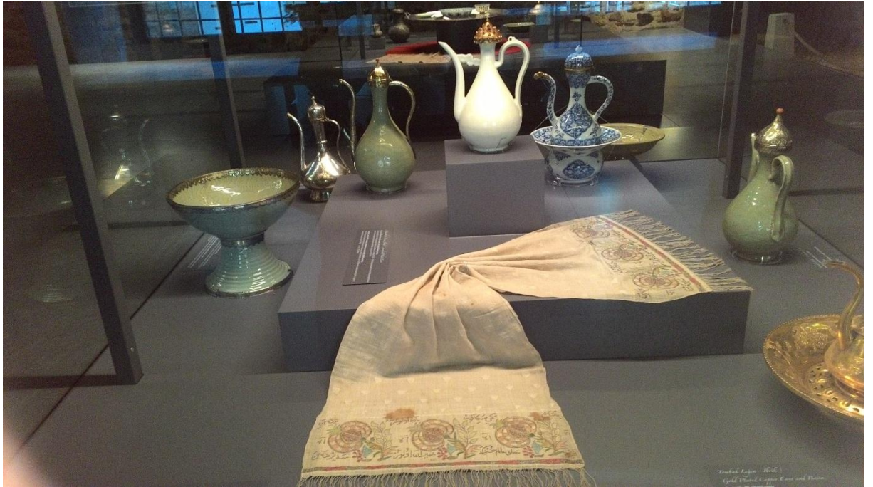
Ek 7. Porselen sürahiler