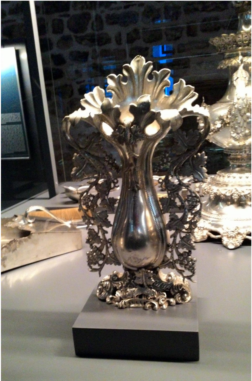
Ek 9. Gümüş Çiçeklik