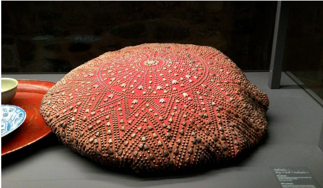
Ek 2. Sahânkâr (19.yüzyıl, tepsi)