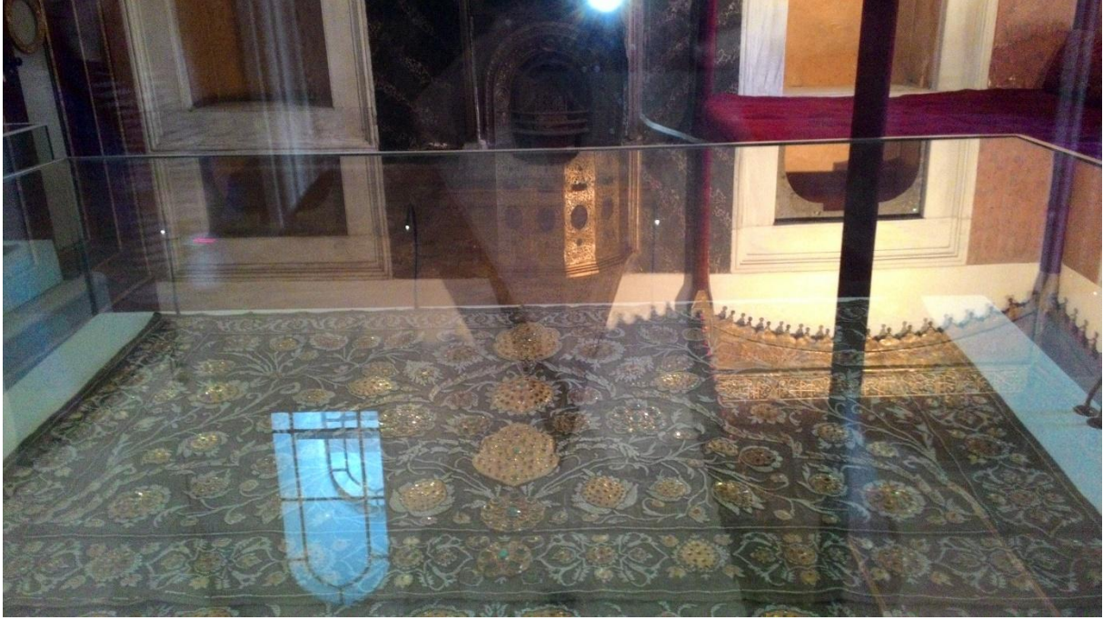
Ek 11. Arz odası taht örtüsü