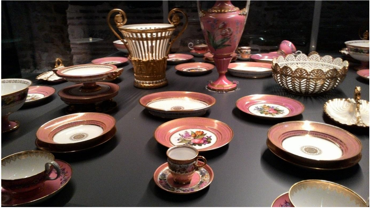
Ek 5. Çin porseleni yemek takımları