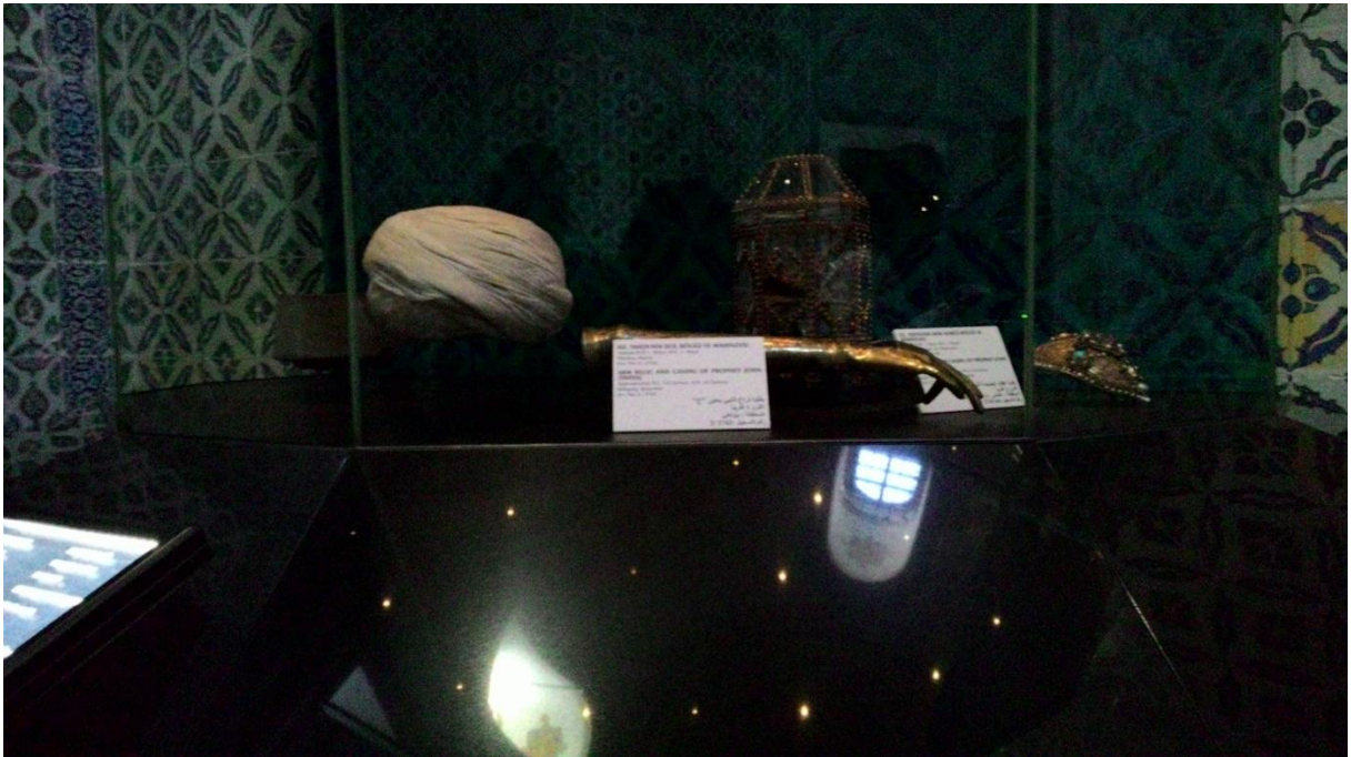
Ek 12. Kutsal emanetler bölümünde bir kılıç