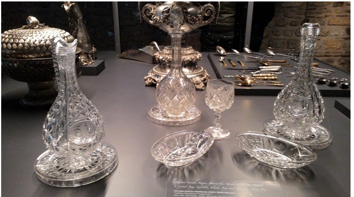
Ek 8. Kristal Sürahiler