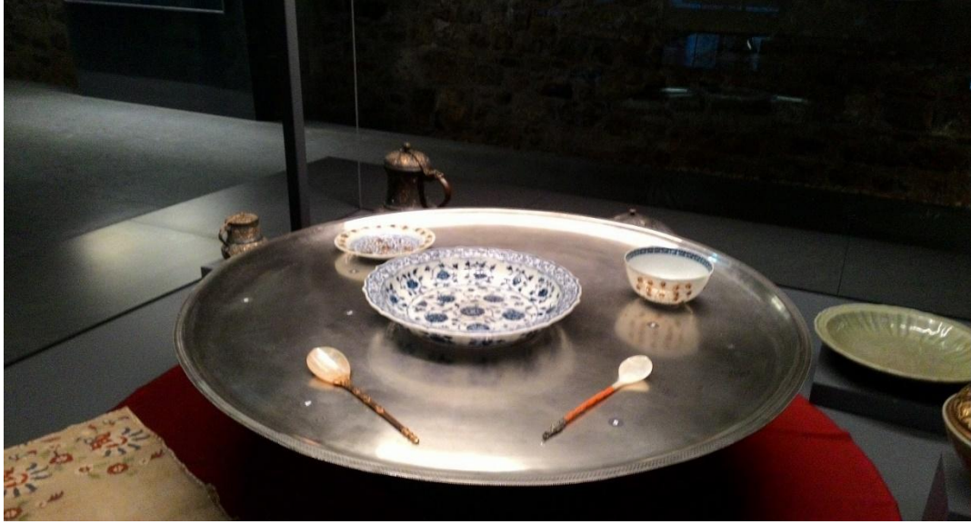
Ek 1. Kâse ve sedef kaşıklar