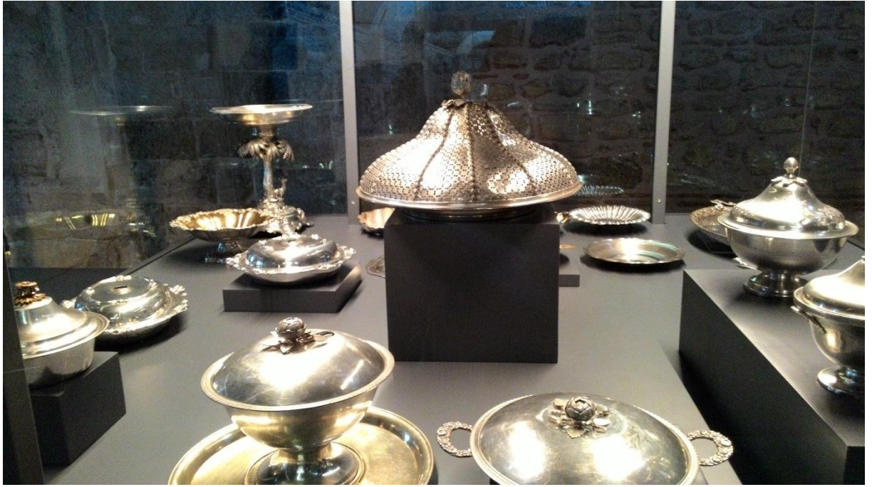
Ek 3. Gümüş mutfak eşyaları