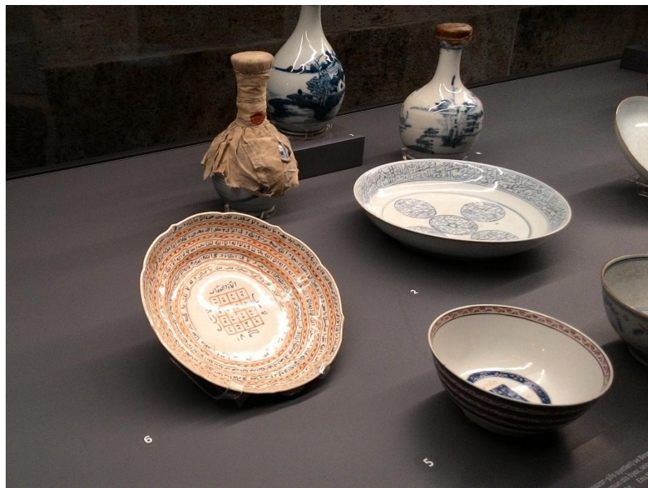
Ek 6. Yazılı kâseler