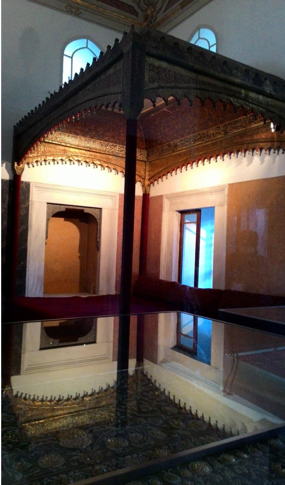
Ek 10. Taht ve örtüsü