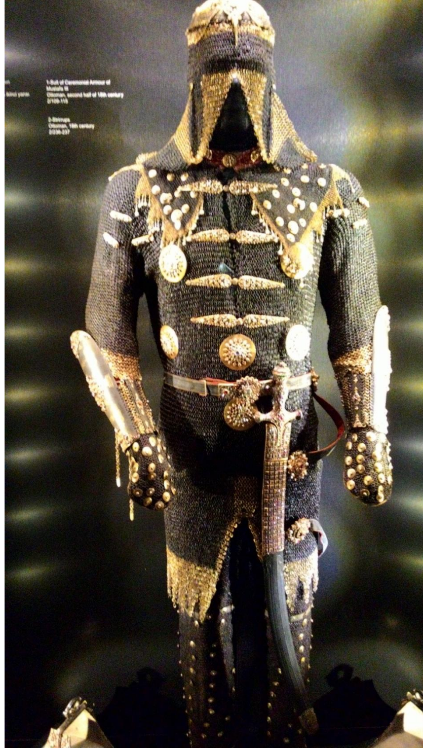
Ek 13. III. Mustafa'nın zırhı