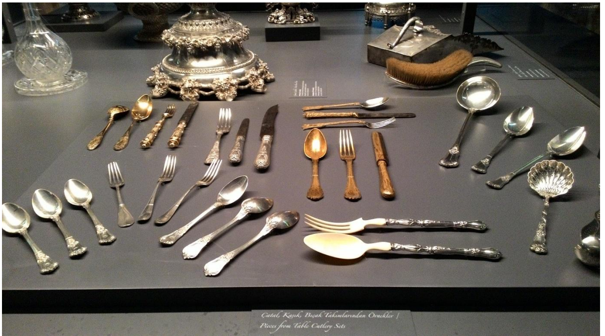
Ek 4. Çatal, kaşık ve bıçak takımından örnekler