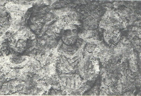
Res. 6. Karahayıt Kabartmasından detay.

lelerin düştüğü görülmektedir. Boyun kısa ve kalın tutulmuştur. Vücudun alt kısmı ile üst kısmı arasında bir orantısızlık göze çarpmaktadır. Bu orantısızlık hem gövdeye göre bacakların biraz daha kısa tutulmuş olmasında, hem de boyunun kısa yapılmasında kendini göstermektedir. Böylece tanrı tıknaz ve biraz orantısız bir görünüşe sahip olmuştur 6 . Dionysos'da da genel kompozisyon olarak bakıldığında, ideal bir yapı görülür.