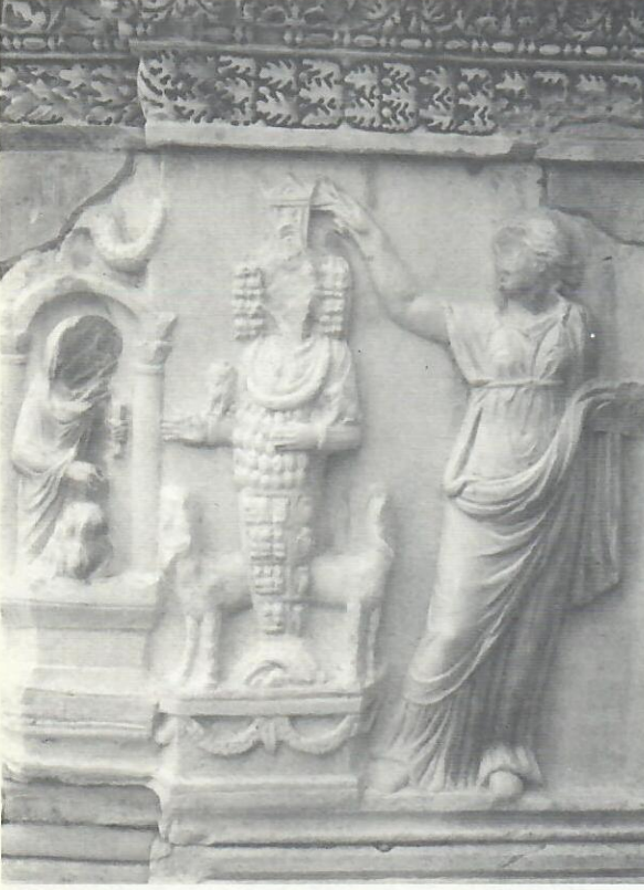
Res. 11. Hierapolis tiyatrosu sahne kabartması. Efes Artemisi kült heykelinin su ile kutsanması.

Efes Müzesi'nde yer alan Efes Artemis kült heykelinde, tanrıçanın elbisesi üzerinde, yedi sıra olarak, en altta bir sıra rozet ve onun üzerinde altı sıra cepheden hayvan kabartması ve kollar arasında iri testis yumrular yapılmıştır 49 . Hierapolis tiyatrosu sahne kabartmalarında yer alan iki adet kült heykelinde; birinde aynen Efes Artemisi'nde olduğu gibi, altta rozet sırası olmak üzere, altı sıra hayvan kabartmasıyla birlikte toplam yedi sıra olarak yapılmıştır 50 . Ancak diğer kabartmada, kült elbisesi üzerinde, altta bir sıra rozet ve üzerinde üç sıra hayvan olmak üzere toplam dört sıradır 51 (Res.11). Karahayıt kabartmasındaki Efes Artemis kült heykelinde, kült elbisesi üzerinde, toplam dört sıra seçilmektedir. Buda sanatçının tiyatro kabartmalarında yer alan kült heykellerinden, daha çok ikinci örneği model aldığı görüşünü bizde uyandırmıştır.