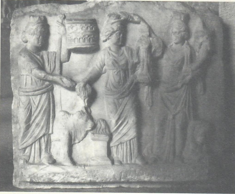
Res. 8. Hierapolis tiyatrosu sahne kabartması. Yarış Personifikasyonu (Hierapolis Arkeoloji Müzesi).

Kitharodos betimlenmiştir 40 (Res.7). Karahayıt kabartmasıyla tipolojik benzerliği olan, tiyatro kabartmasındaki Apollon Kitharodos, işçilik ve mermer kalitesi yönünden birinci sınıftır. Ancak Karahayıt kabartması hem yerel kireçtaşına yapılmış, hem de işçilik yönünden ikinci sınıf yüzeyel bir özellik yansıtmaktadır. Bunun yanında figür detayları da hava şartlarından dolayı çok deforme olmuştur. Tiyatro kabartmasında yer alan Apollon Kitharodos M.S. 2.yy'ın son çeyreğine tarihlenmektedir. Bu açıdan Karahayıt kabartması biraz daha geç bir stil göstermektedir.