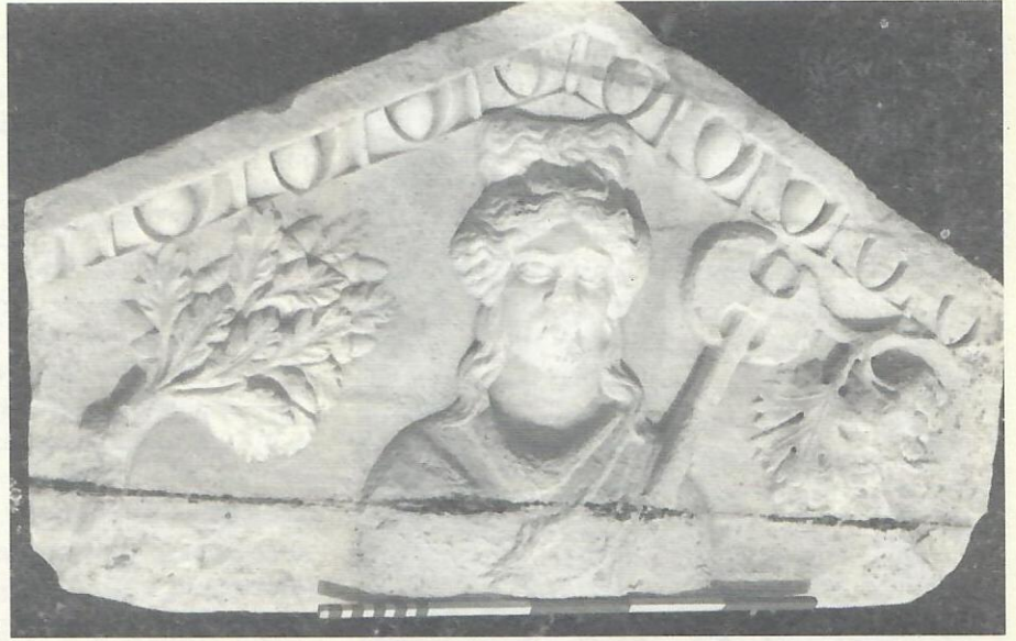
Res. 9. Hierapolis tiyatrosu sahne fasadından alınlık kabartması. Apollon Lairbenos (Hierapolis Arkeoloji Müzesi).

Lairbenos büstünde de elbise, Karahayıt kabartmasında olduğu gibi, göğüs üzerinde kabarık uç "V" kıvrımı yapmıştır ve kıvrımları suni ve serttir.