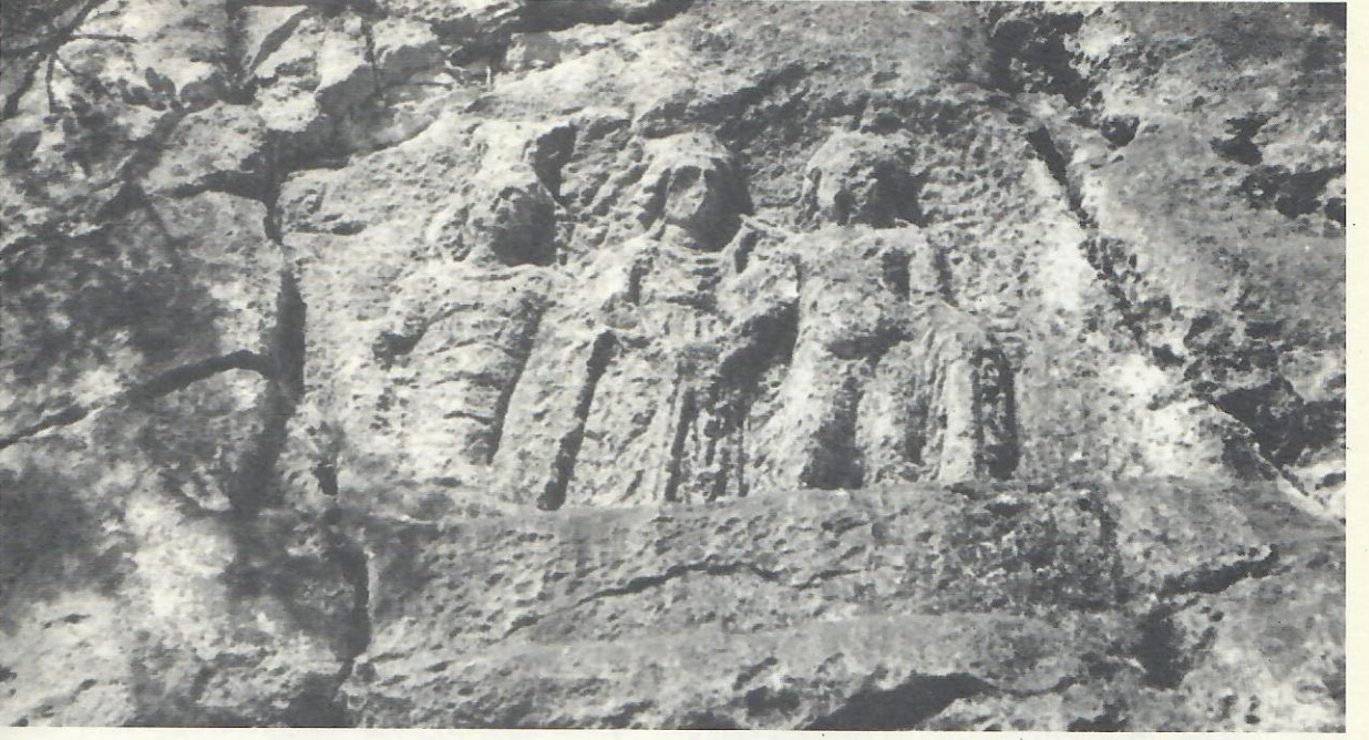
Res. 4.-5. Efes Artemisi şahitliğinde Apollon Kitharodos ile Dionysos'un tokalaşması (dexiosis) sahnesi.