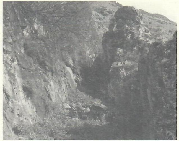
Res. 3. Karahayit Kabartmasının bulunduğu alanda yarılarak açılan kanal hattı.

linde aslan, koç, geyik, boğa ile rozet çiçekli kabartmalar bulunur. Ayaklar bitişik olup, elbise kaide üstüne kadar dökülmekte ve kült heykelinin her iki yanında, onun atribütü olan birer köpek (yada erkek geyik) yer alır. Tanrıça kollarını öne doğru bereket dağıtırcasına uzatmıştır.