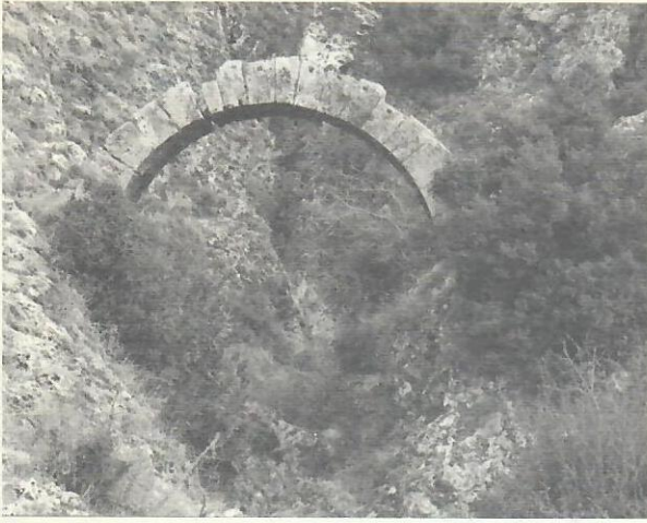
Res. 2. Karahayit hattı üzerinde yer alan Roma Dönemine ait su kemeri.