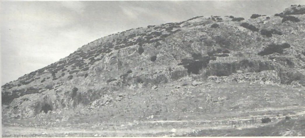
Res. 1. Hierapolis'e Kızılcahamam kaynağından su sağlayan Çökelez Dağı eteğindeki Karahayit hattı.

Bütün olarak tanrıça kült heykelini ele alacak olursak; Efes Artemis kült heykelinde olduğu gibi 4 , başındaki yüksek polosun en üstünde cephesi dört sütunlu bir İon tapınağı, altlarda da kemer taşıyan sphenks ve griphonlar, başının iki yanında aslan ve boğa griphonları kulakları küpeli, boynunda iki sıra kolye, göğüs üzerinde küçük yumrulardan meydana gelen girland çelengi, onun altında burçlar, göğüs altında iri testisler (yumurtalar), kült elbisesi üzerinde ise sıralar ha-