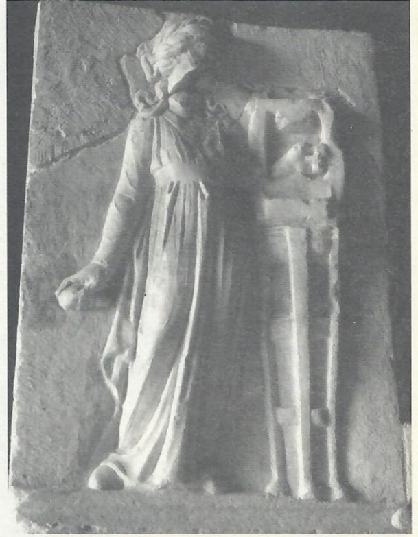
Res. 7. Hierapolis tiyatrosu sahne kabartması. Apollon Kitharodos (Hierapolis Arkeoloji Müzesi).

Dionysos, Hierapolis sikkelerinde de elinde şarap fiçileriyle gösterilmiştir 31 . Hierapolis'in baş tanrısı Apollon Kitharodos (Archegetes), M.Ö.2.yy'dan itibaren sikkeler üzerinde resmedilmiştir 32 . Ancak onun Efes Artemis kült heykeliyle birlikte sikkeler üzerinde betimlenmesi, imparator Traianus (M.S.98-117) sonrasında başlamıştır 33 . Hierapolis, Marcus Aurelius (M.S.161-180) döneminden itibaren, Efes ile birlik sikkeleri basmaya başlamış olup, bu Commodus (M.S.180-192), Philippus (M.S.244-249) ve Valerianus (M.S.253-260) dönemlerinde de devam etmiştir 34 . Hierapolis sikkelerinde göğüs altında kemerlenen uzun chitonu ve sol omuzuna yasladığı lyrasıyla betimlenen Apollon Kitharodos'un (Archegetes) tipi ve unvanı tanrının dinsel tapımı ve gizemli öğretisiyle ilgilidir 35 .