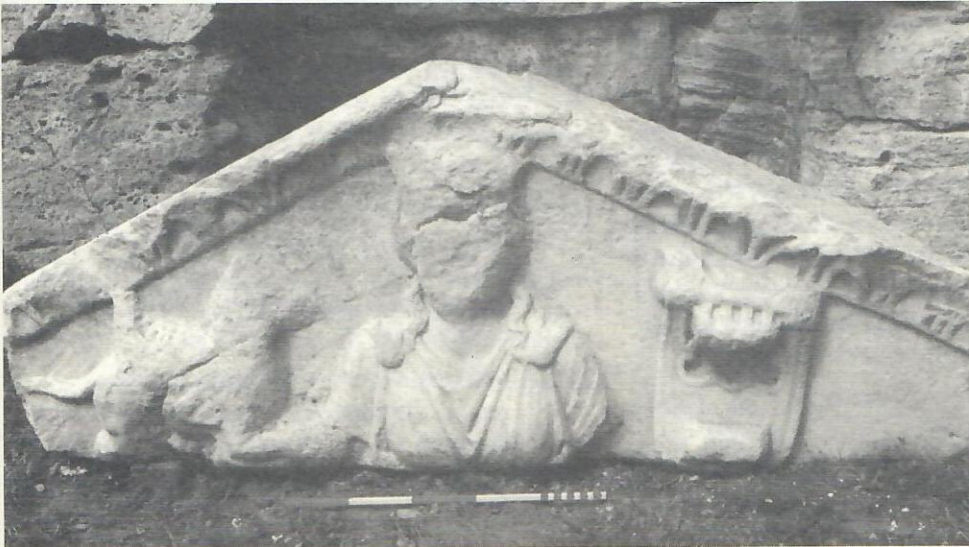
Res. 10. Hierapolis Triton Çeşmesi alınlık kabartması. Apollon Kitharodos (Hierapolis Arkeoloji Müzesi).

Saç tipindeki benzer özellikler, Septimius Severus dönemine tarihlenen Efes Müzesi'ndeki başlarda da görülmektedir 48 .