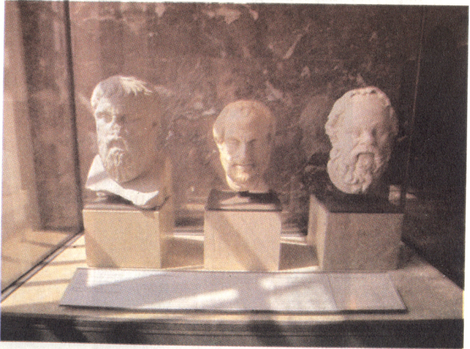
Resim 10: Mermer filozof başları; solda Platon, ortada Aristoteles, sağ- da Sokrates (Louvre Müzesi).