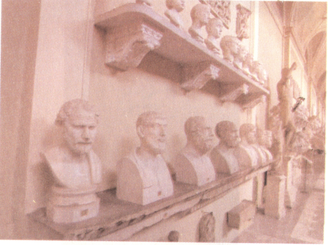
Resim 9: Filozof büstleri, önde solda Demosthenes (Vatikan Müzesi).