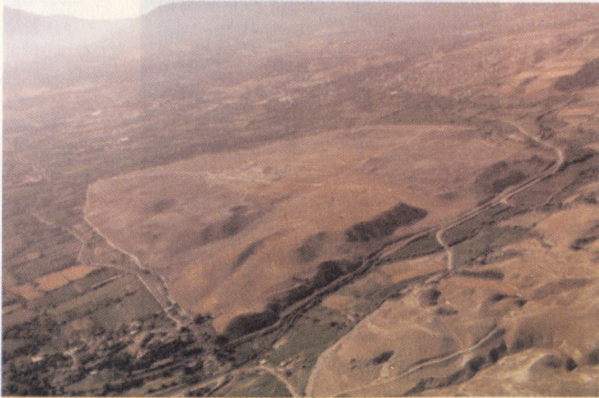
Resim 4: Laodikeia antik kentinin havadan görünümü.