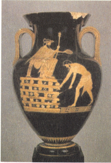
Resim 6: Çömlekçi ve ressam Myson tarafından yapılan kırmızı figürlü amphora (çift kulplu testi) üzerinde Lidya Kralı Kroisos' un yakılması sahnesi (Paris Louvre Müzesi; http://88.218.128.7 ).