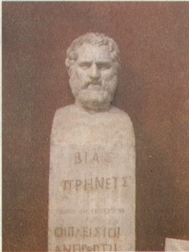
Resim 8: Bias'ın mermer büstü (Vatikan Müzesi).