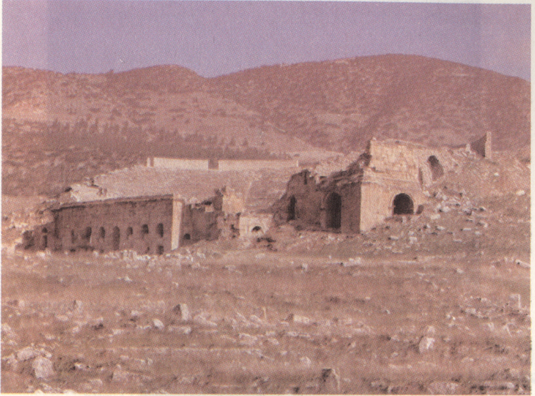
Resim 3: Hierapolis Tiyatrosu.