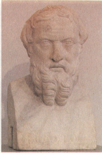
Resim 7: Tarihçi Herodot'un mermer büstü (Metropolitan Museum; http://en.wikipedia.org/wiki/file:Herodotos_Met_9 ).