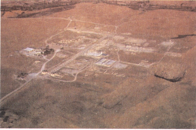
Resim 5: Laodikeia antik kentinde kazı ve restorasyonu yapılan alanların havadan görünümü.