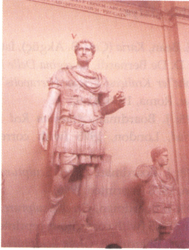
Resim 11: Mermer zırhlı İmparator Hadrianus heykeli (Vatikan Müzesi).