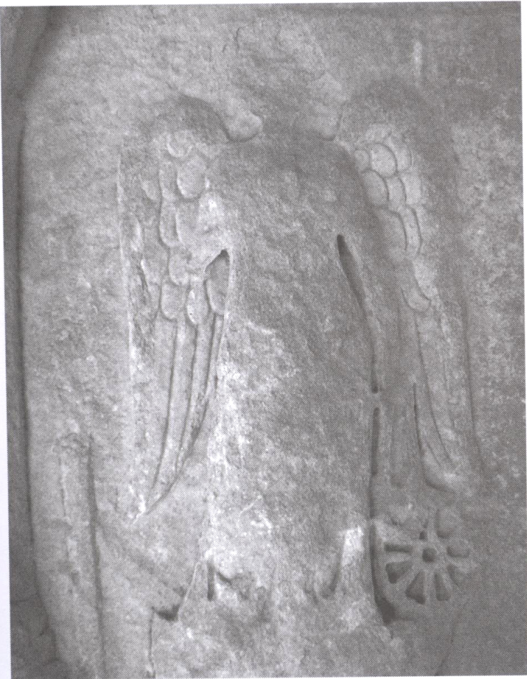
Resim 3: Ayasuluk'ta bulunan Efes Nemesis Adak Steli'nden Nemesis detayı.