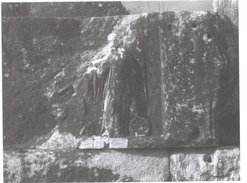
Resim 4: Efes Magnesia Kapısı'ndaki Nemesis Kabartması.