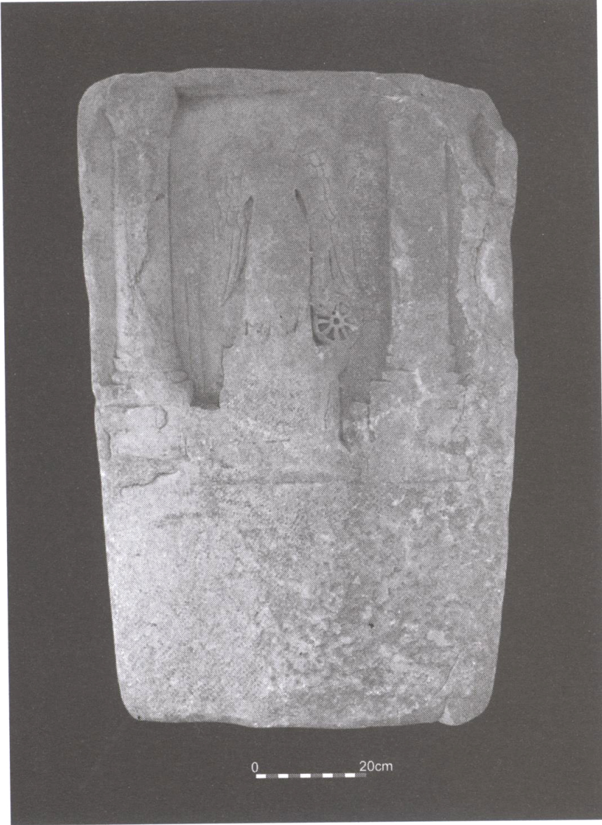
Resim 1: Ayasuluk'ta bulunmuş Efes Nemesis Adak Steli.