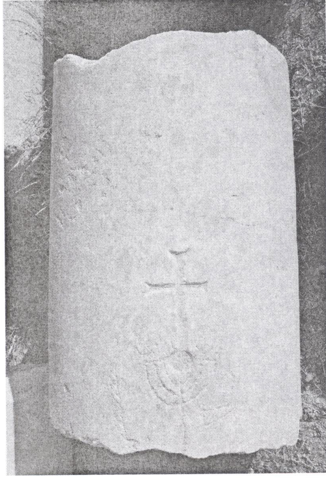
Res. 3. Menorahlı hac betimli sütün parçası