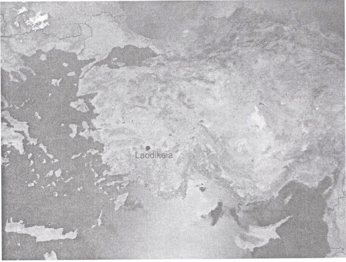
Res. 1. Laodike'nun konumunu gösteren bir uzay fotoğrafi