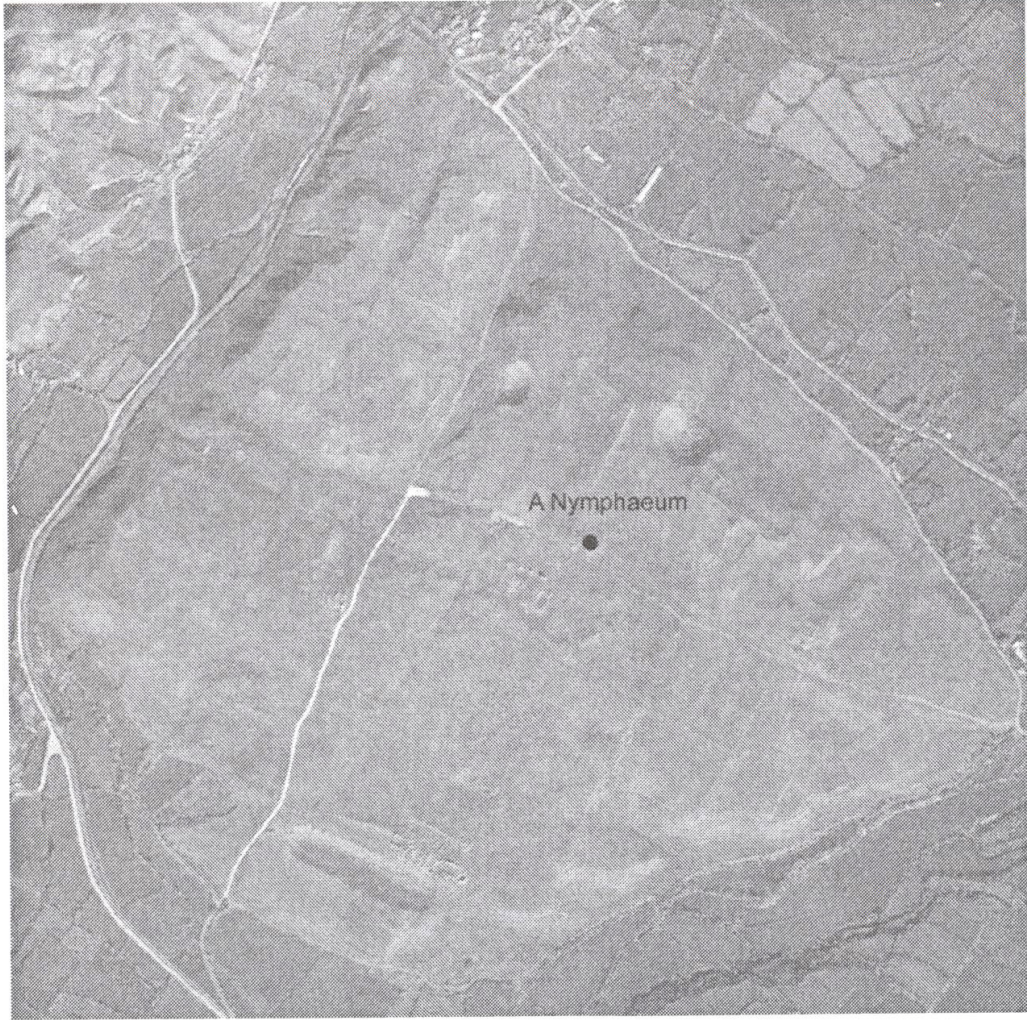
Res. 2. Nymphaeum ve çevresinin bir hava fotoğrafı