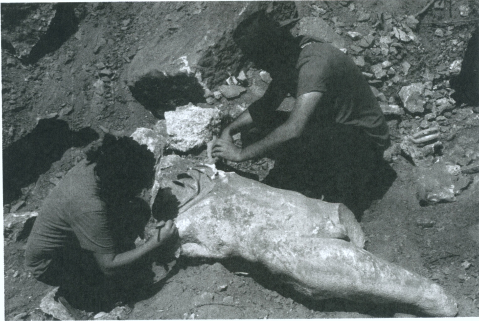
Res. 8 Erkek heykeli üzerinde yapılan temizlik çalışmaları

Aizanoi'da 2013 yılı stadion çalışmasında bulunan çıplak erkek heykelinin 27 boynundaki pelerin dışında figürle ilişkili bir atribü veya nesneye, tam olmadığı için ulaşılamamıştır. Bu durum figürün kimliği hakkında kesin bir saptama yapmayı zorlaştırır.