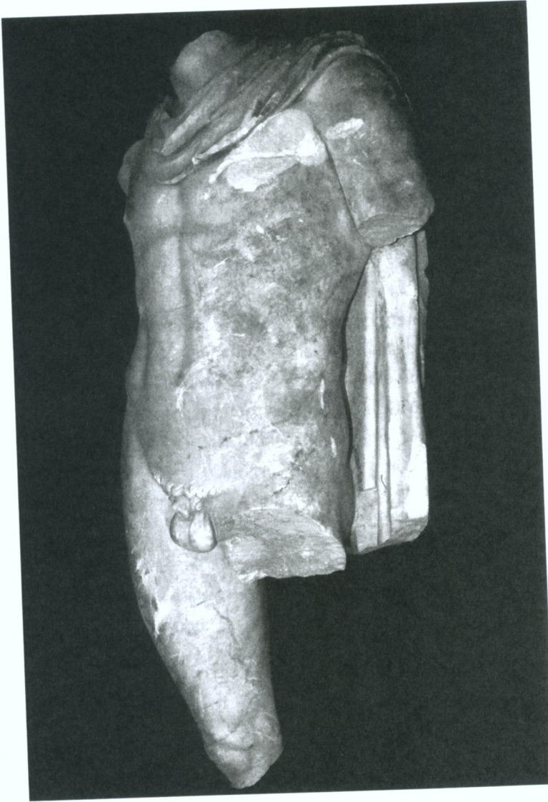
Res. 9 Erkek heykelinin \frac{3}{4} soldan görünüşü

kaynaklanan genç ve güçlü bir heros olarak betimlenmiş olup, çıplak ve atletik gövdesi, boynunda sağ omuz üzerinden broşla tutturulan pelerin ( khlamys ) ile hareketlendirilmiştir. Aizanoi torsosu ile benzer şekilde betimlenen gövde yapısı, pelerinin ( khlamys ) yanı sıra ağırlık taşıyan ve hareketi sağlayan bacaklar da paraleldir. Ancak Meleager heykellerinde, pelerinin ( khlamys ) kalça üzerinden öne çekilerek sol kol üzerine atılması, diğer yandan başın kuvvetlice sola döndürülmesi ve yaslandığı mızraktan dolayı gövdede oluşan duruşun daha esnek oluşu, Aizanoi heykeli ile stil yönünden farklılık taşıyan özelliklerdir.