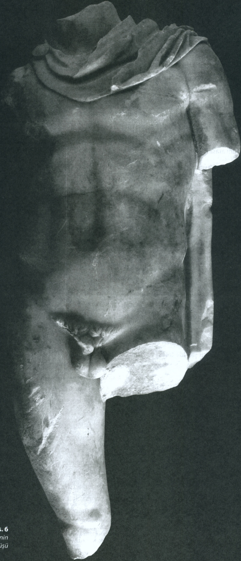
Res. 6 Erkek heykelinin önden görünüşü