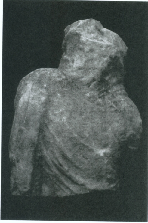
Res. 4 Kadın heykelinin arkadan görünüşü

sarkıtılmıştır. Eserimizde, kumaş tomarı bileğe sarılmasına rağmen, kol altında kalan bölümde gövde, kumaşının devam edişi, artan kumaşın gövde sol yanından, sol bacak yanına sarkıtıldığını gösterir. Aizanoi örneğinde, gövde altı ve sol el parmaklarının eksikliği, sol elinde bir nesne tutup tutmadığını anlamamızı zorlaştırırsa da benzer örnekleri nadiren bir kumaş parçası veya başak-haşhaş tutar ancak genelde el zarifçe karın üzerine bir şey tutmaksızın dayanır.