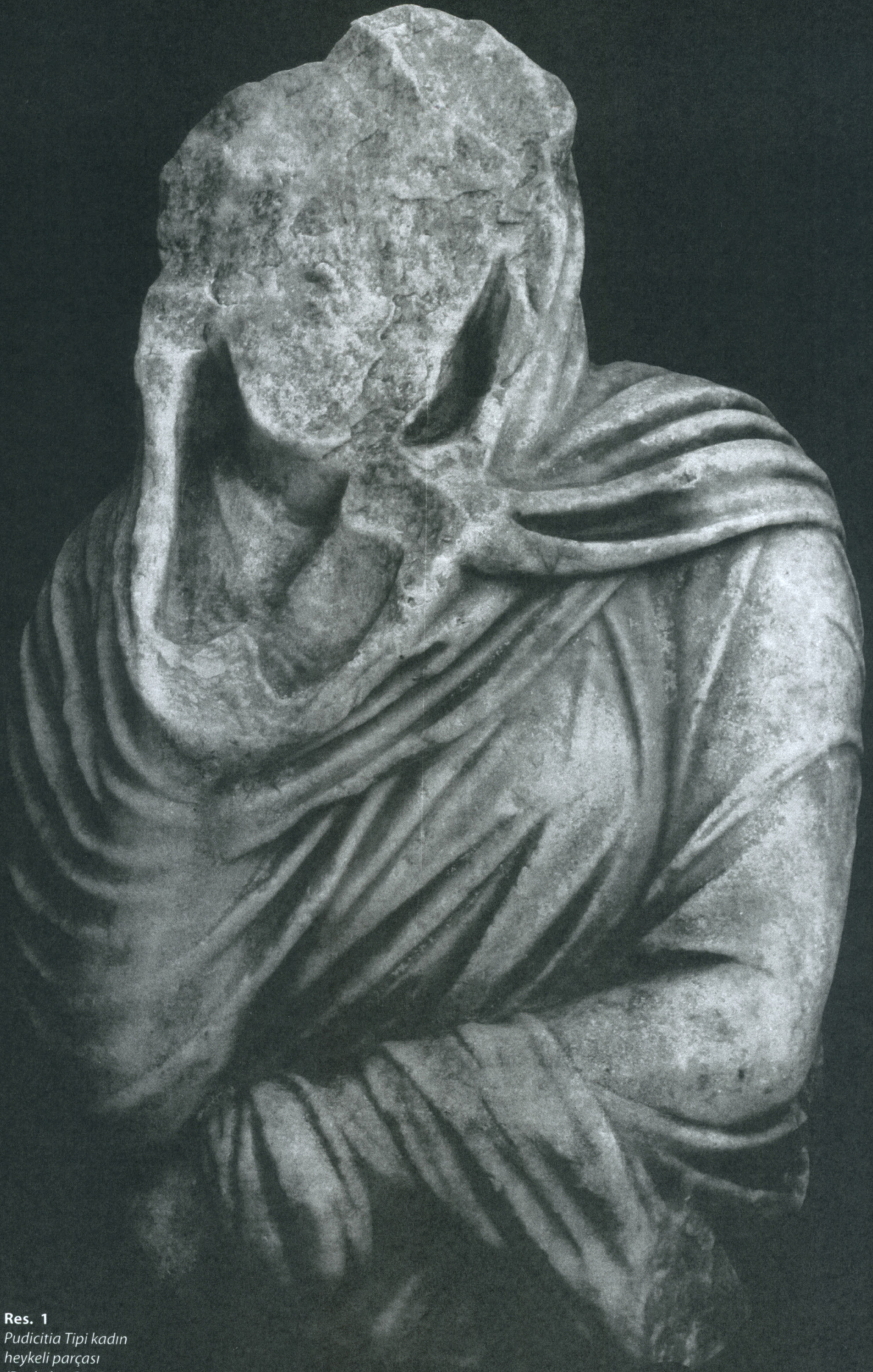
Res. 1 Pudicitia Tipi kadın heykeli parçası (Penkalas Çayı'ndan bulunmuştur)