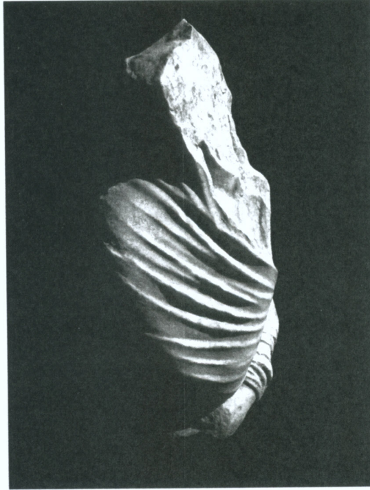
Res. 5 Kadın heykelinin sağ yandan görünüşü

Yukarıda saydığımız örneklerin Aizanoi'da bulunan pudicitia tipi kadın heykeli ile taşıdığı paralellik, eserin MS 2. yy'da, Hadrianus-Antoninler döneminde yapıldığını düşündürür.