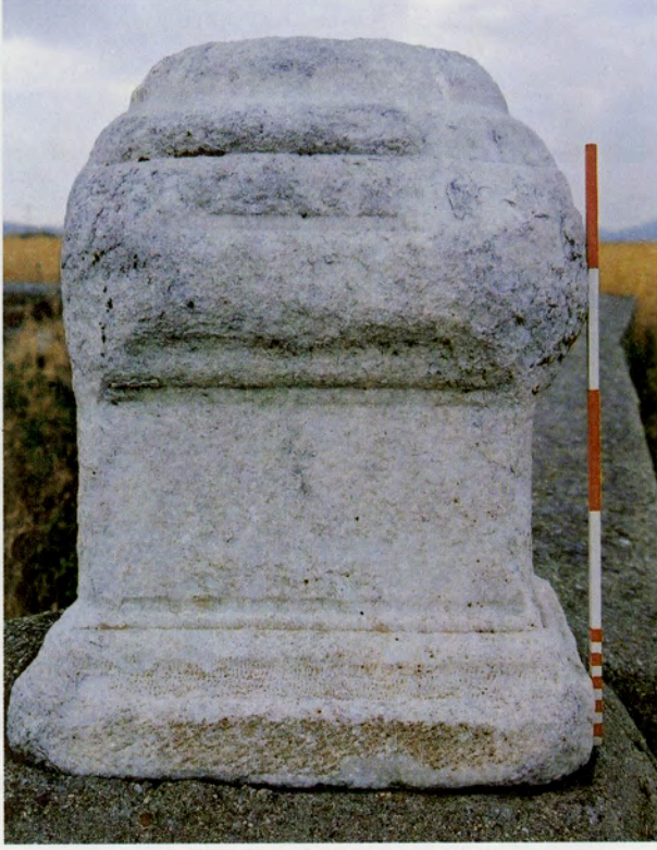
Resim 1: Savran Köyü mezarlığındaki postament