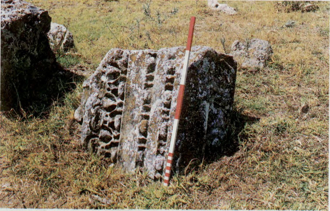
Resim 4 : Tuğcu Köyü mezarlığındaki arşitrav-friz bloğu