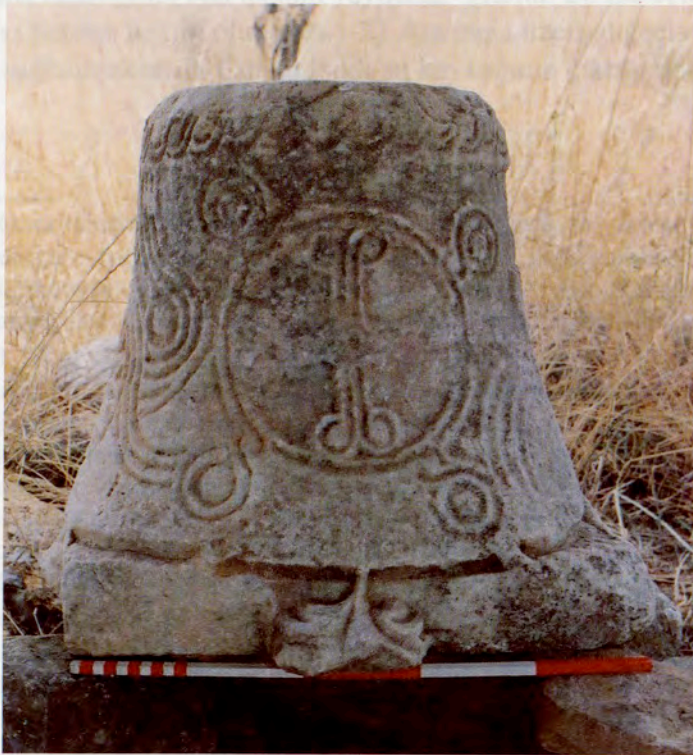
Resim 22 : Tokça Köyü Mezarlığı'ndaki başlık