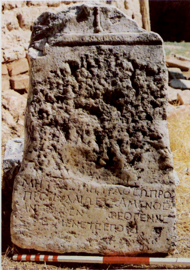
Resim 20 : Emirhisar Kasabası'ndaki adak steli