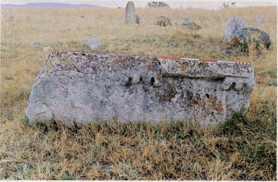
Resim 5 : Savran Köyü mezarlığındaki Dorik arşitrav bloğu