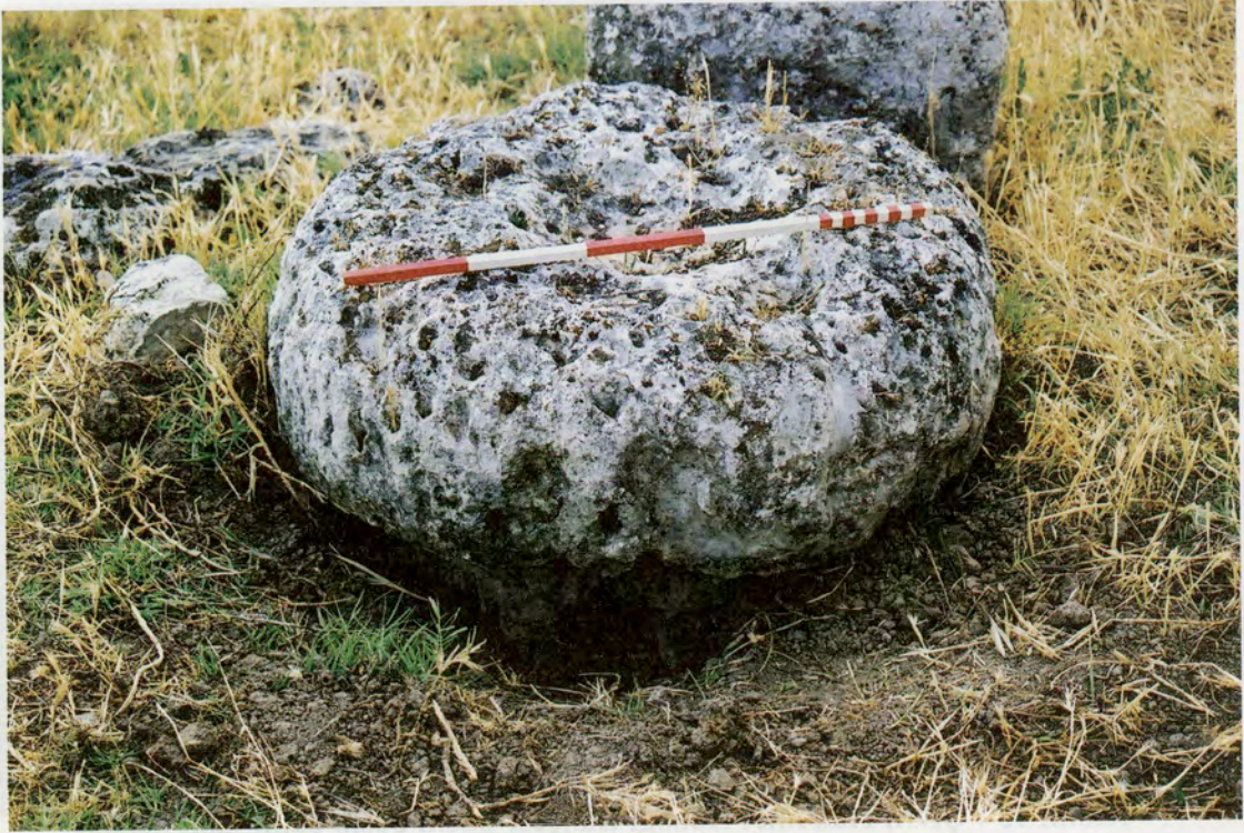
Resim 15 : İnce Köyü mezarlığındaki fallos