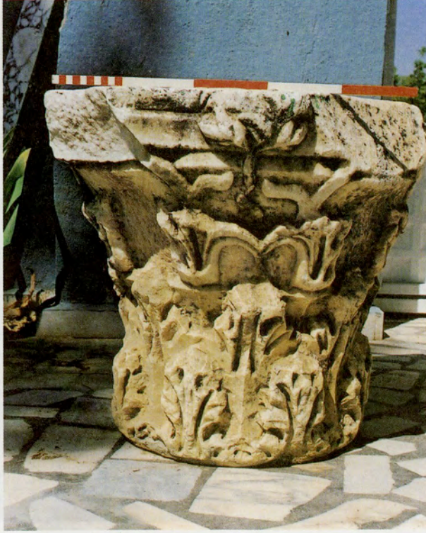
Resim 2: Emirhisar Dede Köyü camii avlusundaki korinth başlığı