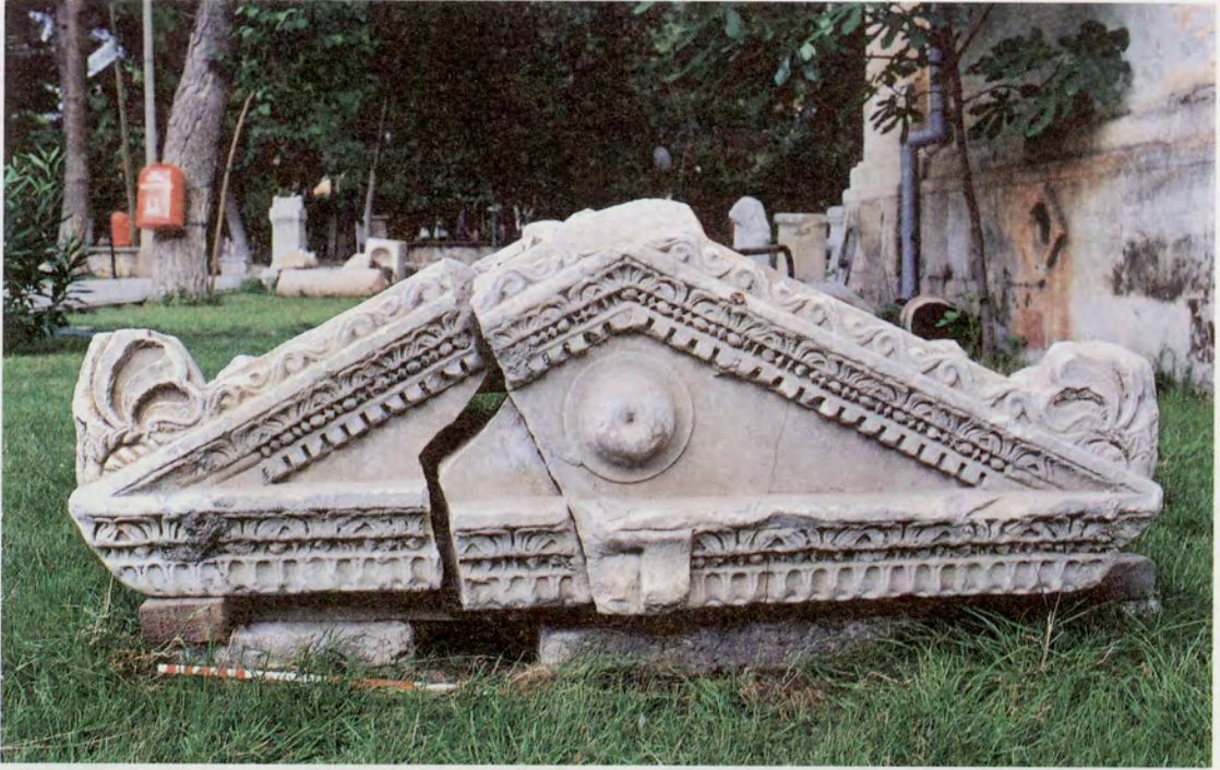
Resim 13 : Çivril Hükümet Konağı Bahçesi'ndeki beşik çatılı lahit kapağı