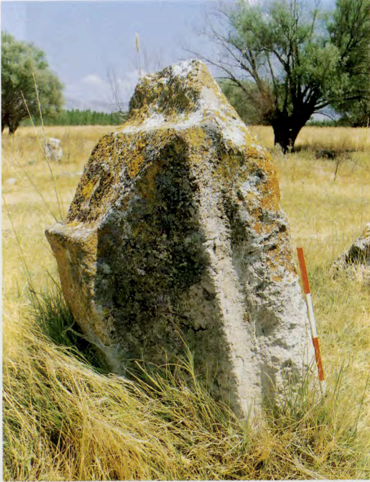
Resim 10 : Tuzcu Kyü Mezarlıđı mezar anıtı ta blođu