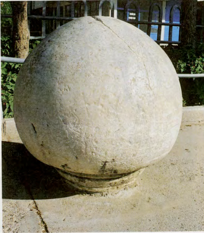
Resim 16 : 30 Ağustos İlköğretim Okulu bahçesindeki fallos