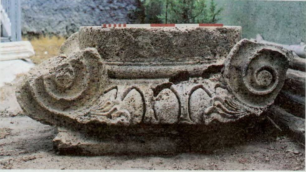
Resim 3 : Savran Köyü avlusundaki oin başlığı