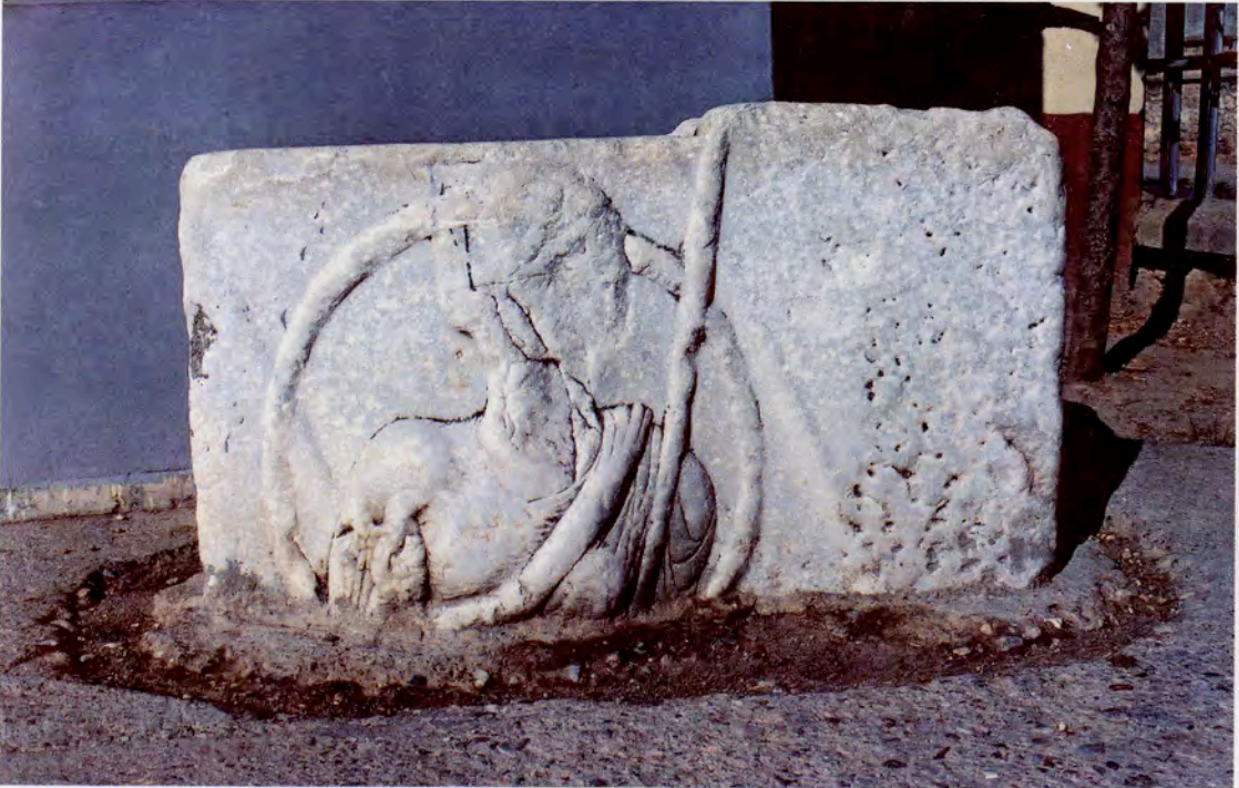
Resim 18 : 30 AĐustos İlköĐretim Okulu Bahesi'ndeki Zeus kabartması