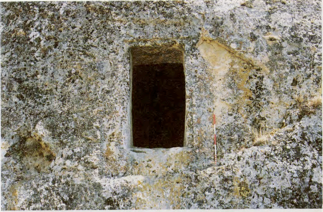
Resim 9 : Yavuzca iftliđi kaya mezarı