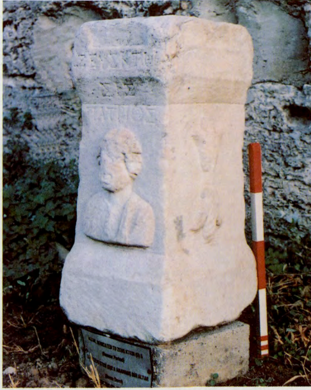
Resim 19 : Hierapolis Arkeoloji Müzesi'nde bulunan Zeus Ktesios Patrios'un atları