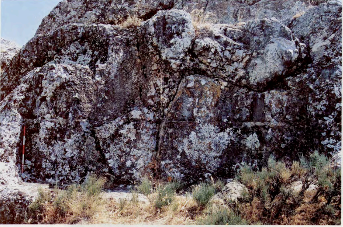
Resim 17 : Yavuzca iftliĐi kaya kabartması