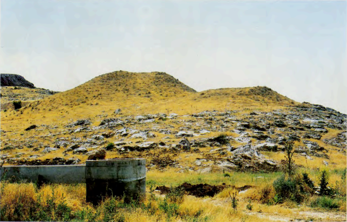
Resim 8 : Yavuzca iftliĐi Tmlsleri