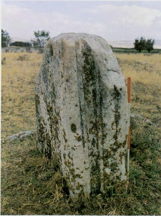
Resim 6 : İnce Köyü mezarlığındaki toikhobat bloğu