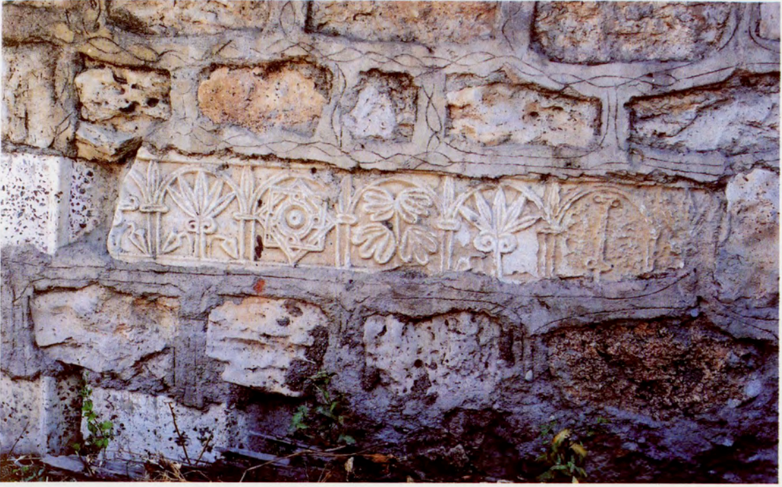
Resim 21 : Yalın Köyü camii bahçe duvarındaki blok