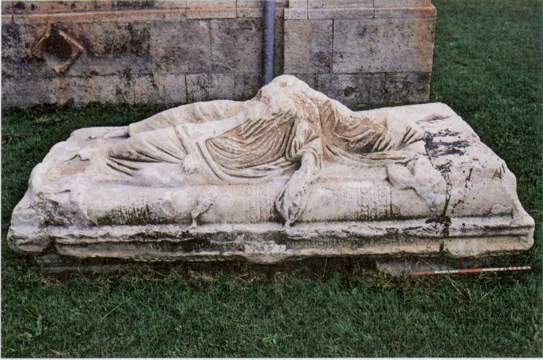
Resim 11 : Çivril Hükümet Konağı bahçesindeki klineli lahit kapağı