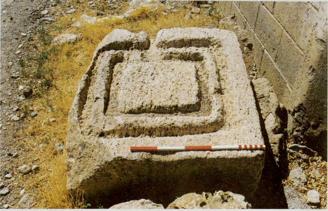
Resim 7: Emirhisar Kasabası'ndaki pres altlığı