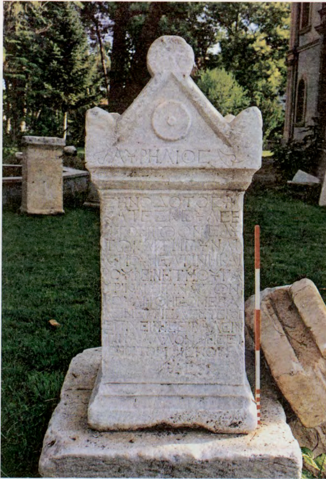
Resim 14 : Çivril Hükümet Konağı Bahçesi'ndeki Eumeneia tipi mezar taşı