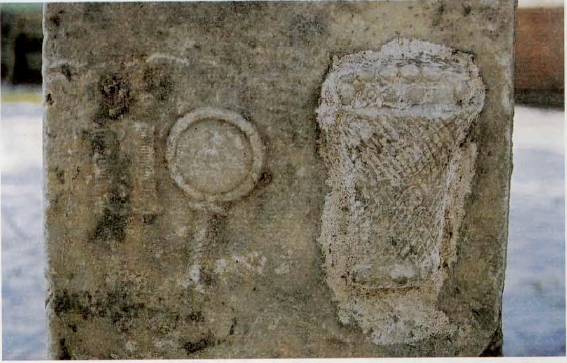
Resim 24b : Pudicitia tipinde kadın kabartmalı ve yazıtlı mezar taşından yün sepeti, ayna ve tarak kabartmaları