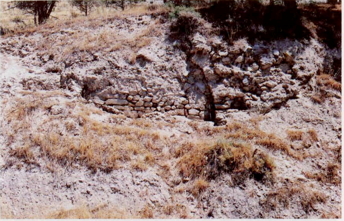
Resim 17 : Örgü tonuzlu mezar