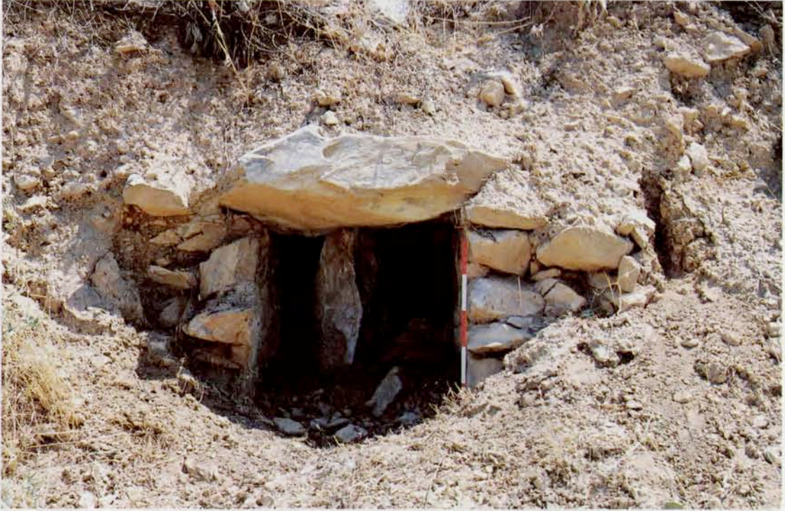
Resim 14 : Örgü tekne mezar