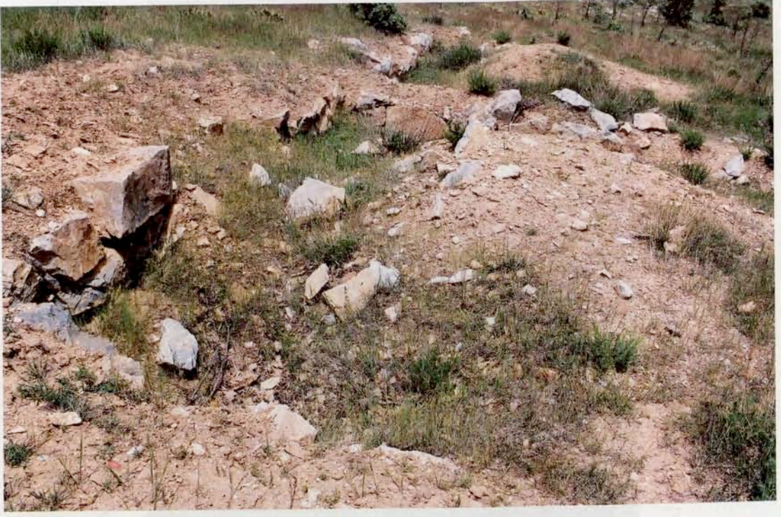
Resim 9 : Dükkan sıraları