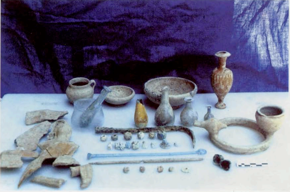
Resim 15 : Sertarkaşı mevkiinde ortaya çıkarılan örgü mezar buluntuları