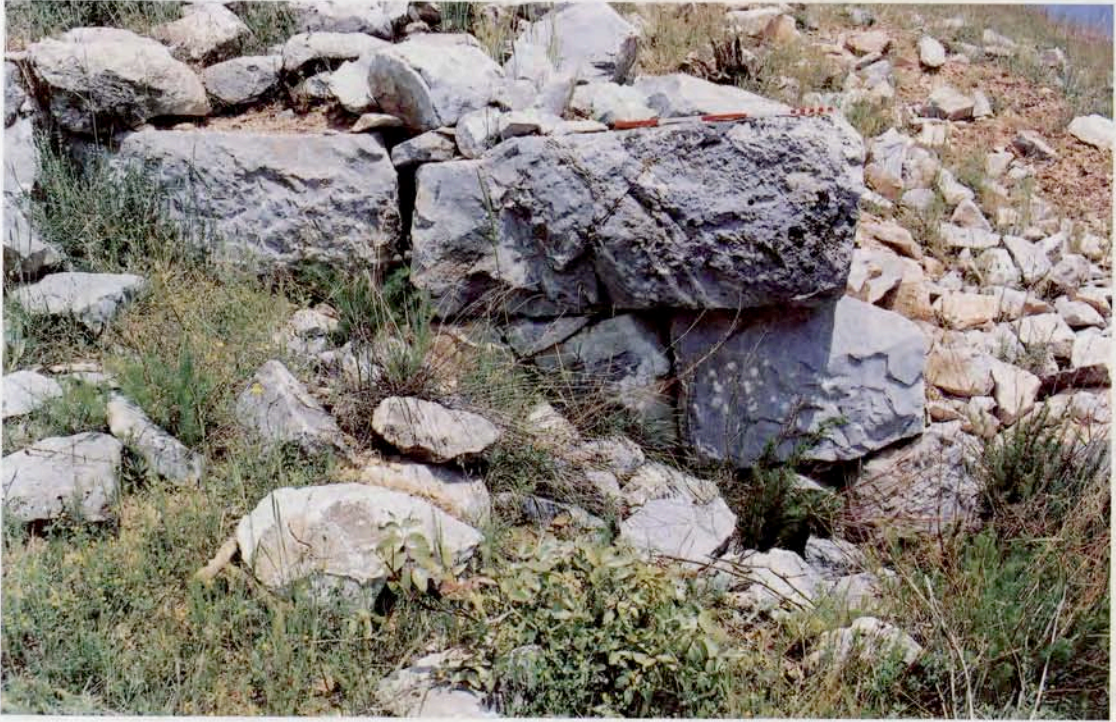
Resim 8 : Hellenistik yapı duvarları