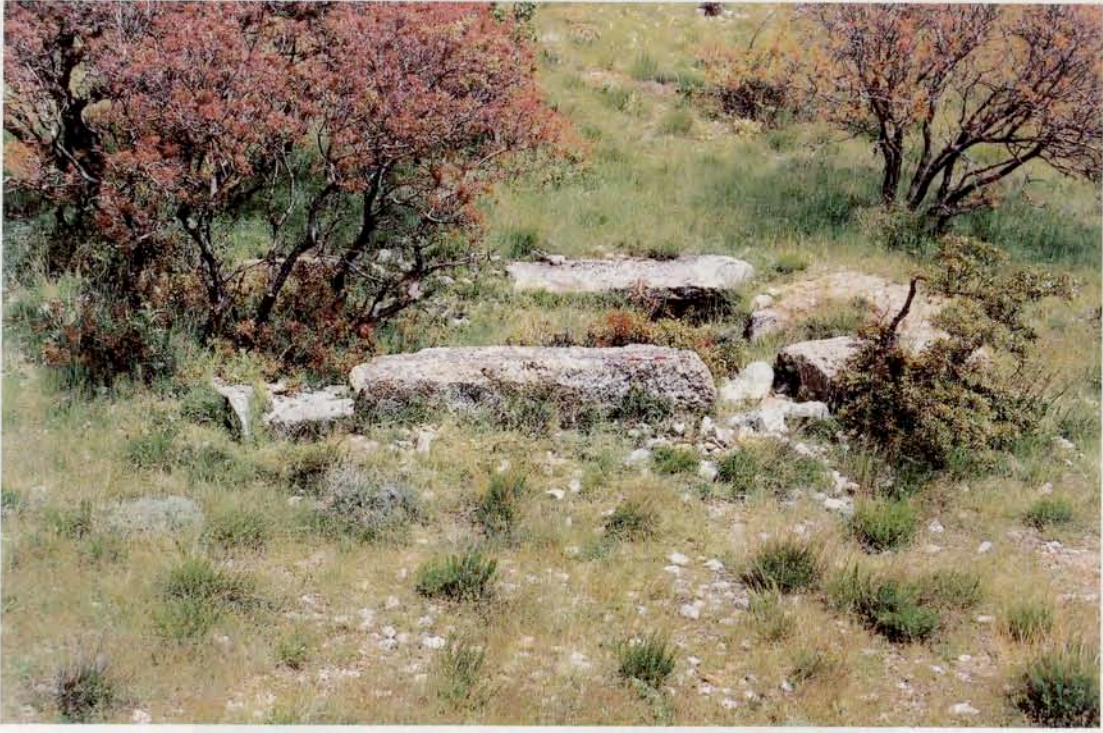
Resim 7 : Hellenistik tapınak