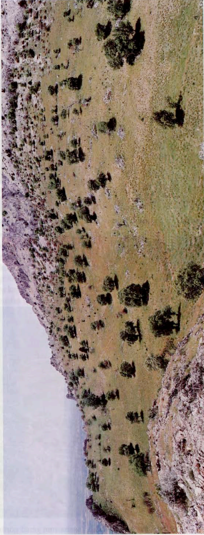
Resim 3 a-b : Hellenistik Eumonia antik kentinin kuzeydogudan genel görünüŧü