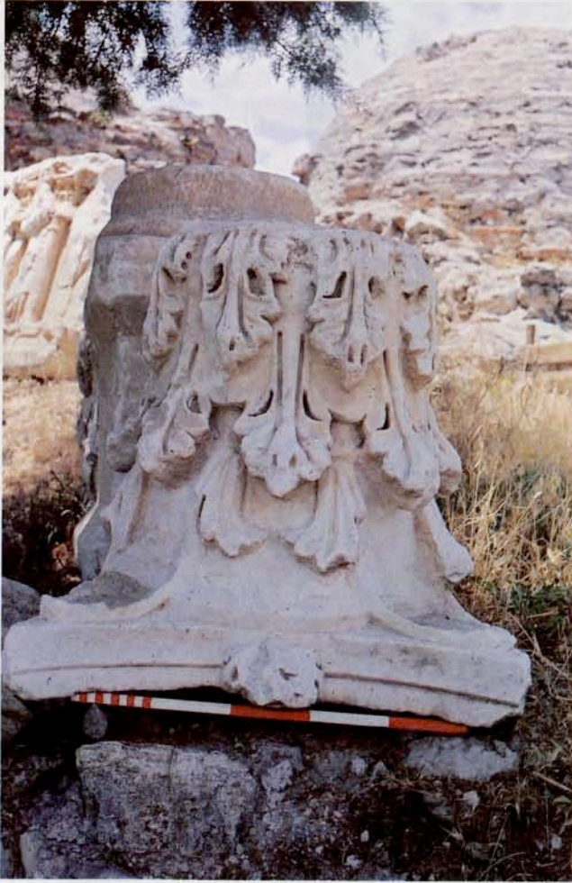
Resim 20 : Korinth başlığı (M.S. 2. yy)