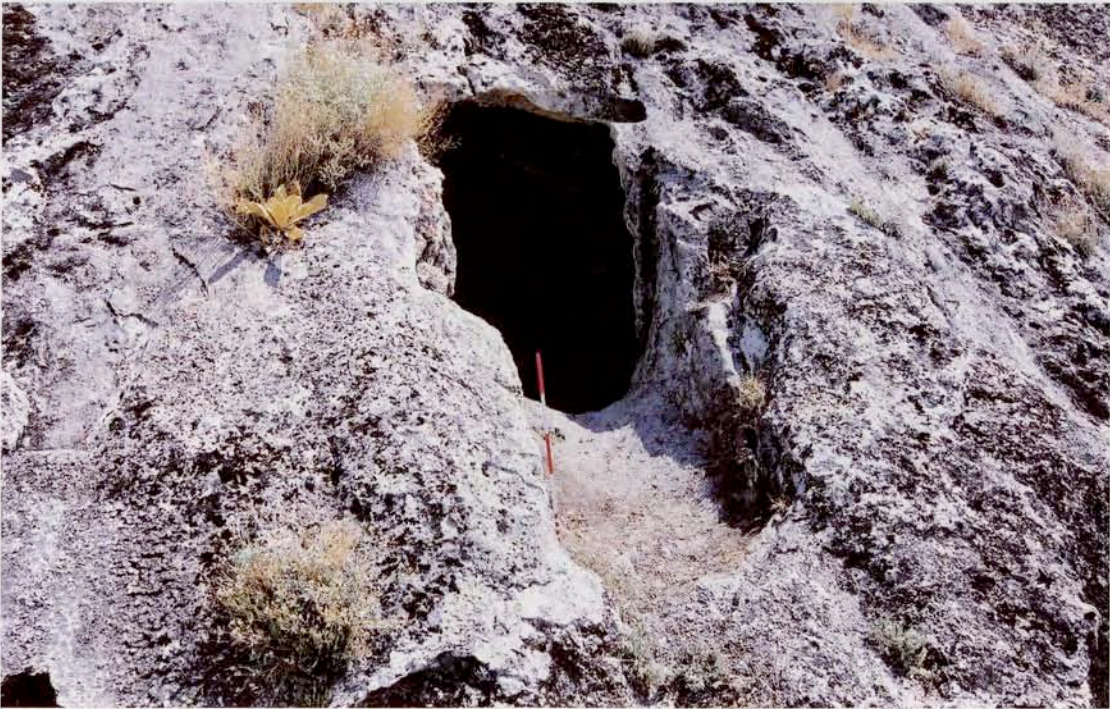
Resim 12 : Kaya mezarı