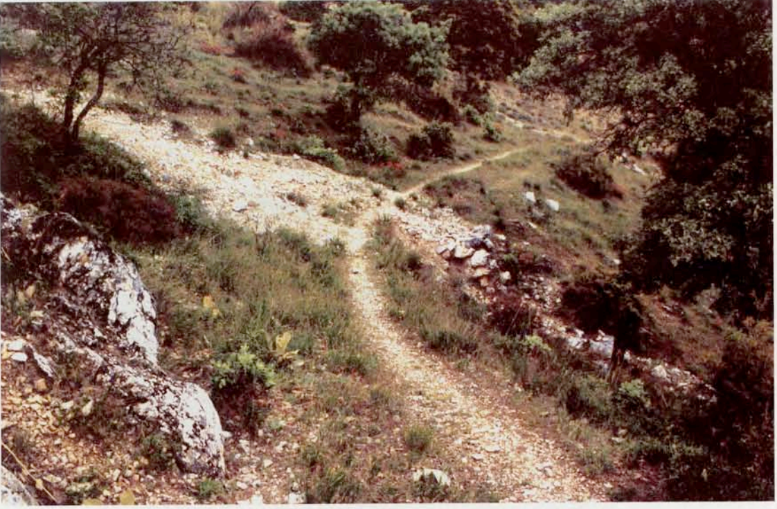
Resim 5 : Kuzeydođu ynden kente giriř yolu