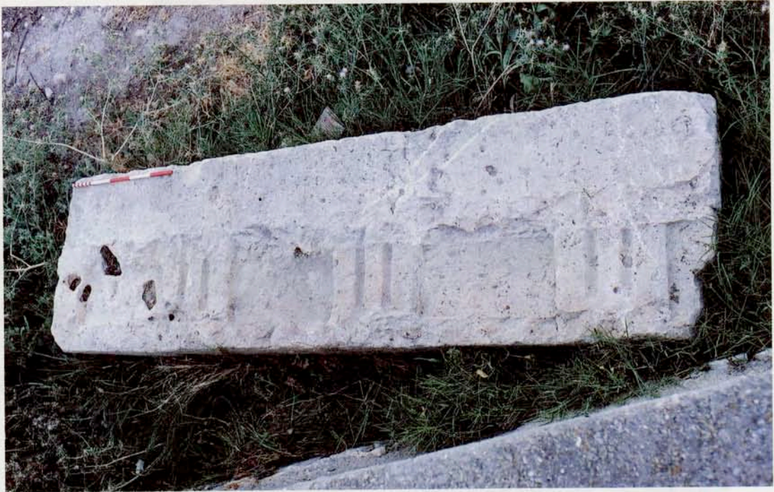
Resim 22 : Triglif-metop (M.S. 1. yy)