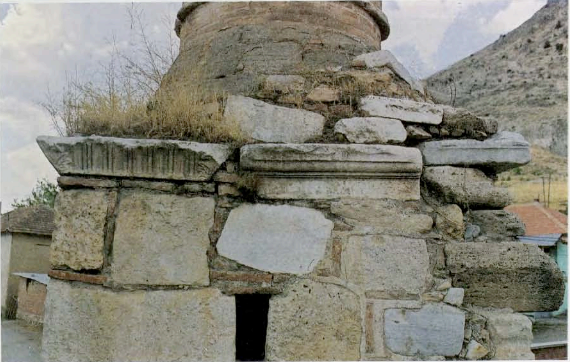
Resim 25 : Yukarı camii minaresinde yer alan spolien mimarı parçalar