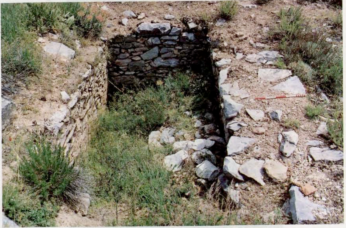
Resim 10 : Dikdörtgen yapı