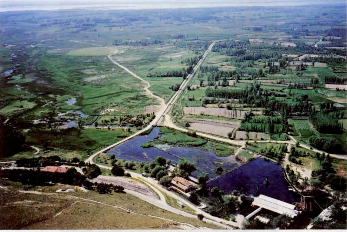
Resim 1 : Sarıbaba tepesinden Işıklı kaynağı ve çevresi