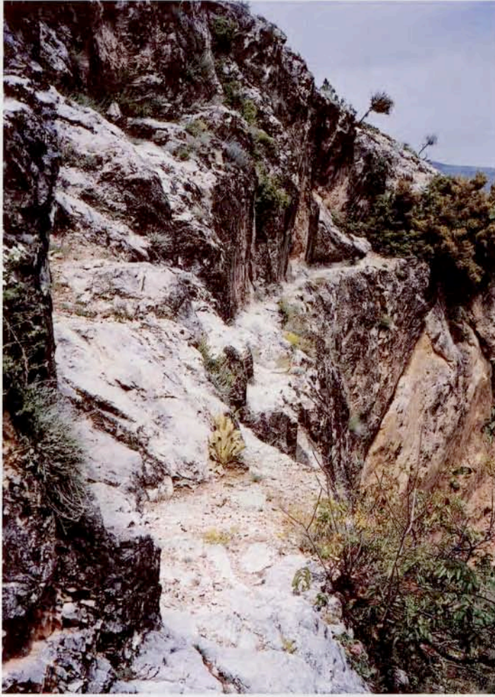
Resim 11 : Kuzeydođu ynden kente ulařan su yolu