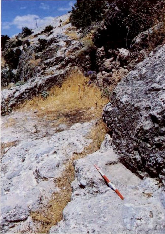
Resim 16 : Alt kısmı kayaya oyulmuş anıtsal mezar