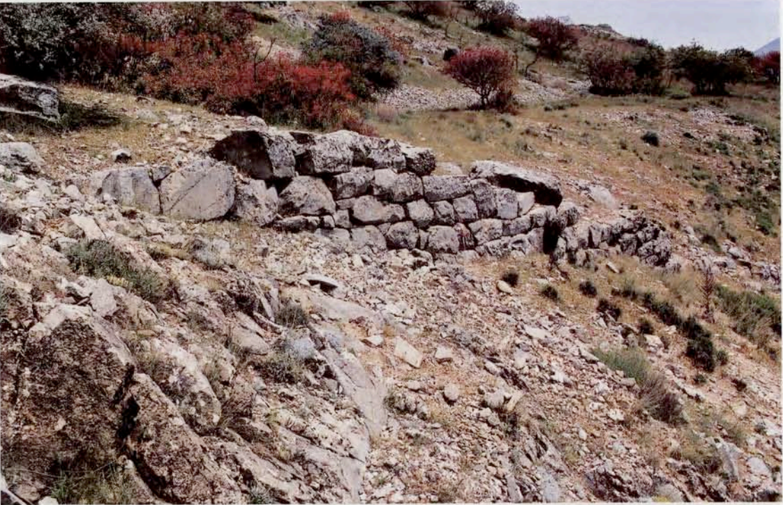
Resim 6 : Hellenistik sur duvarları