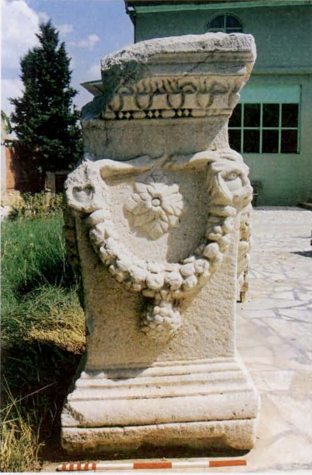
Resim 23 : Girland çelenkli, yaban keçisi başlı, kartal ve rozet kabartmalarıyla bezeli ve tabula ansatalı mezar taşı (M.S. 2. yy.)