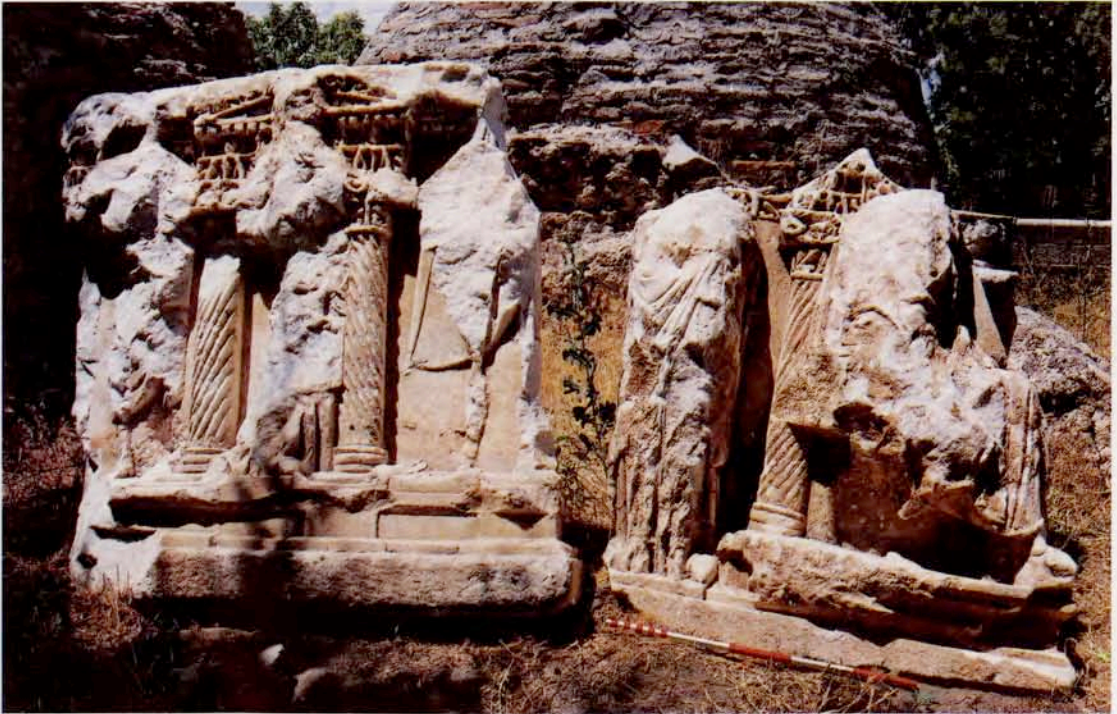
Resim 18 : Sütunlu lahit parçaları (M.S.3.yy başı)