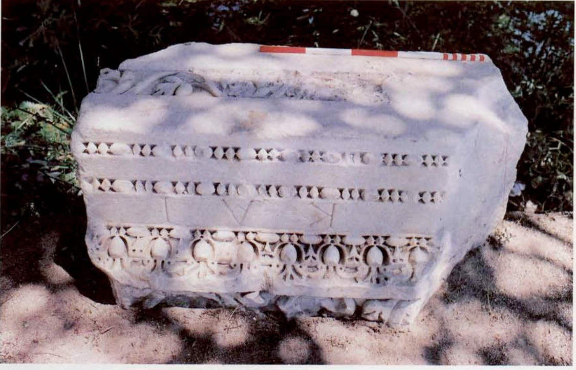
Resim 19 : Arşitrav-friz bloğu (Severiuslar dönemi)