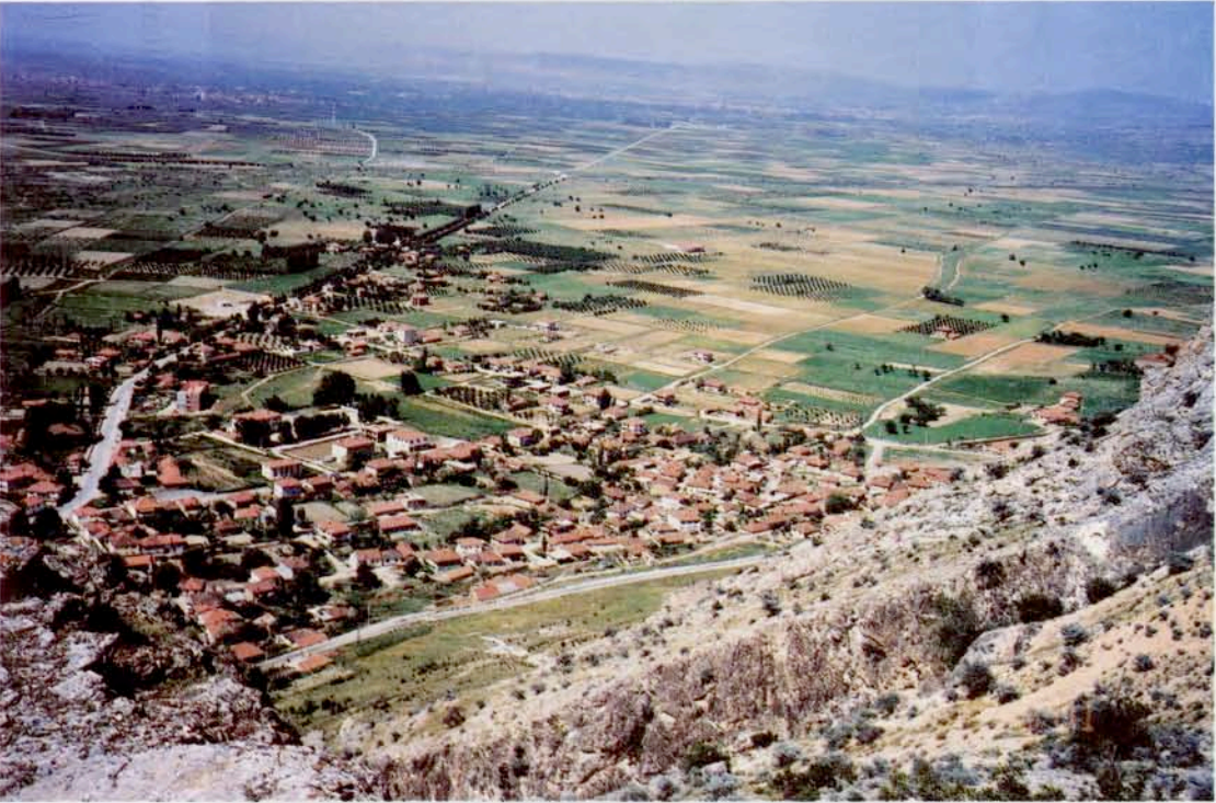
Resim 2 : Sarıbaba tepesinden Işıklı kasabasının genel görünümü