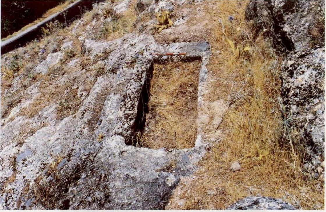
Resim 13 : Kaya oygu tekne mezar