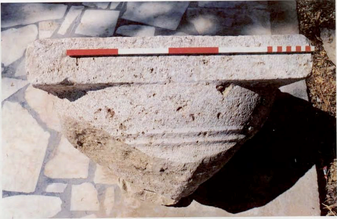
Resim 21 : Dor başlığı