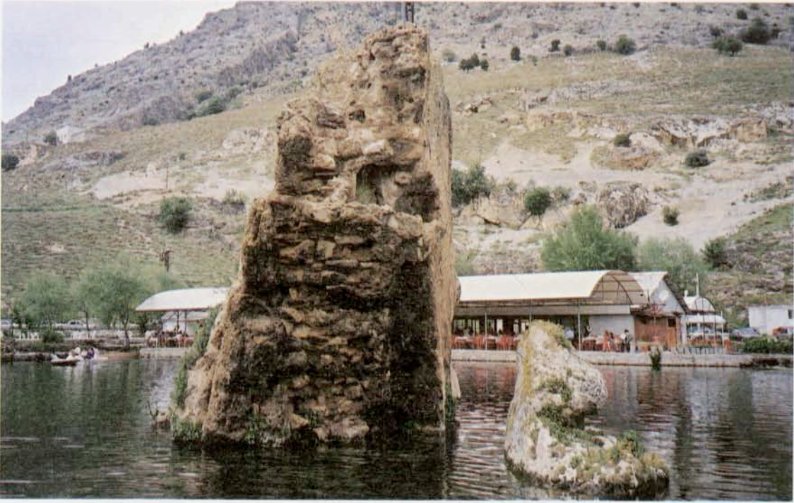
Resim 26 : Işıklı kaynağından su sağlayan kule ve dönme dolap sistemi