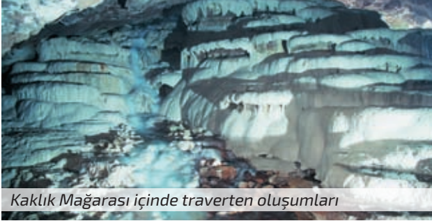
Kaklık Mağarası içinde traverten oluşumları

Hierapolis'te Hristiyanlık MS 1'inci yüzyıldan itibaren yayılmaya başlamıştır. Kentin kutsallığı ve önemi, MS 80 yılında on iki havariden biri olan Aziz Phillippus'un, yeni dini yaymak için Hierapolis'e geldiğinde, kızıyla birlikte martyr (din şehidi) edilmesinden kaynaklanmaktadır.