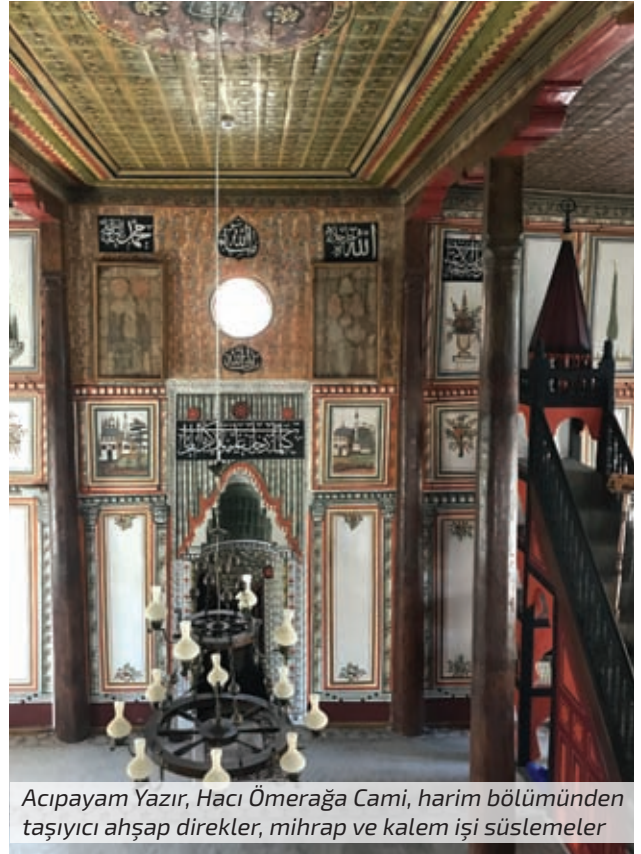
Acıpayam Yazır, Hacı Ömerağa Cami, harim bölümünden taşıyıcı ahşap direkler, mihrap ve kalem işi süslemeler

Lykos Vadisi içinde yer alan Hierapolis, Bizans tarihi için önemli bir kenttir. Çünkü bu kent, antik dönemdeki kutsallığını ve saygınlığını, Bizans Dönemi'nde de sürdürmüştür.