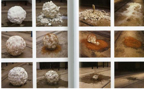
Görsel 3. Andy Goldsworthy ve Snowballs, 2000

mantığını keşfetmeyi amaçlamıştır (Yılmaz, 2013). Goldsworthy, doğada yok olabilen zararsız dokunuşlarla ilerlemeyi tercih eden bir sanatçıdır. “Sanatçının malzemesi doğanın kendisi, çalışmalarına hayat veren ise mevsimsel süreçlerdir. Amacı estetik bir kaygıyla, doğaya farkındalığı sağlamak düşündürmek, hissettirmektir. Çalışmaları yapım sürecinde de sonrasında da doğaya zarar verir nitelikte değildir” (Aydın ve Zümrüt, 2013, s. 62). Sanatçının 2000 yılında gerçekleştirdiği “Kartopu” adlı uygulamaları doğa ve endüstri ilişkisine gönderme yapan bir çalışmadır. “Sanatçı İskoçya’nın dağlarından getirilen 13 tane 2 metre çapında ve bir ton ağırlığında olan kartoplarını doğanın yıkımını eleştirmek amacıyla çeşitli fabrikaların önüne koymuştur. Her bir kartopunun içinde doğa, tarım ve endüstri ile ilişkilendirdiği bir materyal bulunmaktadır. Örneğin; İskoç sığırlarının kıllarının olduğu kartopunu bir et fabrikasının girişine koymuştur (Oğuz, 2015).