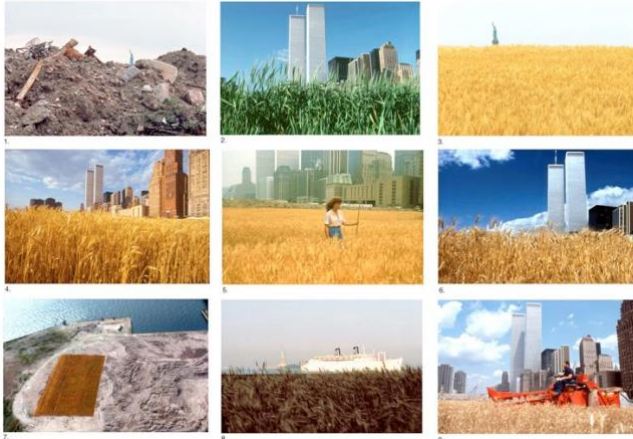
Görsel 12. Agnes Denes, Wheatfield, 1992