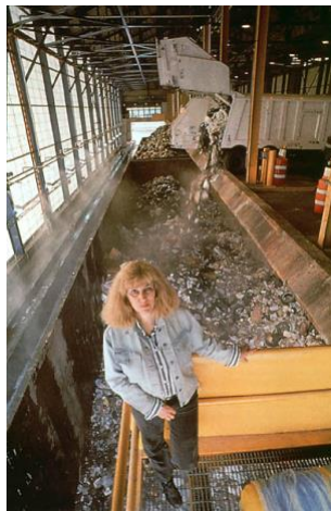
Görsel 8. Mierle L. Ukeles, Flow City, 1983

Mierle Laderman Ukeles çoğunlukla sosyal, politik, çevresel ve feminist teorinin bağlamı içinde sanat ve yaşamı birleşimi eserlere odaklanmıştır. Sanatçı özellikle tek kullanımlık çöpleri büyüyen bir problem olarak görmüş ve insan katılımına dayalı çalışmalarında atık materyallere odaklanmıştır (Krug, Blandy ve Congdon, 1998). "Flow City" adlı çalışmasında kentsel ekosistemi yeniden kavramsallaştırarak sanat yoluyla pozitif bir değişim yaratmak istemiştir. Nitekim Ukeles'e (2000) göre; en önemli peyzajlar durgun olanlar değil, hayatın akışını anlatanlardır" (aktaran Oğuz, 2015). Sanatçı New York şehrinde katı atık yönetimi konusunda vatandaşları bilinçlendirmeye çalışmıştır. Böylelikle doğa-kültür diyalektiğinin önemini gözler önüne sermek istemiştir.