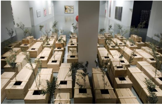
Görsel 10. Yoko Ono, Ex It, 1997-2007