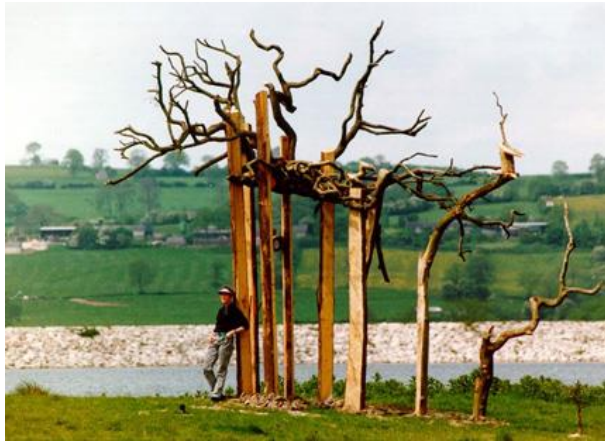
Görsel 5. Lynne Hull, Lightning Raptor Roost, 1994

Bir diğer sanatçı Lynne Hull’un çalışmalarında ise doğayı yeniden kazanmaya dönük öneriler gizlidir. Sanatçı vahşi yaşam alanlarının sürdürülebilirliğine ilişkin yapmış olduğu çalışmalarda estetik kaygı kadar işlevselliği ön planda tutmuştur. Vahşi yaşam alanlarında yapmış olduğu küçük iyileştirmeler, bir çeşit hayvanlar için sanat etkinliği gibidir. “Sanatçı “Lightning Raptor Roost” adlı çalışmasında göçmen kuşların konaklayabilmesi için bir dizi güvenli yer oluşturmuştur. Bu çalışma sonrasında yapılan araştırmada şahinlerin, baykuş ve kartalların buralarda yuva yaptığı kanıtlanmıştır”(Aydın ve Zümrüt, 2013, s. 63). Sanatçı “Sanat ve İklim değişikliği” adlı bir sergide ise “Vahşi Uyarı”, “Vahşi Hayat” yazan uyarı tabelaları ile küresel ısınma yüzünden ilk yok olacak canlı türlerine dikkat çekmek istemiştir (Oğuz, 2015).