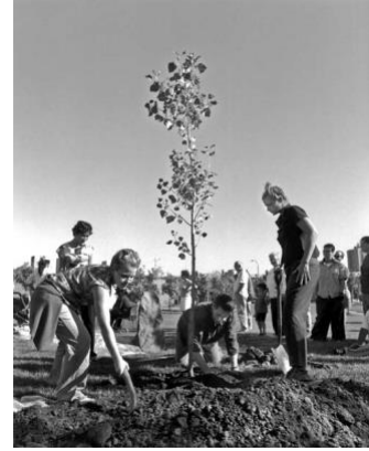
Görsel 2. Joseph Beuys, 7000 Oaks 7000 Basalt, 1982-1987