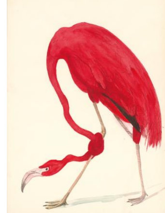
Görsel 13. Maro Michalakos, Untitled, 2014