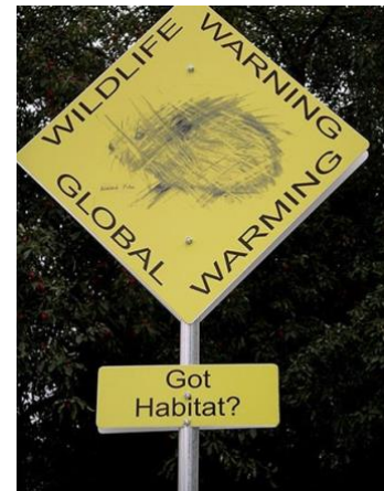
Görsel 6. Lynne Hull, Wildlife Wraning Signs, 2009