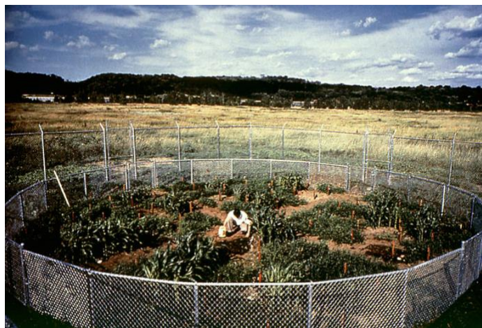
Görsel 9. Mel Chin, Revival Field, 1990