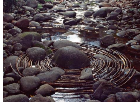
Görsel 4. Andy Goldsworthy, Emhemeral Works, 2004-2014