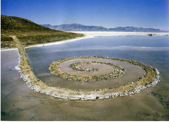
Görsel 1. Robert Rauschenberg, Spiral Jetty, 1970

çalışması olarak bahsedilen bu çalışma, petrol çıkarmak için kullanılmış ve zarar görmüş bir eko-sistem üzerinde gerçekleştirilmiştir.