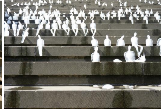
Görsel 11. Nele Avezedo, Melting Men, 2009

Yoko Ono farklı alanlarda ortaya koyduğu çalışmalarıyla tanınan bir sanatçıdır. Zeytin ağacı ve çeşitli ölçülerde 50 ahşap tabutla yaptığı “Ex It” (1997-2007) adlı çalışması mekânı özgü bir yerleştirmedir. Basit ve kaba işçilikle yapıldığı belli olan tabutlar doğal bir felaket ya da savaş sonrasında aceleyle kurulan bir toplu mezarı çağırıştırır. Kuş sesleri ile hareketlenen mekândaki her bir tabutun kapağındaki boşluktan uzanan ve gün geçtikçe büyüyen zeytin ağacı fidanları görülür. Çalışmada tabut ölümü, zeytin ağacı yeniden dirilişi, kuş sesleri ise doğanın gücüne ve enerjisine işaret etmektedir (Bafra ve Colombo, 2016). Sanatçının doğanın gücüne ve enerjisine olan inancı geleceğe dair bir iyimserliği barındırmaktadır.