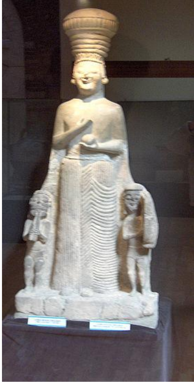
Resim 2. Ana Tanrıça Kybele.

Arkeokur.tumblr.com Erişim Tarihi: 10.05.2014