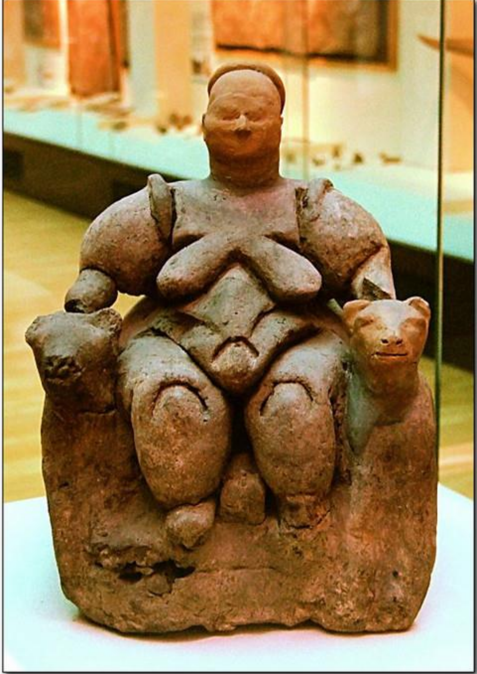
Resim 1. Çatalhöyük Ana Tanrıça kadın heykeli.

Blogspot.com.tr Erişim Tarihi: 10.05.2014