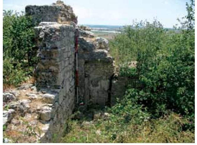
Res. 2 Sil09/02 no.'lu geç dönem mekânı Fig. 2 Room from the later periods (Sil09/02)

Sillyon'daki kuleleri önceki araştırmacılara kıyasla detaylandırarak ele almıştır (A. V. McNicoll, Hellenistic Fortifications from the Aegean to the Euphrates , 1997). 2007 yılında Varkıvaç akropolisteki pencere Hellenistik yapı hakkında bir yayın yapmıştır (B. Varkıvaç, "Zum Fenster des sog. Hellenistischen Baues in Sillyon", Adalya X, 2007).