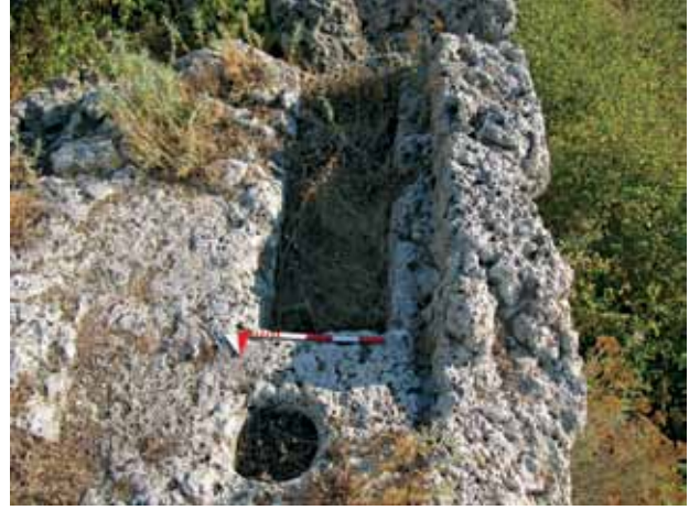
Res. 4 Sil09/91 no.'lu khamosorion tipi mezar ve sunu çukuru Fig. 4 Chamosorion and offering pit (Sil09/91)

Sillyon çevresindeki çalışmamız Antalya'ya 38 km. mesafedeki Tekkeköy'de devam etti. Yanköy'e giden yol sapağından kuzeye doğru çıkılarak ulaşılan köyde Bâli Baba Türbesi olarak adlandırılan mekân ve çevresindeki mezar taşları belgelenmiştir. Burasının erken dönemler-