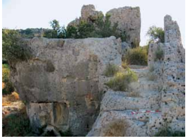
Res. 6 Sil09/A.24 no.'lu 2 odalı ve sarnıçlı mekân Kepez mevkii Fig. 6 Building with two rooms and a cistern at Kepez mevkii (Sil09/A.24)

den itibaren kutsal bir alan olarak kullanıldığı anlaşılabilmektedir. Türbe bir su kaynağı yanındadır ve erken dönem malzemeleri devşirme olarak kullanılmıştır.