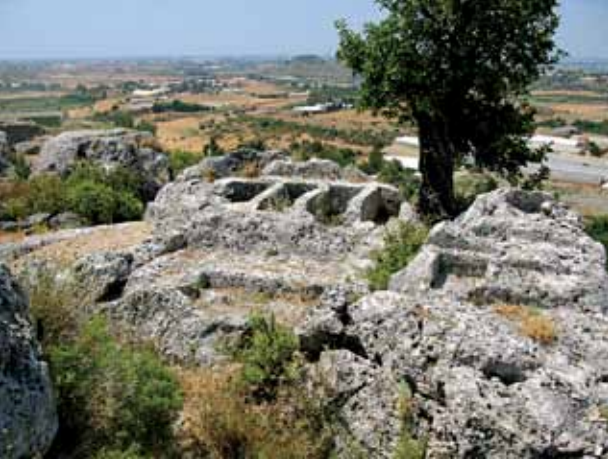
Res. 3 Sil09/60 no.'lu mezar kompleksi Fig. 3 Burial complex (Sil09/60)

edilen örneklerde bazen basık üçgen alınlıklı bazen de monolit büyük bloklarla tek parça halinde bazen de iki ya da daha fazla düzgün kesilmiş kireçtaşı blokla kapatıldığı gözlemlenmiştir (Res. 3-5).