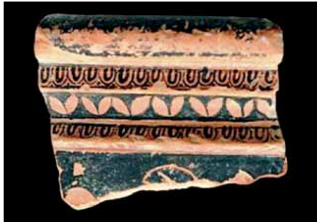
Res. 7 Kırmızı Figür krater parçası Fig. 7 Krater fragment with red figure decoration

Four inscriptions were identified at Sillyon and five in the surrounding areas. The inscription with inventory (Sil09/Inc.32) is found on a sarcophagus lid in the southwest necropolis and this six-line inscription is quite legible (Fig. 8). Due to the praenomen "Aur, this lid cannot be dated before the Constitutio Antoniana of A.D. 212. It reads as, "Aur(elius) Krateros, son of Krateros, had this kenotaphion made while he was still alive for himself, his