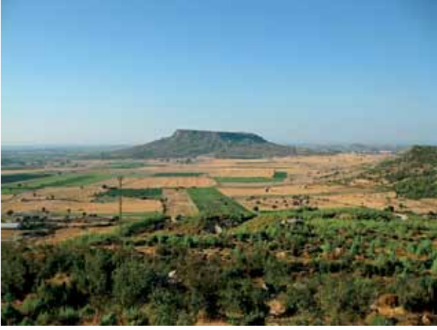
Res. 1 Sillyon, genel görünüm Fig. 1 Sillyon, general view