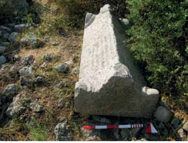
Res. 8 Sil09/32 no.'lu yazıtlı lahit kapağı Fig. 8 Inscribed sarcophagus lid (Sil09/32)

kullanılmıştır. Yerli halk tarafından Demir Kapı denilen kısımda bulunan her iki yazıtta da 3 satır iyi okunabilen eski Yunanca yazıt tespit edilmiştir.