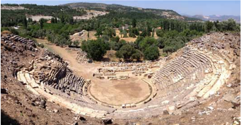
Res. 4: Tiyatro ve arkada aşağı kent kalıntıları

Kent merkezinde, Hellenistik yapıların dışında, Roma İmparatorluk Dönemi'nde hamamlar, agoralar ve latrina ile caddeler ve sokaklardan kalıntılar bilinmektedir. Yapılar ve tespit edilen cadde ve sokak sistemine göre bunların tamamı ızgara plana uygun ola-