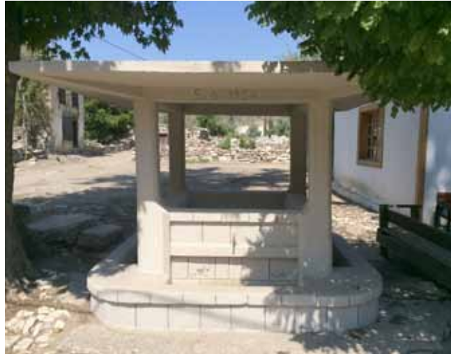
Res. 17: Adnan Menderes Dönemi, 15.04.1954 tarihli köy meydanı çeşmesi.