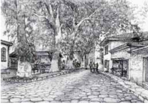
Res. 15: Merkezî Köy Meydanından çizim (Çizim A. Erkuş).