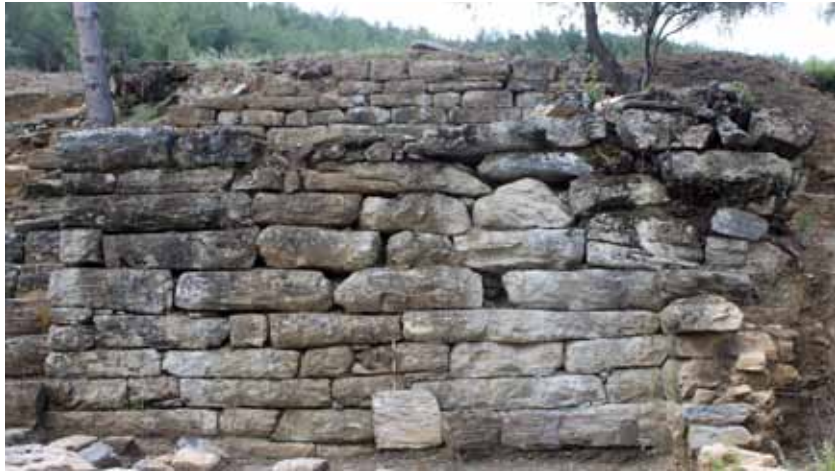
Res. 2: Tiyatro üzerinde bulunan kutsal alan terasının güney duvarı.