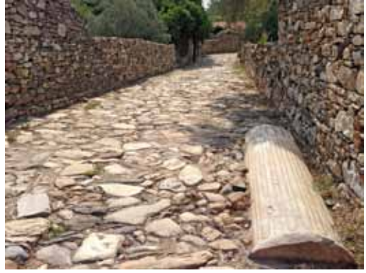
Res. 13: Osmanlı Dönemi yol ve antik dönem sütunu.

Bunun için hepsinin genel anlamda amacı aynı olmakla birlikte, iyi bilinen meydanların hiç birisi diğerine benzememektedir.