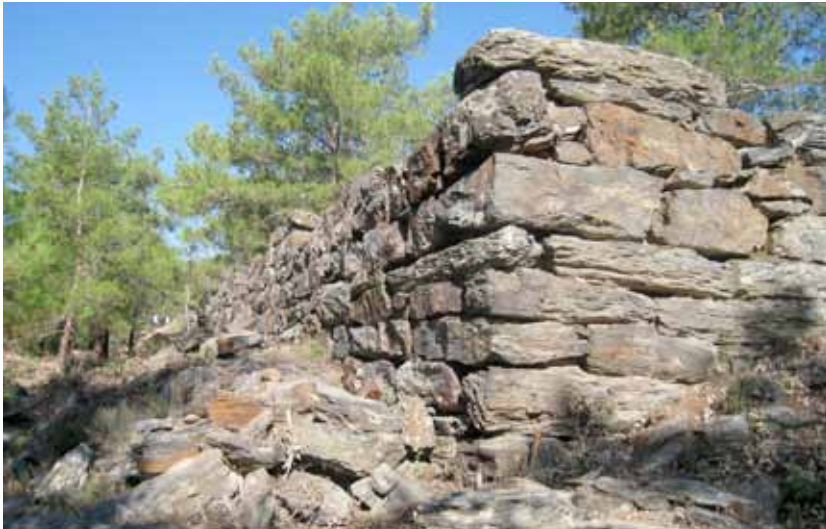
Res. 1: Kadikulesi Tepesi'ndeki erken sur duvarı köşe kısmı

Stratonikeia'da yapılan çalışmalarda ele geçen en erken buluntulardan birisi kentin batısında tespit edilen MÖ 3. bine tarihlenen Kyklad tipi mezardır 5 . Y. Boysal bir antikacının elin-