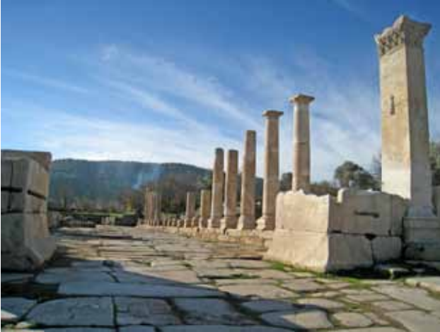
Res. 6: Kuzey Sütunlu Cadde batı portik paye ve sütunları ile Doğu Roma Dönemi kemer ayakları.

rak düzenlenmiştir. Kalıntıların haricinde, kent içinde bulunan mimari elemanlara göre, bilinen yapıların büyük bir çoğunluğu Roma İmparatorluk Dönemi'ne tarihlenmektedir. Genel hatlarıyla Augustus ve MS 2. yy imarı dışında, yoğun imar faaliyetlerinin yaşandığı dönem olarak, depremlerin sonrasındaki yapılaşmanın etkili olduğu görülmektedir. Özellikle bir yazıtta göre MS 139 tarihli deprem sonrasında, Roma İmparatoru Antoninus Pius'un kente yaptığı 25.000 drakhme destek yazıtlardan bilinmektedir 17 . Bu dönemde ayağa kaldırılan yapılar arasında iki giriş arasında çeşme anıtının olduğu kuzey şehir kapısı ve devamındaki sütunlu cadde bulunmaktadır (Res. 5). Benzer tamirat ve yeniden düzenleme, Batı Cadde, Latrina, Roma Hamamı-1 ve tiyatro gibi yapılarda da olmuştur. Kazılmadığı için bilinmemekle birlikte, mutlaka aynı dönemdeki depremden zarar gören başka yapılarda da benzer çalışmalar yürütülmüş olmalıdır. Bunlar bize gerekli olan zamanlarda kentin kendi imkanları ve imparatorluk desteği ile hızlı bir şekilde yapıların yeniden ayağa kaldırdığını göstermektedir. Yeni eklenen ve yeniden düzenlenen yapılar haricinde, Geç Antik Dönemde aynı alanlar kullanılmaya devam etmiştir (Res. 6).