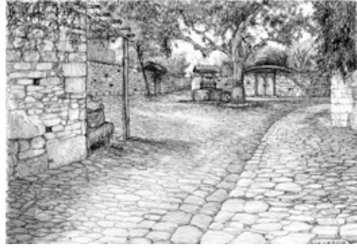
Res. 16: Ortasında bir sarnıç bulunan 2. Köy Meydanı ve çevresinde evler (Çizim A. Erkuş).

1957 yılında yaşanan deprem sonrasında köyün hemen kuzeyine yeni 2. Bir yerleşim alanı oluşturularak insanların buraya taşınması sağlanmıştır 32 . Daha sonra köylüler bu yeni olan 2. Yerleşim alanındaki kömür kazıları nedeniyle, Stratonikeia antik kentinin yaklaşık 1 km batısındaki 3. Yerleşim alanına taşınmışlardır 33 . 2. ve 3. Yerleşim tamamen modern bir düzenleme olup, antik yerleşimden ayrı alanlarda yapılmıştır. Bu yeni yerleşimler sayesinde, antik kent üzerindeki köy içine yeni yeni yapılar ve ilave düzenlemeler fazla yapılmadığından, eski yerleşim dokusu bozulmadan korunmuştur. Bugün Stratonikeia antik kenti içindeki Eskihsar halkının büyük bir çoğunluğu yeni yerleşim alanına taşınmış olmasına rağmen, halen daha antik kent içinde tarihi köy evlerinde oturan 4 aile bulunmaktadır.