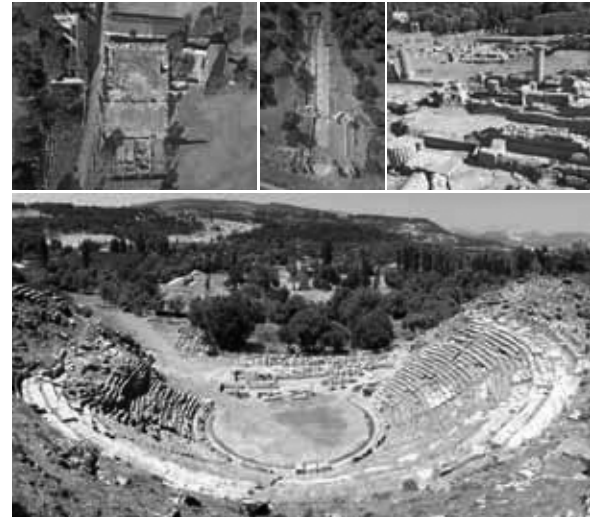
Kapak resmi: Stratonikeia 2015 Yılı Çalışmaları