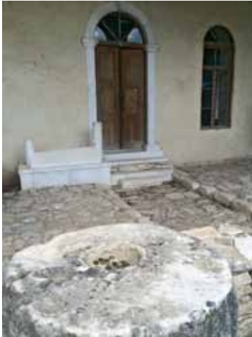
Res. 17: Şaban Ağa Camii önündeki sadaka taşı ve arkada Şaban Ağa sardukası ile cami girişi.

Sonuç olarak önceki yılların bir devamı olarak bu yıl yapılan çalışmaların değerlendirmeleri sonrasında; Stratonikeia antik kenti ve devamında Eskihsar Köyü'ne ait yerleşim süreci hakkında önemli tespitler yapılmıştır. Yerleşim ile ilgili bulgular genellikle MÖ 1. bin sonrasına aittir. MÖ 1. bin ilk yarısında Kadıkulesi Tepesi'nin kuzey yamaçlarında görülen yerleşim Geç Klasik Dönem'den sonra genişlemiş ve Kadıkulesi Tepesi ile birlikte kuzeyindeki düzlük alana yayılmıştır. Yaklaşık 3600 m uzunluğunda bir surun sınırladığı bu yerleşimin, kentin en geniş halini oluşturmaktadır. Erken Doğu Roma Dönemi'nde yerleşim olarak aşağı kent kullanılmıştır. MS 7. Yüzyıl ortalarından itibaren aşağı kentteki yerleşim küçülmüş ve daha çok kentin kuzeydoğu bölümüne toplanmıştır. Buradaki yerleşimin MS 13. Yüzyıla kadar devam ettiği düşünülmektedir. Beylikler Dönemi ile birlikte yerleşim merkezi kentin doğusunda, şimdiki Merkezî Köy Meydanı'nın bulunduğu alan ve çevresinde olmuştur. Osmanlı ve Cumhuriyet Dönemi'nde aynı merkez esas olmak üzere yerleşim çevresinde yayılmıştır. Kadıkulesi Tepesi kuzey yamaçları sınırlı olmak kaydıyla, düzlük alandaki yerleşimin bulunduğu kısım ve bunun kuzey dış kısmına yerleşim genişlemiştir. Bu günün,