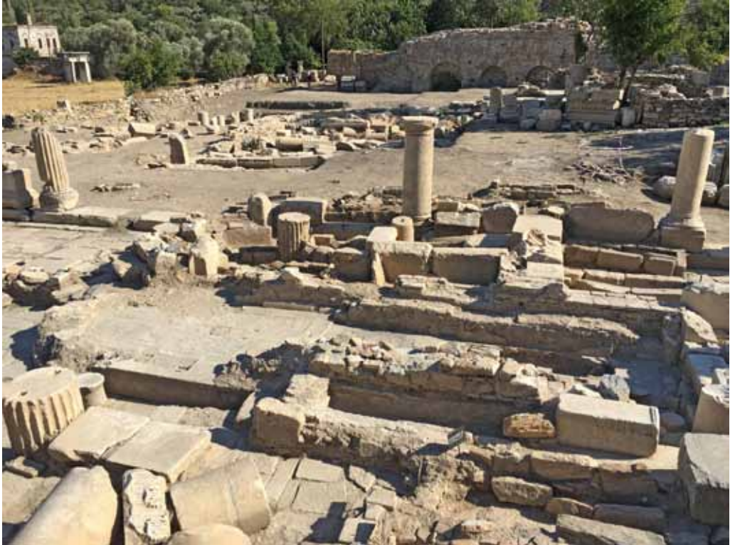
Res. 10: Batı Cadde başlangıcında bulunan Kilise kalıntısı ve üzerindeki ve mezarlar ile Latrina ve Roma Hamamı-1 kalıntıları.

Stratonikeia sur duvarı içinde en az nüfus bu dönemde yaşamıştır. Son zamanlara kadar kentin kuzeybatı bölümünün kullanılmış olmasının en önemli etkenlerinden birisinin burada var olan su ve iyi tahkim edilmiş savunma sistemi olmalıdır.