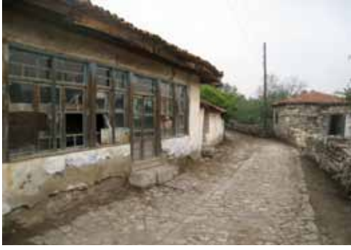
Res. 12: Osmanlı Dönemi taş döşeli yol, kahvehane ve evler.