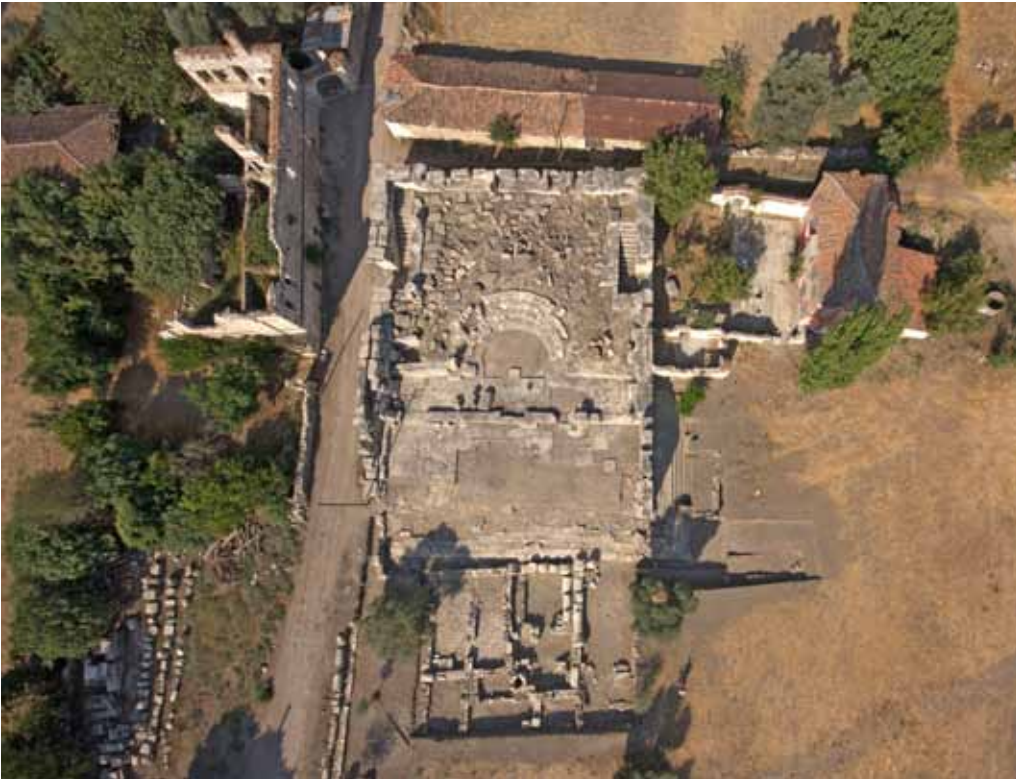
Res. 8: Bouleuterion ve çevresindeki kalıntılar.