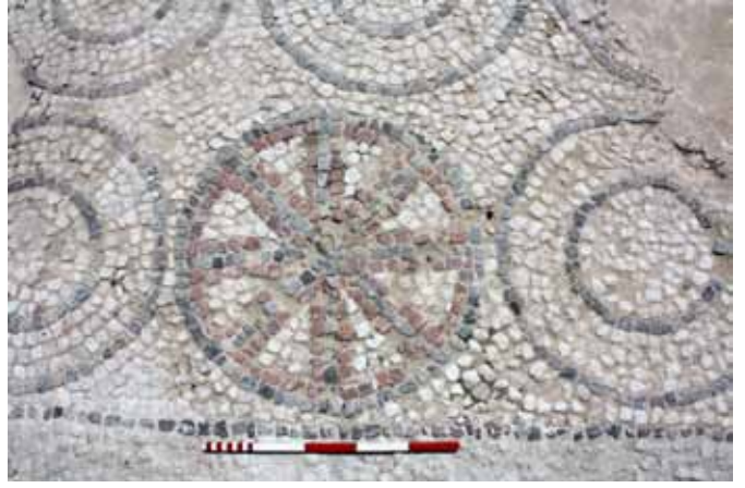
Res. 7: Kuzey Cadde doğu portiğindeki mozaik ve Christogram detayı.

MS 4. yy'ın ikinci çeyreğinden sonra yaşanan serbestlik nedeniyle, inanç değişikliğine bağlı olarak bir takım yeni yapılar inşa edilmiş ve bazı yapılar yeniden düzenlenmiştir. Bu tarihlerden itibaren, inşa edilen yapıların yoğunlu-