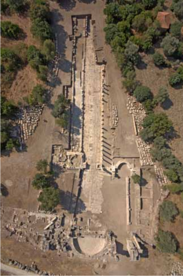
Res. 5: Kuzey Şehir Kapısı ve devamındaki Kuzey Sütunlu Cadde (Hellenistik, Roma ve Bizans Dönemi).