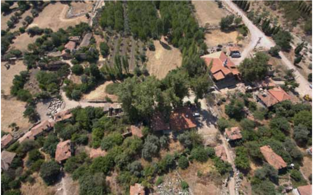
Res. 14: Gymnasionun üzerinde Osmanlı ve Cumhuriyet Dönemi Merkezi Köy Meydanı.

Adnan Menderes Dönemi'nde 1954 yılında burada pek çok çeşme inşa edilmiştir. Bunun en anıtsal olanı Köy Meydanı'ndaki 15.04.1954 tarihli yapıdır (Res. 18). Aynı çeşmelerin daha basit örnekleri diğer küçük köy meydanları ve yol kenarlarına da yapılmıştır. Yapılan çeşmeler de bu yolların ve meydanların bu dönemde aktif olduğunu doğrulamaktadır.