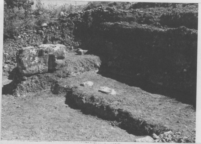
Resim 6: Zeytinyağı işliği kazıda bulunan kalıntılar ve restitüsyonu

Mezarlar ile ilgili iki ayrı çalışma yapıldı. Bunlardan birisi, 2002 yılı içerisinde Muğla Müzesi ile birlikte açılan 7 mezarın temizliklerinin yapılması ve çevrelerinin tamamen kazılarak yakınlarında herhangi bir mezar veya kalıntılar olup olmadığının belirlenmesiydi (Res.11). Bu aşamada öncelikle 1