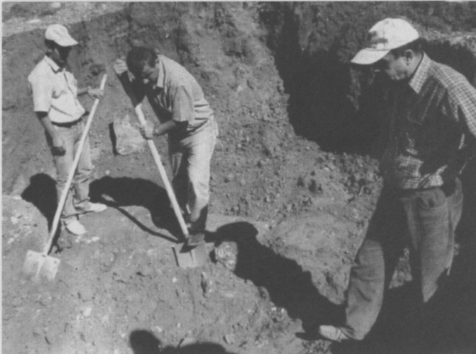
Resim 3: 02BM01 Numaralı ilk mezarın bulunuşu.