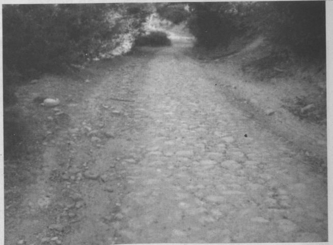
Resim 1: Lagina ile Stratonikeia arasındaki kutsal yol

2002 yılında, yakınında bir su kaynağı ve yakın çevresinde kuyuların bulunduğu Börükçü Mevki'ine (Res.2) gelindiğinde her şey değişti. GELİ yetkililerinin normal bir dinamit atımı esnasında, daha önceden tecrübeli olan uzman ve işçiler toprak içinden