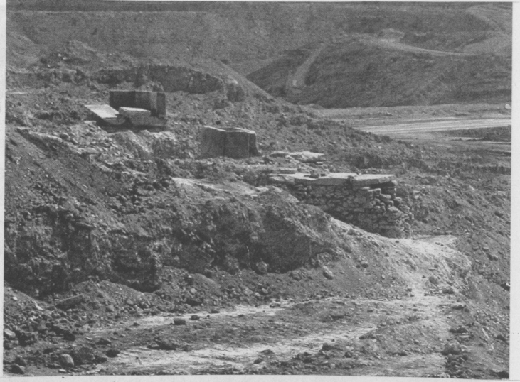
Resim 16: Önde M.Ö. 7. yüzyıl sonu-M.Ö. 6. yüzyıl başlarına ait, arkada M.Ö. 2. yüzyılın 2. yarısına ait mezarların Eylül 2003'deki durumu