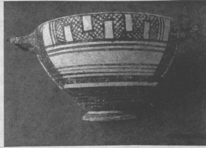
Resim 14: 03BM09 Numaralı mezarında bulunan Skyphos

olma tehlikesiyle karşı karşıyadır (Res.16). Çünkü çalıştığımız dönemlerde biz açık bir şekilde gördük ki; komple tepe yamaçları bile kaymaktadır. Mezarların taşınması konusunda hem kazı ekibi olarak bizler, hem de GELİ yetkilileri hemfikiriz ve gerekli fedakarlığı yapmaya hazırız. Bu konuda gerekli giri-