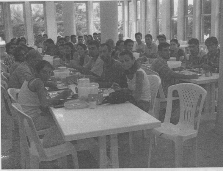
Resim 4: GELİ Yemekhanesi'nde kazı ekibi

yol, 5 su kuyusu, 5 zeytinyağı işliği kalıntısı, 1 Korinth başlığı incelendi, 4 kesit, 9 sondaj ve 21 mezarda kazılar yapıldı. Yapılan çalışmalar sonucundaki tespitler oldukça fazlaydı. Burada kazının tamamını anlatma imkanı olmadığı için; su kuyuları, zeytinyağı işlikleri, dokuma atölyeleri ve mezarlar hakkında genel birkaç tespitten bahsetmek istiyorum.