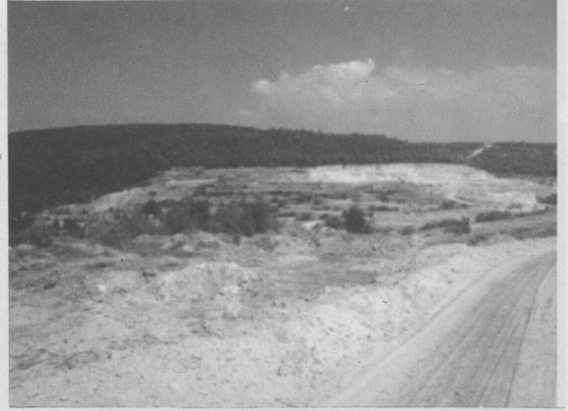
Resim 2: Börükçü Mevkisi ve dekupaj alanı