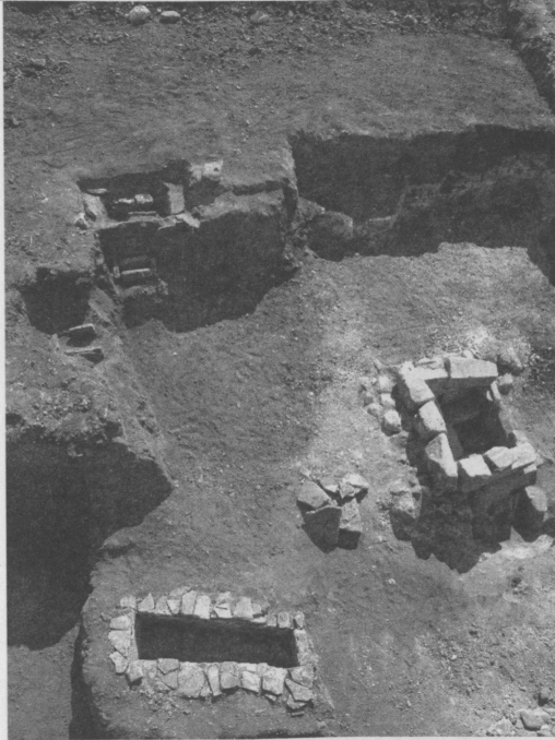
Resim 15: M.Ö. 5. yüzyıla ait yetişkin ve çocuk mezarları ile M.Ö. 3. yüzyıl ortalarına ait aile mezarı.

şimler Ağustos 2003 ayında yapıldı. Dilerim ki, gerekli izin verilir ve mezarlar tamamen tahrip olmadan en azından farklı birer örneği taşıyarak gelecek nesillere "Bunlar Börükçü Mezarlarından örneklerdir" diye gösterme şansımız olur.