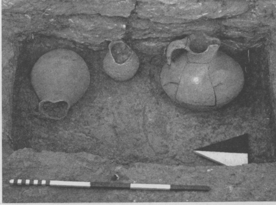
Resim 13: 03BM09 Numaralı, M.Ö. 6. yüzyıl başlarına ait mezarın buluntuları

olma tehlikesiyle karşı karşıyadır (Res.16). Çünkü çalıştığımız dönemlerde biz açık bir şekilde gördük ki; komple tepe yamaçları bile kaymaktadır. Mezarların taşınması konusunda hem kazı ekibi olarak bizler, hem de GELİ yetkilileri hemfikiriz ve gerekli fedakarlığı yapmaya hazırız. Bu konuda gerekli giri-