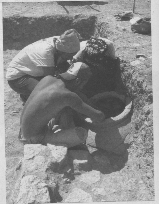
Resim 9: 03BS05 Numaralı sondajdaki ağırlık ve ağırşak dolu pitos.

Çalışmalarda, 9.5 m uzunluğunda ve 0,90-1,50 m genişliğinde bir teras duvarı bulundu. Teras oluşturulan bölüm M.Ö. 7. yüzyıl sonu ve M.Ö. 6. yüzyıl başlarına ait olan 02BM03 ve 02BM04 numaralı mezarların üst bölümüne gelmekteydi. Duvarın yakın çevresinde yapılan kazılarda M.Ö. 5. yüzyıla ait seramik parçaları ve M.Ö. 4. yüzyıla ait Milas sikkesi ele geçti. Teras duvarının bulunduğu alan ve gerisindeki düzlük, burasının mezarların yakınındaki ölü kültürü ile ilgili seramonilerin yapıldığı yer olabileceğini gösterdi. Buluntulardan bu alanın en azından M.Ö. 7. yüzyıl