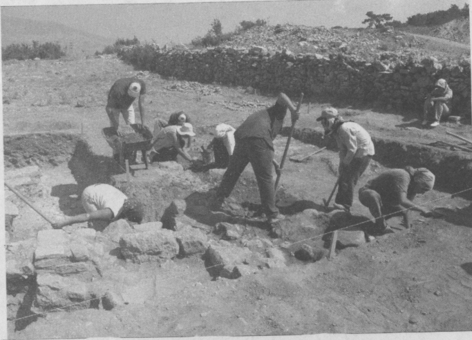
Resim 7: 03BS04 Numaralı sondajdaki kazılar

lenmektedir (Res.13-14). İkinci gruba ait mezarların bazıları tek gömülü, bazılarının ise; uzun süreli tekrar tekrar kullanıldığı görülmüştür. Urne mezarların sadece birinde buluntuya rastlanmıştır. 03BM12 numaralı mezarda, M.Ö. 5. yüzyıl 2. yarısından, siyah figür tekniğinde sarmaşık dalından karın süslerine sahip Attika atölyelerinin üretimi olduğu anlaşılan iki lekythos ve bir askos'un da yer aldığı urne gömüye rastlanmıştır 8 . Urne kabı daha önceden kırılmış olmakla birlikte, 03BM12 numaralı mezar bu tipteki gömüler arasında en zengin grubu oluşturmaktadır. Böylece M.Ö. 5. yüzyılda örgü tekne mezarların yanı sıra, Attika atölyelerinde