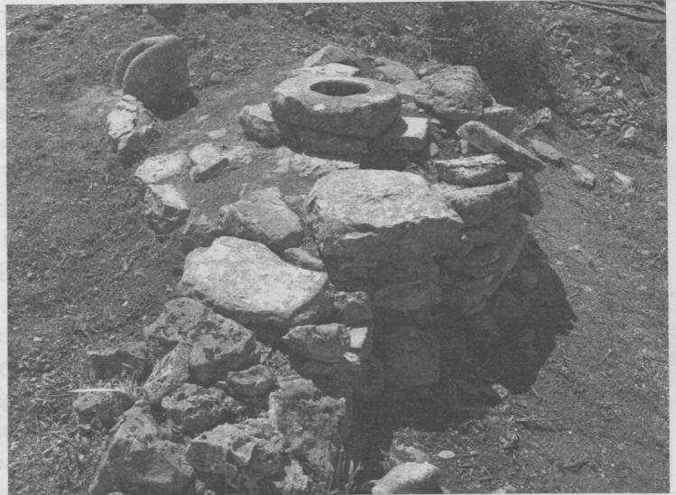
Resim 5: Börükçü, Yol Kenarı Kuyusu

İki ayrı sondajda (03BS04 ve 03BS05) yapılan çalışmalarda şimdilik iki dokuma atöl-