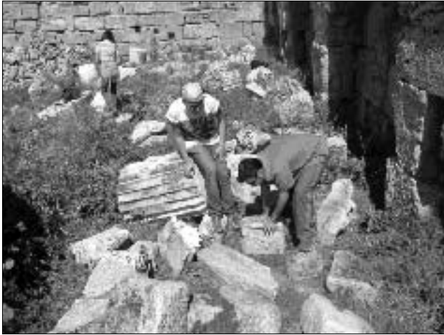
Resim 3: Kazıda bulunan İon başlığı parçaları