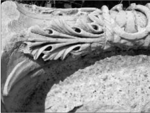
Resim 8: Hamam kazısında bulunan İon başlık parçasının detayı