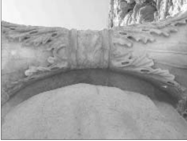
Resim 6: D5 üzerindeki İon başlığı yastık ve baltheus kısmı