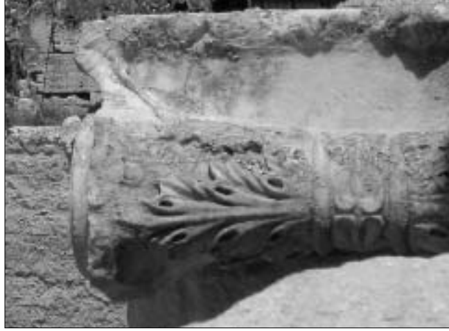
Resim 7: D5 üzerindeki İon başlık detayı