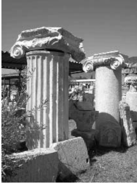
Resim 5: Müze bahçesindeki İon başlıkları ve sütun üst tamburu