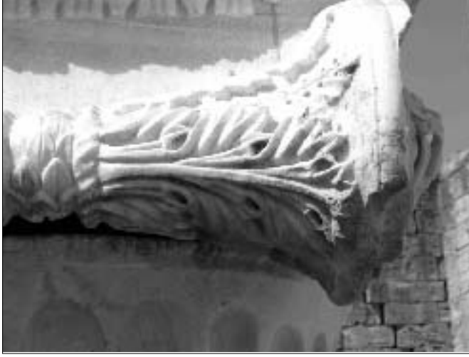
Resim 9: Müze bahçesindeki lon başlığın detayı