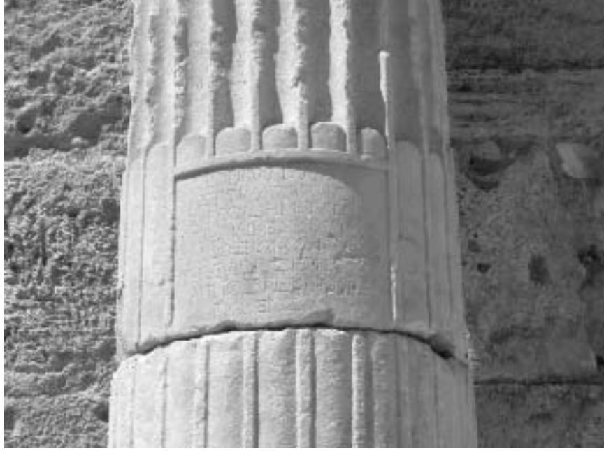
Resim 4: Tiberius Dönemine ait kitabe