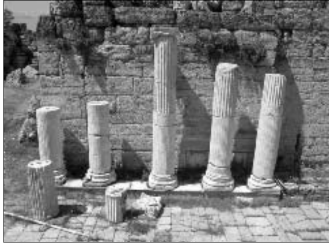
Resim 2: Doğu yönde bulunan kaide, sütun ve başlıklar