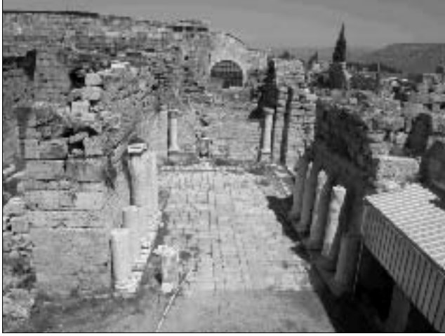
Resim 1: Güney Roma Hamamı'nın apodyterium bölümü