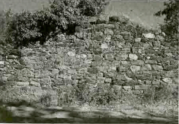
Resim 6: Hisar'daki duvar kalıntısı