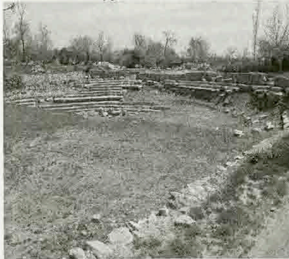
Resim 14: Herakleia Salbake stadyumu kazı sonrası durumu