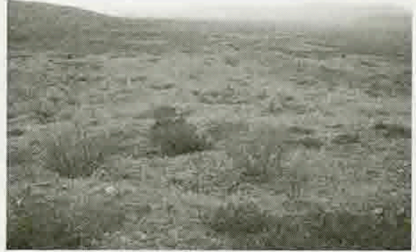
Resim 3: Menderes Antiokheiası'ndaki Orta Çağ kale kalıntısı