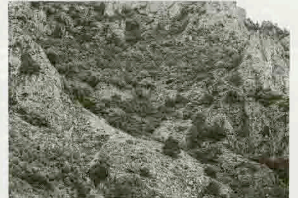
Resim 7: Kilise Mevkiindeki yamaç yerleşimi