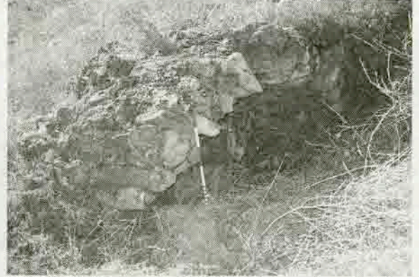
Resim 5: Başkarcı Ormaz Vadisi'nde bulunan tonoz kalıntısı