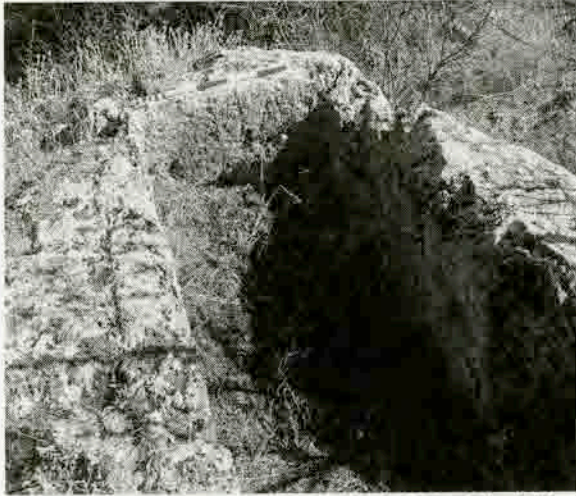
Resim 12: Tekke Köyü, Gavurbeşiği Mevkiindeki oyu tekne mezar