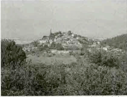
Resim 10: Attuda (Hisarköy)'nin batıdan Lykos Vadisi'ne doğru görünümü