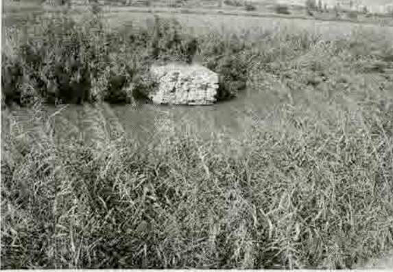
Resim 2: Menderes Irmağı üzerindeki taş köprü kalıntısı