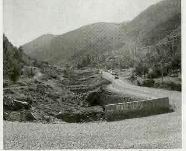
Resim 13: Başkarcı, Ornaz Vadisi