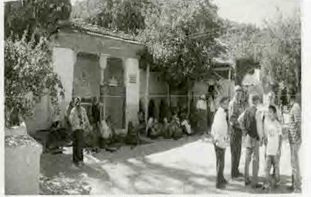
Resim 11: Tekke Köyü Camisi avlusundaki ek binalar ve hayır yemeği