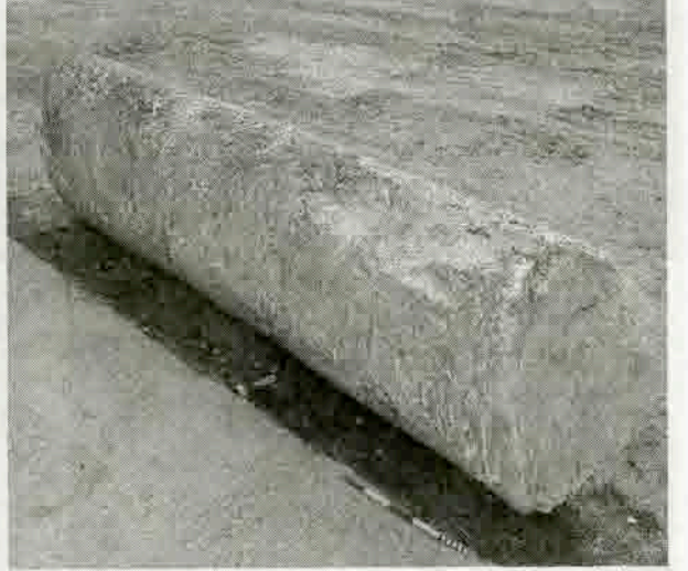
Resim 15: Salbakos Dağının doğu yamacındaki vadiden kesilmiş, yarım kalmış sütun gövdesi