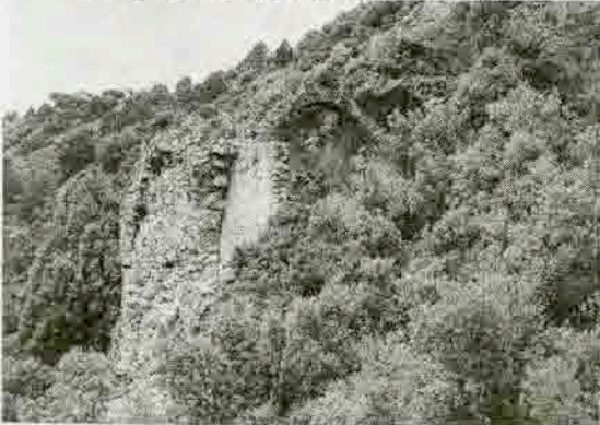
Resim 8: Kilise Mevkiinden yapı kalıntısı.