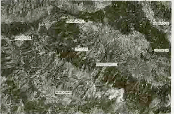
Resim 9: Akdağ'ın yüzey bölümündeki yerleşimler ve vadiler (Google Earth'den alınıp ilaveler yapılmıştır)