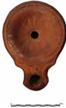
Fig. 8. Kandil