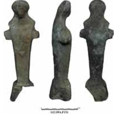
Fig. 9. Herrmes Hermesi