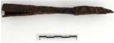
Fig. 7. Demir Mızrak Uçları

Mezarın içinde bir adet kandil 39 bulunmuştur (Fig. 8). Üstündeki is izinden yakılarak bırakıldığı