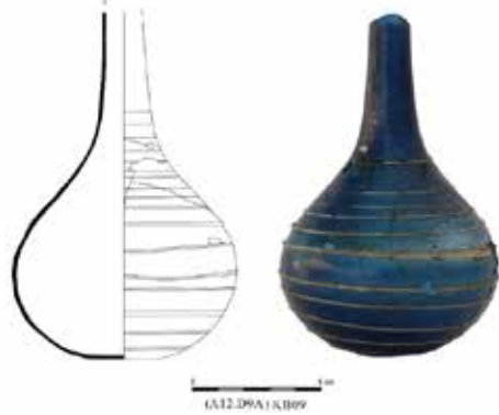
Fig. 5. Mavi Cam Unguentarium, Aizanoi Kazı Arşivi