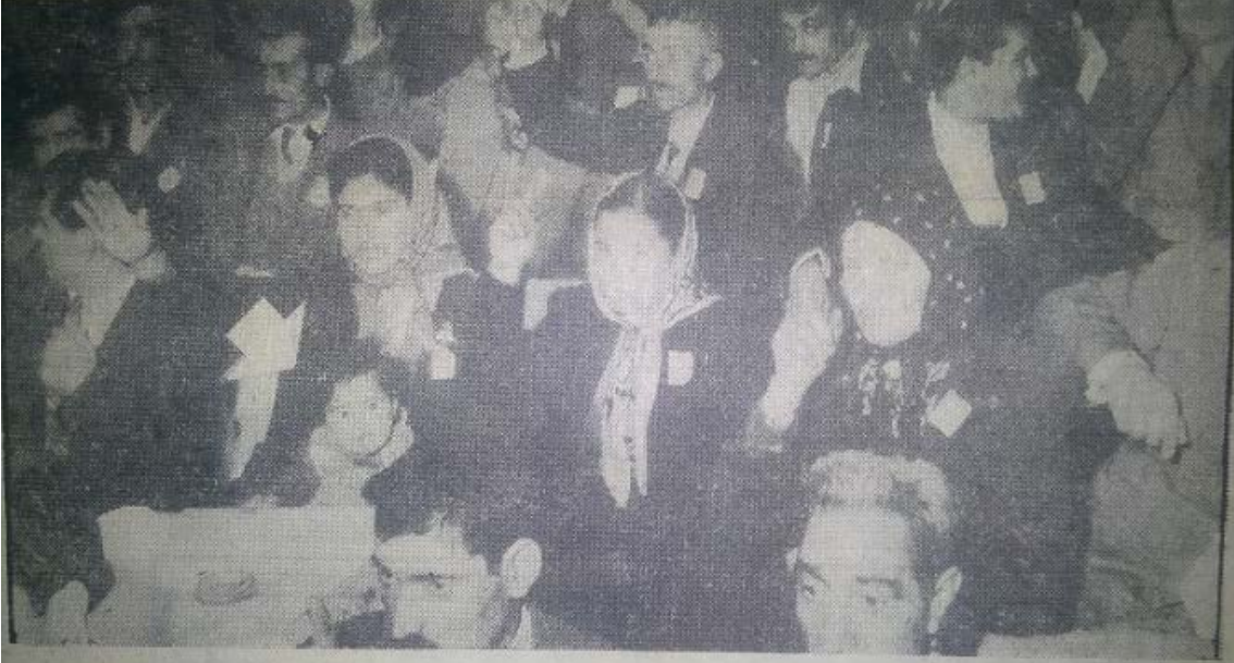
[MİLLİYET] Köylü Partisi Kongresini tákíp eden delegeler arasında, (okla gösterildiđi gibi) çocuklu kadınlar da bulunmuştur.