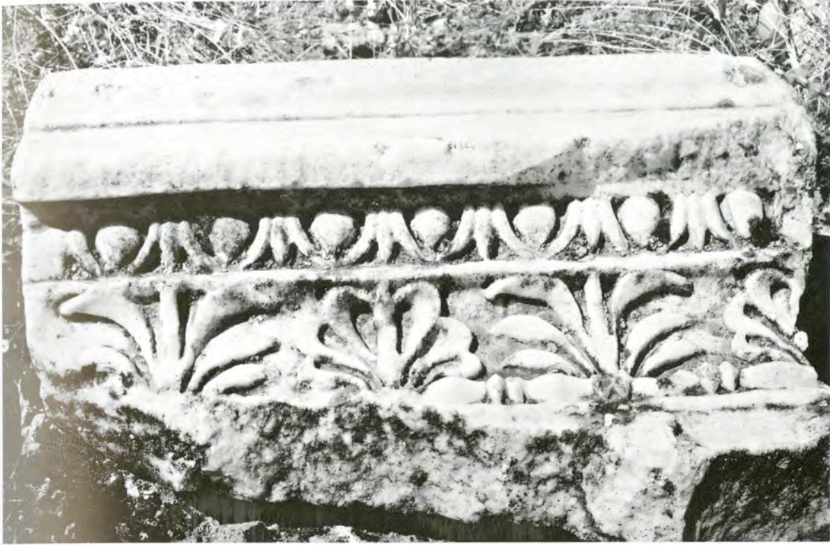
Res. 22 KN15 (T3) numaralı taç bloğu