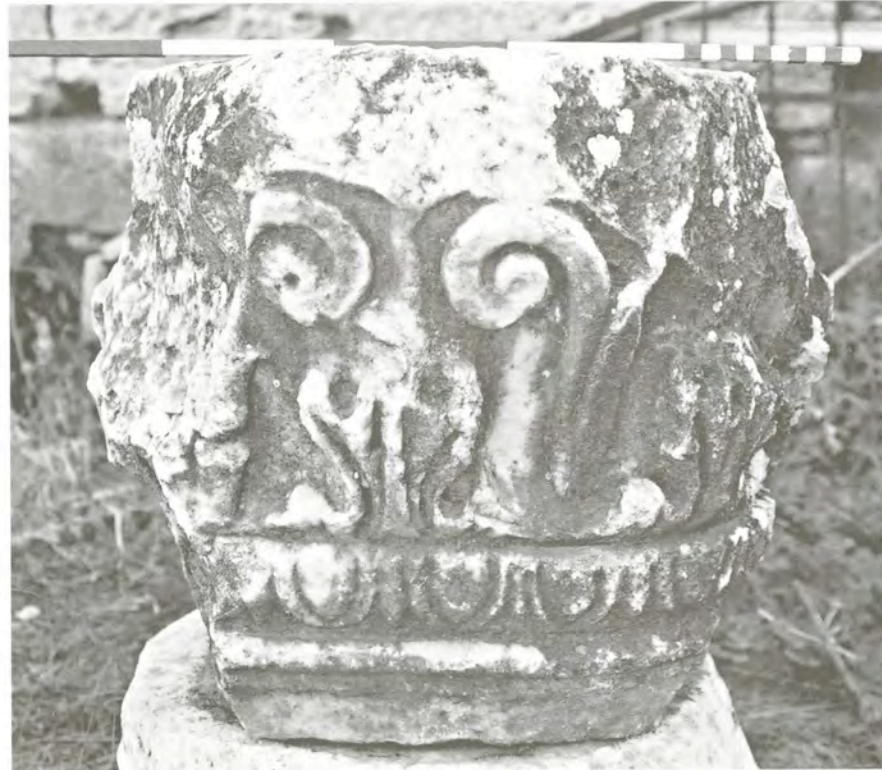
Res. 2 KN2 (Kb2) numaralı başlık