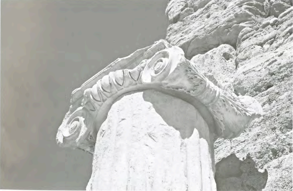
Res. 13 Ib3 numaralı başlık