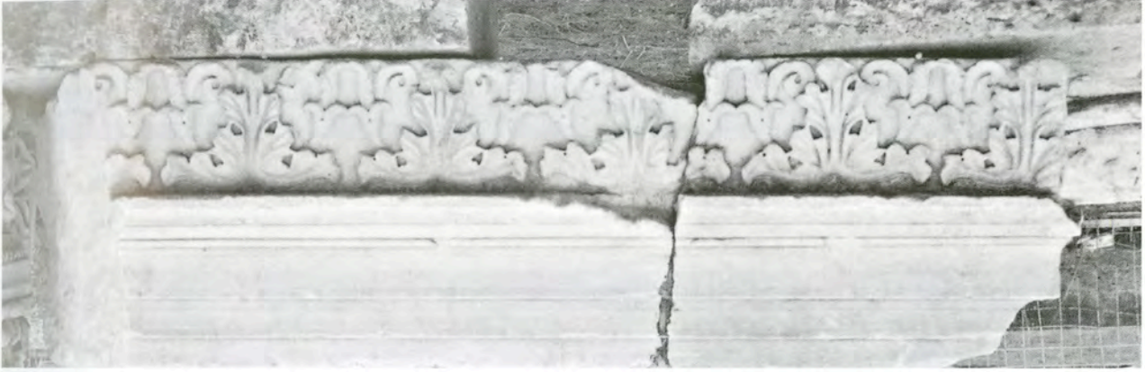
Res. 18 KN12 (AF3) numaralı arşitrav-friz bloğu