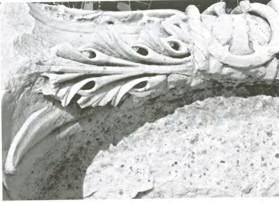
Res. 14 Güney Roma Hamamı'na ait başlık parçalarından detay