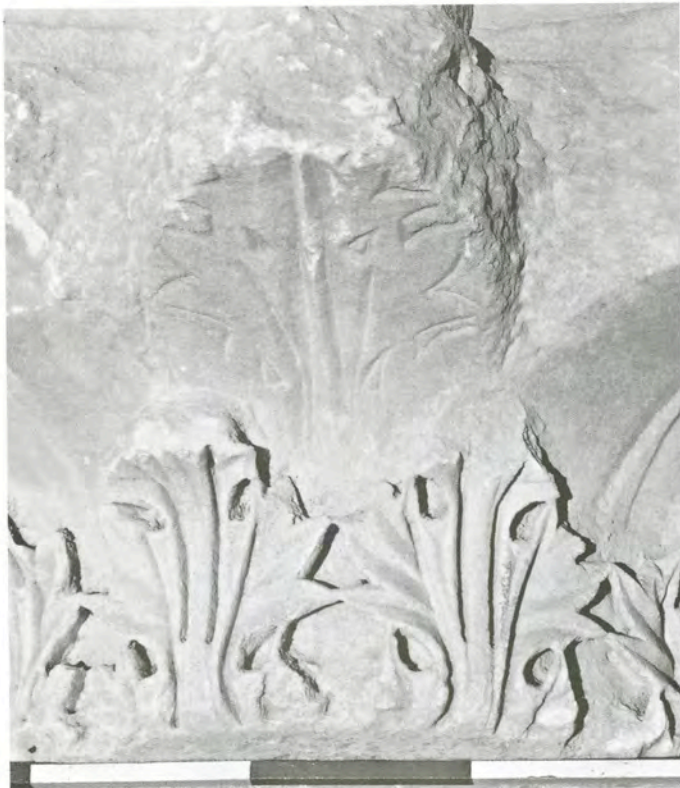
Res. 6 KN5(KÇb1) numaralı başlık detayı