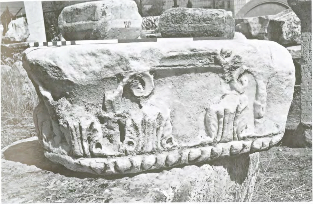
Res. 3 KN3 (Kb3) numaralı başlık