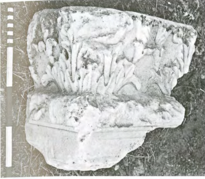
Res. 17 KN11 (AF2) numaralı arşitrav-friz köşe parçası