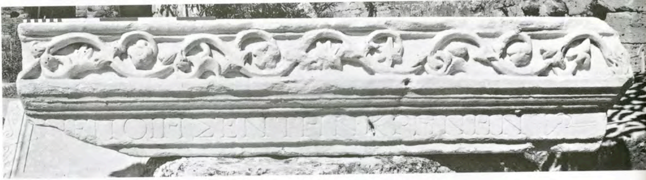
Res. 15 KN10 (AF1) numaralı arşitrav-friz bloğu