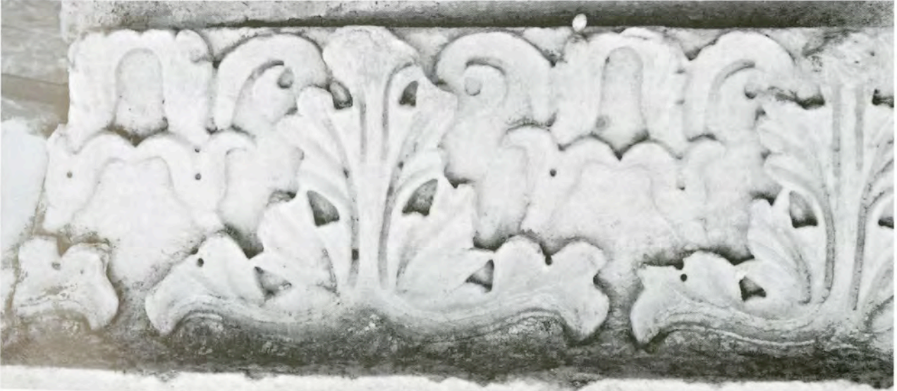
Res. 19 KN12 (AF3) numaralı arşitrav-frizin detayı