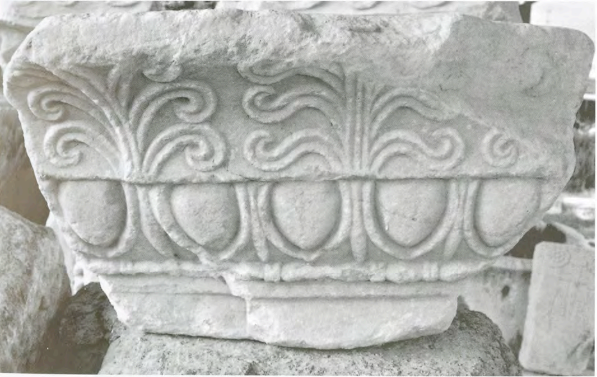
Res. 8 KN7 (KPb1) numaralı başlık