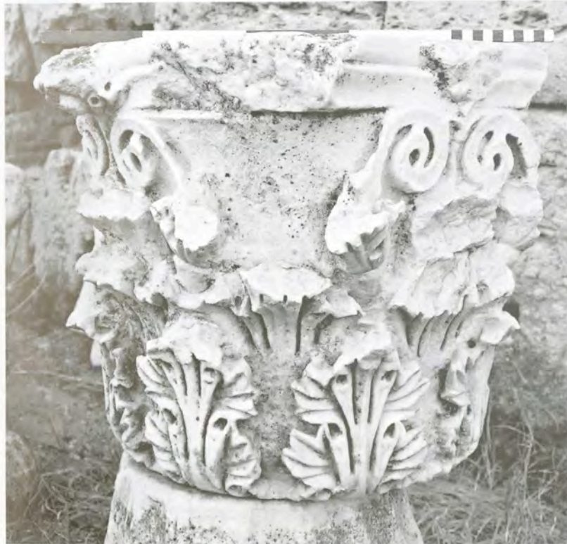
Res. 4 KN4 (Kb4) numaralı başlık