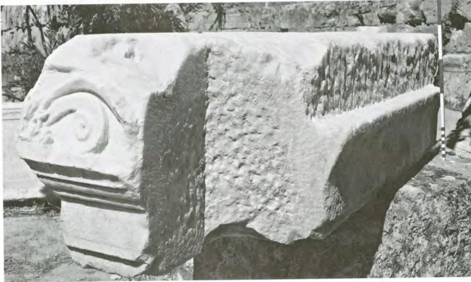
Res. 16 KN10(AF1) numaralı arşitravın dar kenarı ve arka bölümü