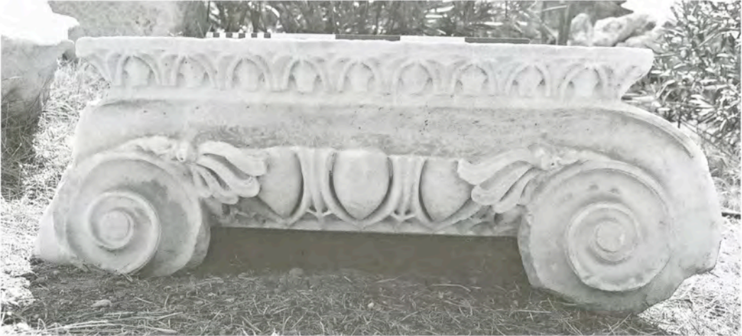
Res. 10 KN8 (Ib1) numaralı başlık