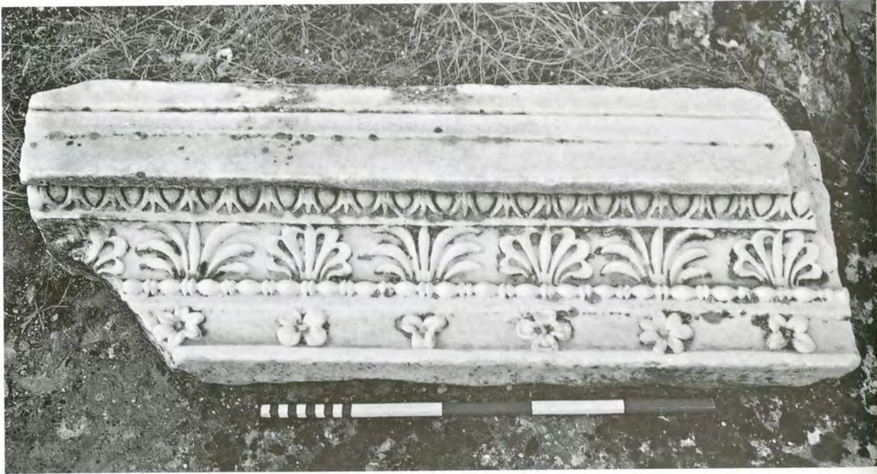
Res. 21 KN14 (T2) numaralı taç bloğu