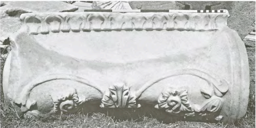
Res. 11 KN9 (Ib2) numaralı başlık