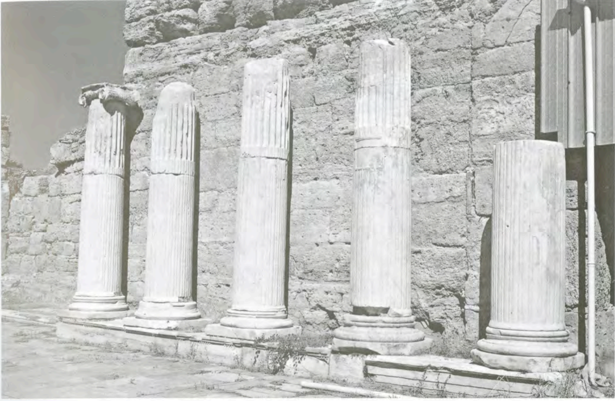
Res. 12 Güney Roma Hamamı'nda doğu yönde bulunan sütunlar ve başlık