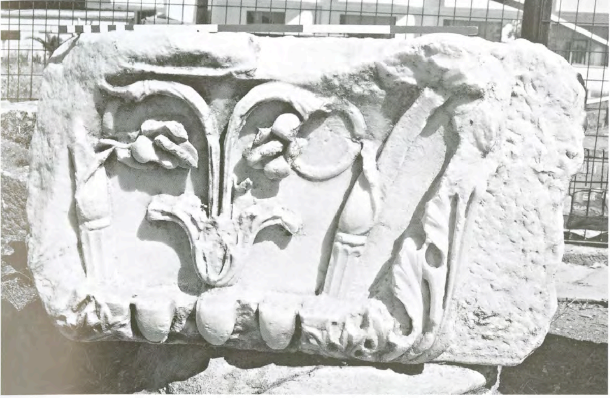
Res. 7 KN6 (KKPb1) numaralı başlık