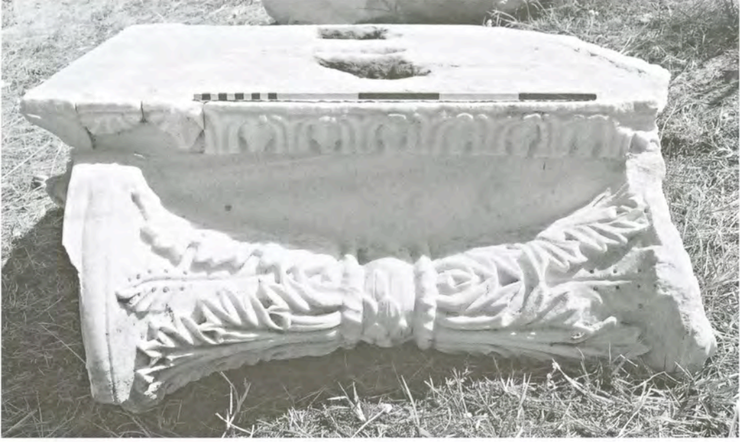
Res. 9 KN8 (Ib1) numaralı başlık