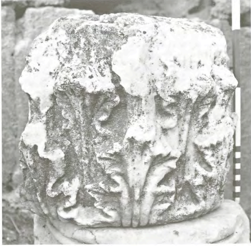
Res. 1 KN1 (Kb1) numaralı başlık