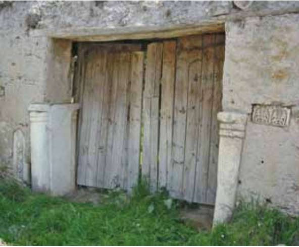
Res. 5 Aşağı Mahalle, Kale Sokak No 8, Bekir Uygur Evinin Bahçe Kapısı