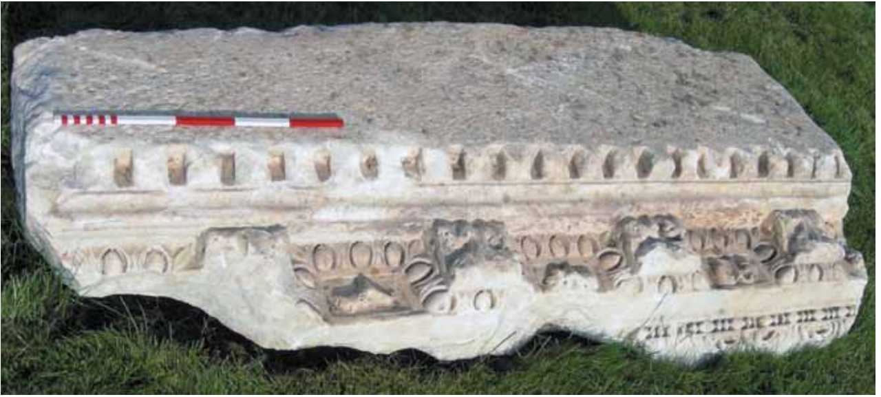
Res. 21 Korniő Bloęu

sonrasında farklı amaçlar için en rahat kullanılabilen malzemelerden birisini bunlar oluőturmaktadır. Buna baęlı olarak da daha çok tahribata uęramıőtır. İkinci kullanım için dűőünűldűęünde bunlar yatay ve dikey bölűnerek farklı amaçlar için kullanıma hazır mermer malzemedir. Özellikle mezarlıklarda mezar taőlı olarak daha çok tercih edilmektedir. Arőitrav ve frizlerin sayılarının oldukça sınırlı olmasının sebebi, tarihi sűreç boyunca bu yoęun talebe maruz kalması olmalıdır.