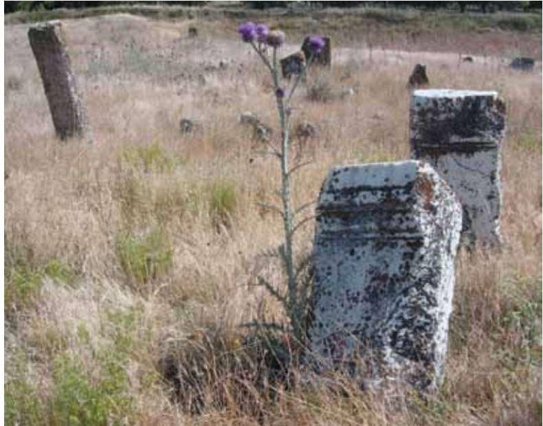
Res. 35 Roma Dönemi'ne Ait Girlandlı Bir Mezar Taşının Müslüman Mezarlığında Tekrar Kullanılması