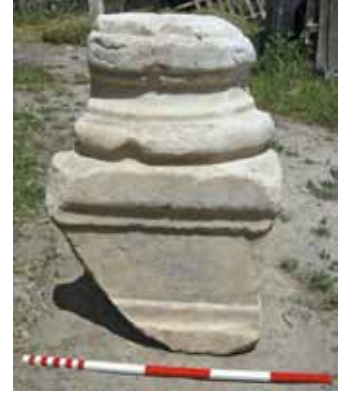
Res. 9 Postamentli Attik Kaide

Bu tür yerleşim yerlerinde bulunan ve yapıda kullanıldıkları yerler kolayca belirlenebilen toikhoblatlar, sütun parçaları ve üst yapı elemanlarıdır. Duvar taşları, her dönem için kolay kullanılacak parçalar olduklarından, orijinal yapısından söküldükten sonra bulunması zordur. Çünkü bunların bazılarının oldukları şekilde, bazılarının da parçalanarak kullanıldıkları bilinmektedir 19 . Özellikle düzgün duvar taşı olanların, yerleşim merkezleri içinde günümüze kadar sağlam kalmış olması oldukça zordur. Hiç tahribata uğramamış olan duvar bloklarından kabarık yüzeyli, çerçevesi ve her iki yüzeyi ince yonu olanların ait oldukları duvarlar konusunda öneri yapılabilmektedir. Bu kriterler bazen çok genel de olsa, tarih önerisi yapabilmek kolaylığı da sağlayabilmektedir.