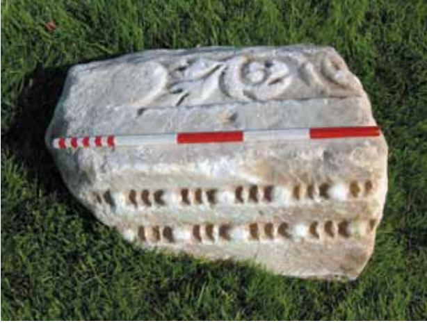
Res. 19 Arşitrav Parçası