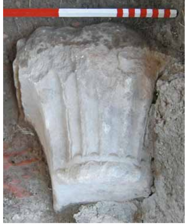
Res. 15 Dil Motifli Paye Başlığı

Başlıklar en çok görülenden en aza doğru dor, korinth (Res. 14), ion ve dil motifli 22 (Res. 15) şeklinde sıralanmaktadır. Bunlar hem normal sütun başlıkları hem de paye ve plaster başlıkları şeklindedir. Örnekler arasında dordan sonra en çok bulunan örnek Korinth sütun başlıklarıdır (Res. 14). Korinth sütun başlıkları, farklı işlemleri nedeniyle görselliği ön planda olan ve buna bağlı olarak dönemler boyunca korunarak tekrar tekrar kullanılan malzemelerden olmuştur. Çoğunlukla bir oturak olarak değerlendirilenlerin yanı sıra, az da olsa dibek taşı yapılanlar da vardır. Yapı taşı olarak kullanılması ise oldukça sınırlı sayıdadır. Dış görünüşündeki görsellik ve insanların bir şekilde günlük hayatlarında kullanmaları nedeniyle, bunlardan günümüze daha çok örnek ulaşmıştır. Paye başlığı olarak tespit edilen tek bezemeli parça Eski Belediye binası önünde durmaktadır. Köşelerde akantus yaprağı, orta bölümlerde dil motifleri ve alt kısmında ion kymationu ile benzer örnekler arasındaki farklı tiplerden birisini oluşturmaktadır 23 .