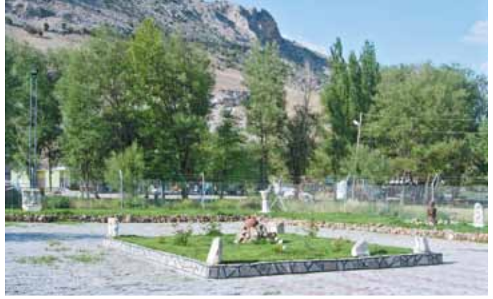
Res. 4 Işıklı Eski Jandarma Karakolu Bahçesi.