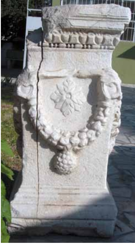
Res. 22 Dörtgen Girlandlı Mezar Taşı