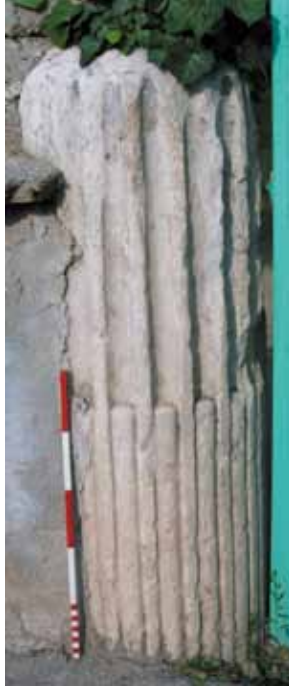
Res. 11 İonik Yivli Mermer Fluthesi Dolu ve Boş Sütun Tamburu