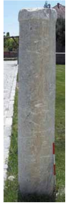
Res. 13 Mermer Yivsiz Sütun Tamburu

Postament kaideler büyük sütunların yanı sıra sütünceler için de tercih edilmiştir. Bunlarda dörtgenlerin yanı sıra çokgen olanlarda vardır. Bunların Erken Bizans Dönemi'nden itibaren daha yaygın kullanılmaya başlandığı anlaşılmaktadır. Bunda Kilise mimarisindeki bazı mimari düzenlemelerin önemli bir etkisinin olduğu açıktır. Aynı dönemde yaygın kullanılan bir diğer taşıyıcı eleman da, çoğunlukla pencerelerin orta kısımlarında üstteki kemerlerin taşıyıcısı olarak kullanılan bodur payelerdir (Res. 5). Bodur payelerden aynı yapıya ait iki örnek Cumhuriyet Dönemi'ne ait bir sivil mimaride devşirme malzeme olarak kullanılmış olarak tespit edilmiştir.