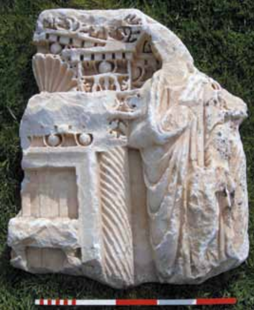
Res. 27 Sütunlu Lahit Teknesi Dar Kenarı, Hades Kapısı Betimli Parça