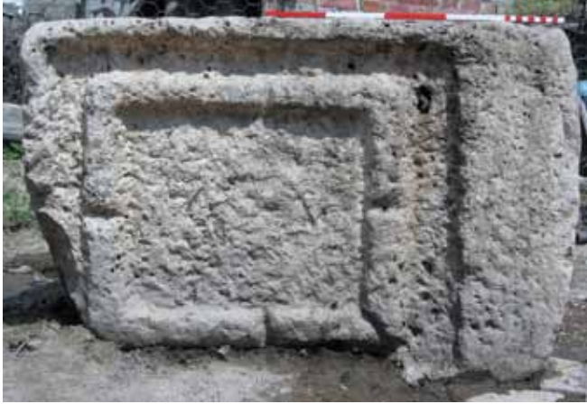
Res. 29 Dikdörtgen Pres Altlığı