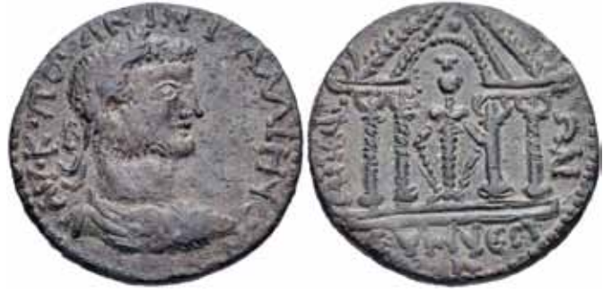
Res. 32 Gallienus (253-268) Dönemi'ne Ait Eumeneia Sikkesi