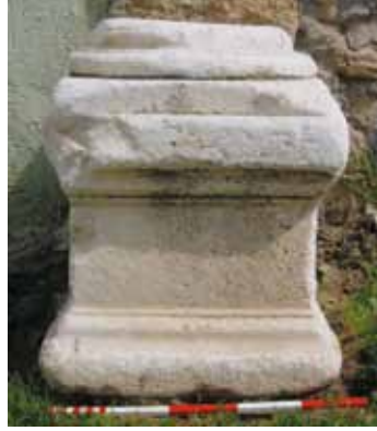
Res. 8 Postamentli Attik-ion Kaide