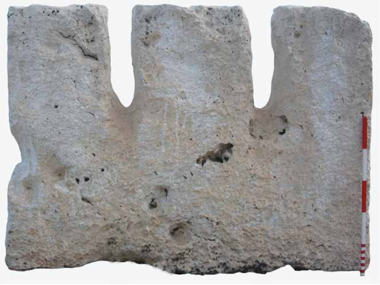
Res. 33 Tuvalet Taşı