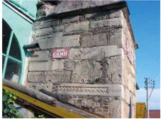
Res. 6 Aşağı Cami Minaresinin Kaidesi

etrafında bulunanlar ile köy meydanında bağımsız duran mimari parçaların büyük bir çoğunluğu Işıklı Eski Jandarma Karakolu Bahçesi'ne toplanmıştı (Res. 4). Yapılan çevre düzenlemesi ve eserlerin güzel bir şekilde yerleştirilmesi sonucunda Karakol bahçesi tam anlamıyla bir Müze Bahçe görünümünü kazanmıştı 11 . Bunların dışında, Işıklı Kasabası içinde farklı yerlerde ve eski binaların duvarlarında, yapı taşı olarak kullanılmış çok sayıda parça bulunmaktadır (Res. 5-6).