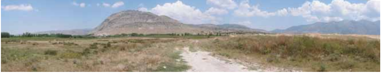
Res. 1 Sarıbaba Tepesi ve Çevresi