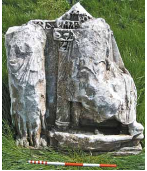
Res. 26 Sütunlu Lahit Tekne Kısım Uzun Kenar Parçası