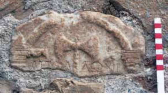
Res. 31 Aşağı Cami Duvarındaki Adak Steli Parçası