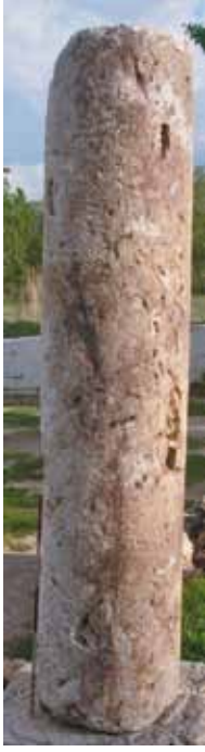
Res. 10 Kireç Taşı Yivsiz Sütun Tamburu