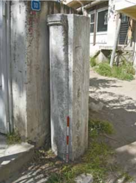
Res. 34 Roma Dönemi'ne Ait Sütunun Bizans Dönemi'nde Tekrar Kullanımı