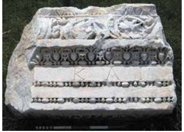
Res. 20 Arşitrav-Friz Parçası