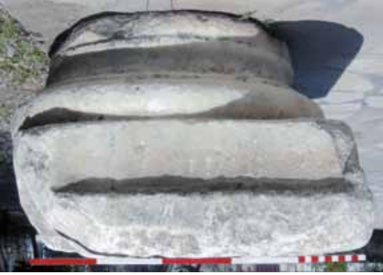
Res. 7 Attik-ion Kaide