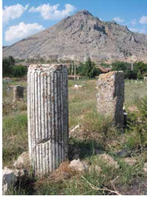
Res. 12 İonik Yivli Mermer Fluthesi Dolu Sütun Tamburu