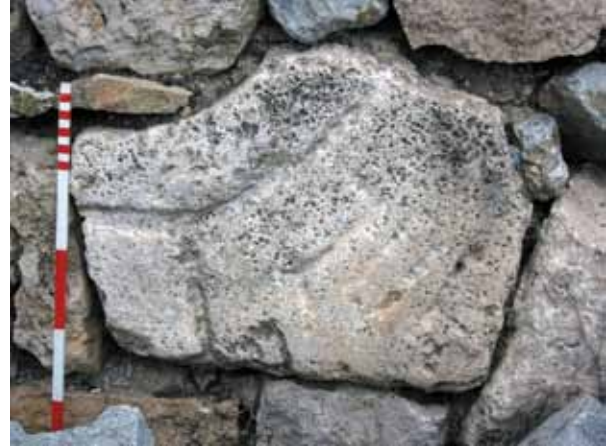
Res. 30 Damla Biçimli Kanallı Pres Altlığı

parçaların bazıları farklı, muhtemelen girlandlı başka bir lahide ait olmalıdır 32 . Alınlık ortasında bir betimlemenin varlığı kesin olmakla birlikte, büyük bir kısmı tahrip olduğundan ne olduğu tam olarak anlaşılamamaktadır.