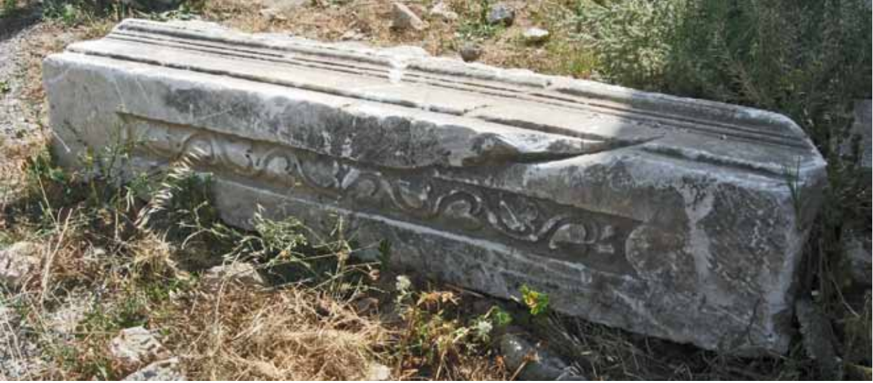
Res. 18 Sağlam ve Bağımsız Duran Arşitrav Bloğu