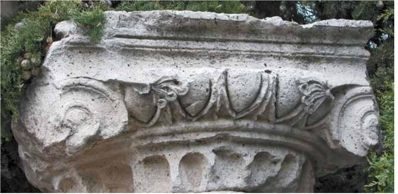
Res. 17 Dinar Parkı GiriŐisindeki İon BaŐlıđı

Hellenistik ve Erken İmparatorluk Dönemi'nde anıtsal yapının inşa edilmiş olması ihtimalinin çok yüksek olmasına rağmen, bu dönemler ile ilgili mimari parça çok sınırlıdır. Kasaba içinde bulunan dil motifli bir başlık haricinde, bu grupta örnek şimdilik bilinmemektedir. Ama gelecekte yapılacak kazılarda bu ve benzeri mimari elemanların bulunacağı kesindir. Bölgede yapılan araŐtırmalarda bulduğumuz yüzey buluntuları, gelecekte burada da ortaya çıkacağını açık şekilde ortaya koymaktadır.