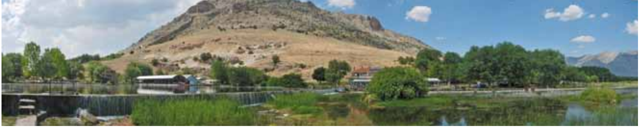
Res. 2 Sarıbaba Tepesi ve Kaynağın Suyu

çalışması ise bizim şimdi yürütmekte olduğumuz projedir. Eumeneia-Şeyhlü-Işıklı Kasabası'nın her dönemini içine alan tek toplu çalışma ise bu kitaptır 8 .