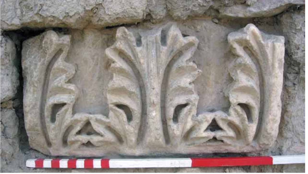
Res. 16 Korinth Plaster BaŐlıđı