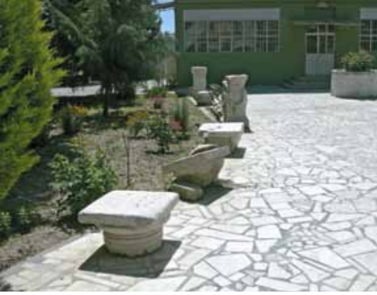
Res. 3 Çarşı Cami Bahçesi