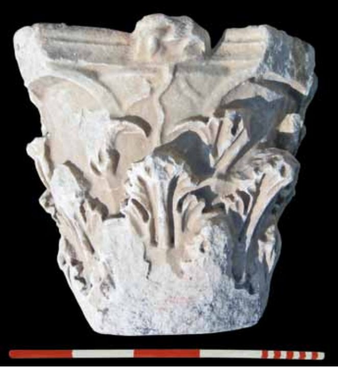
Res. 14 Korinth Sütun Başlığı