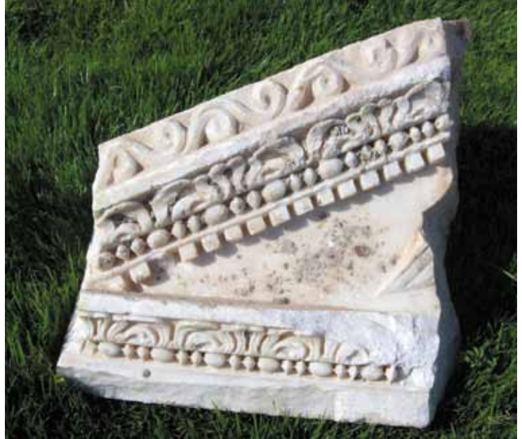
Res. 28 Beşik Çatılı Lahit Kapağı Alınlık Parçası

Yukarıdakilerin haricinde mermer kaliteli lahitler için kullanılmış olan beşik çatılı kapaklara ait parçalar da bulunmuştur. Bunlardan kataloga alınanlar alınlık ve yan kenara aittir (Res. 28). Bu