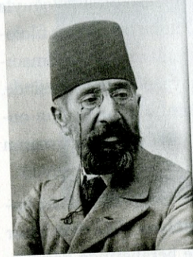
Osman Hamdi Bey (1842-1910)

Bey tarafından Muğla ili, Yatağan ilçesi, Turgut mahallesindeki Lagina Hekate Kutsal Alanı'nda gerçekleştirilir. Bu çalışmalara Osmanlı Devleti destek verir ve halk da yakın ilgi gösterir. Sonrasında Anadolu'nun farklı yerlerinde bu kazılar yaygınlaşır. İlk eski eser yasasını Osman Hamdi Bey çıkarmış ve böylece yurt dışına eserlerin çıkması resmi olarak önlenmeye çalışılmıştır.