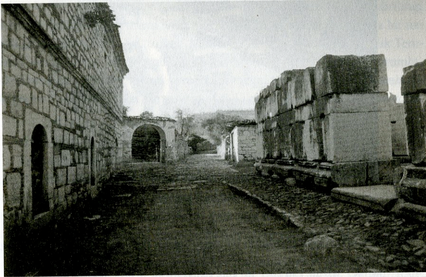
Osmanlı Dönemi taş döşeli yolun iki kenarındaki farklı dönemlerden kalıntılar

Hangi döneme ait olursa olsun, kazıda ilk yapılacak iş, kazılacak alanın haritasının çıkarılması ve bunun kağıt ve alanın üzerinde plankarelenmesinin yapılmasıdır. Yani dama tahtası biçiminde eşit karelere tüm alanın bölünmesi ve bunun kodlanması gerekir. Kazının yapıldığı alanın türüne göre ve bu plankareleme doğrultusunda kazılar başlar. Kazılarda ortaya çıkan kalıntı ve buluntular öncelikle bu plankare numaralarına göre kodlanır. Daha sonra yapıların kesin tanımlamaları yapılırca, bu kodlar yapının adıyla verilmeye başlar.