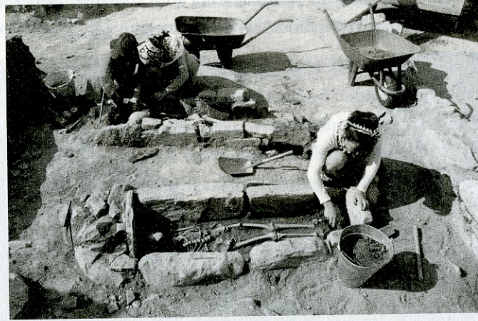
Arkeolojik Kazı Çalışmalarından bir örnek

büyüklüğüne bağlı olarak, yeter sayıda kazma, kürek, el arabası, çapa, mala, kova, fırça ve benzeri gerekli malzemeler temin edilerek çalışmalara başlanır. Kazma işlemi aynı seviyede olmak üzere, kademeli olarak üstten alta doğru yapılır. Tespit edilen kalıntı ve buluntuların tamamı açığa çıkarılıncaya kadar yerinden oynatılmaz. Sonrasında eserlerin buluntu hali çevresi ile birlikte detaylıca tanımlanır. Bulunan eserler kırıklar halinde ve bütün olmasına bakılmaksızın kayıt altına alınır ve mutlaka daha yerinden kaldırılmadan esere sırayla numara verilir. Bu numara her esere özel olup, daha sonra bu kodlar sayesinde eserin nereden ve ne zaman bulunduğu kolay bir şekilde tespit edilir. Eserlerin kabaca genel temizlikleri bulunduğu yerde, detaylı temizlik, korumaya alınması ve restorasyonu (tamamlaması) ilgili Kazı Evi veya Müze Müdürlüğü laboratuvarında gerçekleştirilir. Bulunan eserlerden taşınmaz kültür varlığı olanlar oldukları yerde, taşınır olanlar ise öncelikle kazı deposunda muhafaza edilir. Kazılar tamamlandıktan sonra her yıl çalışma sonunda bulunan tüm eserler ilgili Müze Müdürlüğü'ne teslim edilir.