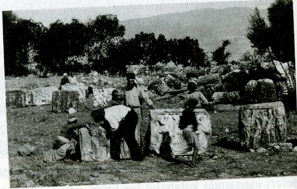
Osman Hamdi Bey'in Lagina Hekate Tapınağı'nda ilk çalışmaları yürütürken