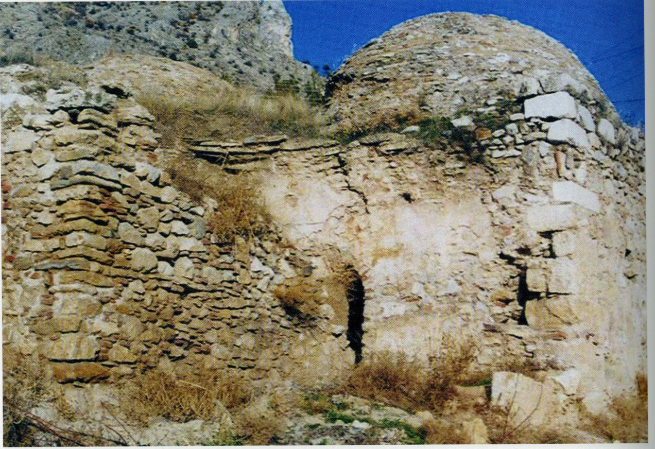
Res. 3 Eumeneia Beylikler Dönemi Türk Hamamı.

Roma kentinin bulunduğu alanda, kenti doğuya doğru sınırlayan zengin su kaynakları yer almaktadır. Bu kaynaklar Hellenistik Dönemde ovanın içinde güneye doğru akarak büyük bataklıklar oluştururlar. Roma Dönemi'nde bataklıkta bulunan suların Menderes nehrine ulaştırılması için kanallar açılmıştır. Su kaynağı ile Göl arasında bulunan bölüm Kloudros olarak adlandırılmıştır 16 . Kent Işıklı su kaynağının etrafında yayıldığı için de su problemi bulunmamaktadır (Res. 1-2). Çünkü kaynağın önündeki suyun içinde bulunan moloz taş ile pişmiş toprak tuğla kullanılarak kireç harç ile örülü su dağıtım terminali vasıtasıyla, kaynak suyunun kent içinde uzun mesafelere ulaştırıldığı anlaşılmaktadır 17 . Bu kalıntıların güneyindeki alanda daha önce tespit edilmiş mozaiklerin varlığı bildirilmiş olmakla birlikte, yoğun bitki örtüsü ve suyun berrak olmaması nedeniyle bunun detaylı incelemesi yapılamamıştır. Gelecekte yapılacak bir temizlikten sonra bu mozaiklerin ölçüleri, ait olabileceği yapı ve dönemi ile ilgili daha kesin bilgilere ulaşılabilecektir.