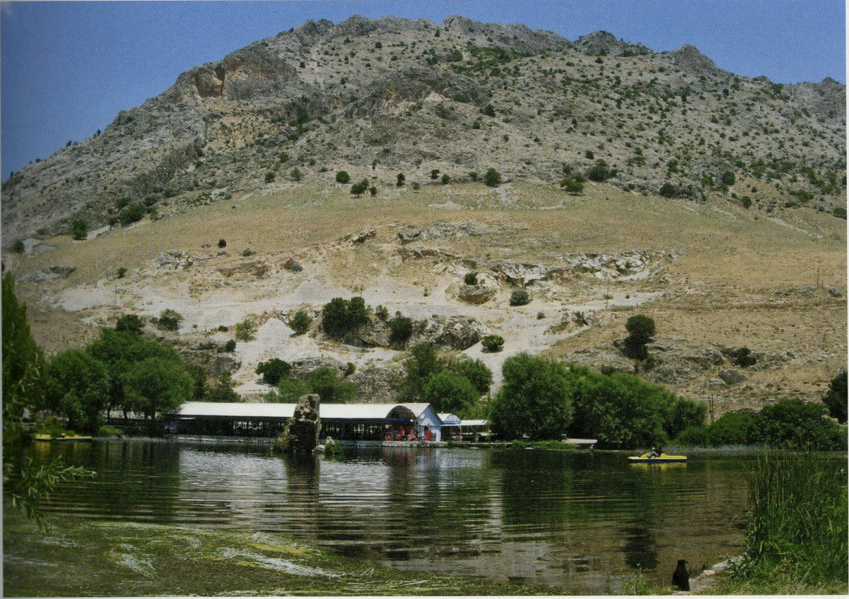
Res. 2 Işıklı Kaynağı ve Önündeki Göllet.

ve aileleri, askerler, subayların ve askerlerin köleleri kullanıyordu 14 . Sivil halk, sabah saatlerinden kapanışına kadar hamamdan yararlanırken askerler, ancak komutanların izin verdiği saatte yararlanabilirlerdi. Günün erken saatlerinde banyo yapılırsa, banyonun verdiği rahatlama ile vücut gevşeyecektir. Vücudun gevşemesi ise bir asker için düşünülebilecek en son şey olmalıdır. Bu nedenle hamama gidiş izini, işlerin ve savaş eğitimlerinin bittiği, vücudun yorulduğu akşama doğru olan saatlerde veriliyor olmalıdır. İmparator Septimus Severus, disiplinsiz askerlerin gün ortasında banyo yapmalarından şikayet etmişti 15 . Bu nedenle askerlerin yıkanmaları için kurallar getirilmiş, bu kurallara uygun hamamlar inşa edilmiştir. Askeri hamamlarda dolaşım şu şekilde olmaktadır: Hamama giren asker önce apoditeriuma gelerek üstünü değiştirir, terleme odasına gelerek vücudunu yağlar ve striglisle temizlenirdi. Terleme odasından sonra caldariumda sıcak su ile yıkanır, terleme odasına geri döner veya soğuk suyla yıkanmak, vücuduna kokulu yağ sürmek için frigidarium odasına geçerdi. Daha sonra apoditeriuma geri dönüp elbiselerini giyerek hamam turunu bitirirdi.