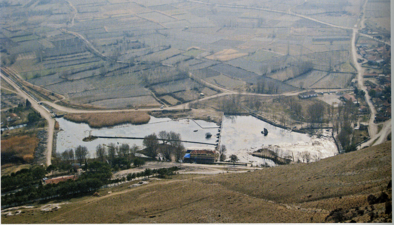
Res. 1 Işıklı gölünün Helenistik kentten görünümü.

olduklarını söylemiştir 7 . Alexander Severus'dan sonra bazı askerler aşırı banyo yapma alışkanlıkları nedeniyle orduda isyan başlatmışlardır. Suriye lejyonlarından sorumlu Avidius Cassius, askerlerin sürekli banyo yapma isteklerine karşı banyo kurallarını yeniden düzenleyerek sınırlamalar getirmiştir 8 . Bir yazıtta askeri hamamların onarım ve korunmasından imparatorlar ve subayların sorumlu olmasından bahsedilir 9 . Askeri hamamlar Anadolu'da olduğu gibi Kuzey Avrupa'da Roma'nın egemen olduğu bölgelerde (İngiltere, Almanya) izlenebilmektedir. Kuzey Avrupa'da inşa edilen hamamların hangisinin sivil amaçlı hangisinin askeri amaçlı olduğu rahatlıkla anlaşılabilir. Çünkü askeri hamamlar diğer askeri ve sivil yapılardan daha iyi korunmuş durumdadır ve Kuzey Avrupa'da Anadolu'da olduğu gibi Hellenistik mimari anlayışı yoktur 10 . Askeri hamamlar M.S. 1. yy.da yarı simetrik ve halka plan tipinde inşa edilmişlerdir. Aksial simetrik plan Cladiuslar Dönemi'nde uygulanmış, bu fonksiyonlu plan tipi yeni kentlere ve büyük kentlerde yayılım göstermiştir 11 . Askeri hamamlar, sivil hamamlar gibi karmaşık olarak düzenlenmezdi. M.S. 1 ve 2. yy.da apoditerium (soyunma odası), sudatorium (terleme odası) 12 , caldarium (sıcak yıkanma odası) yapılmış, M.S. 3. yy.dan itibaren de frigidarium (soğuk yıkanma odası) eklenmiştir. Kent hamamlarında yaygın olarak kullanılan palaestra (fiziksel egzersiz alanı) askeri hamamlarda nadiren yapılırdı 13 . Bu hamamları, subaylar