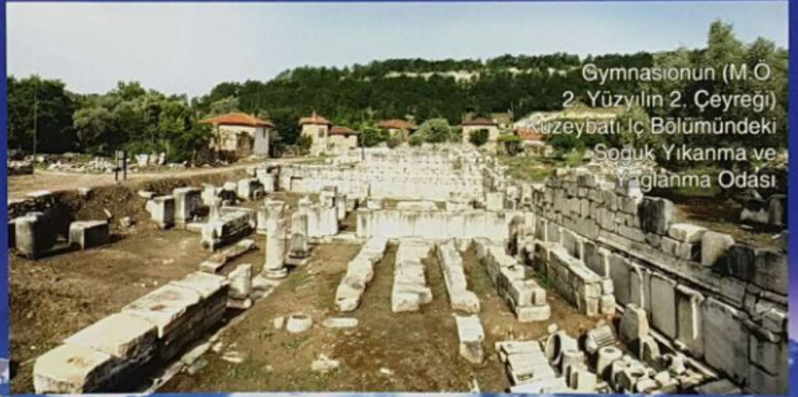
Gymnasionun (M.Ö. 2. Yüzyılın 2. Çeyreği) Kuzeybatı İç Bölümündeki Soguk Yıkanma ve Yağlanma Odası

çalışmalarında, kentin yapısına uygun olarak antik dönemlerden günümüze her devirden eserin gelecek nesillere