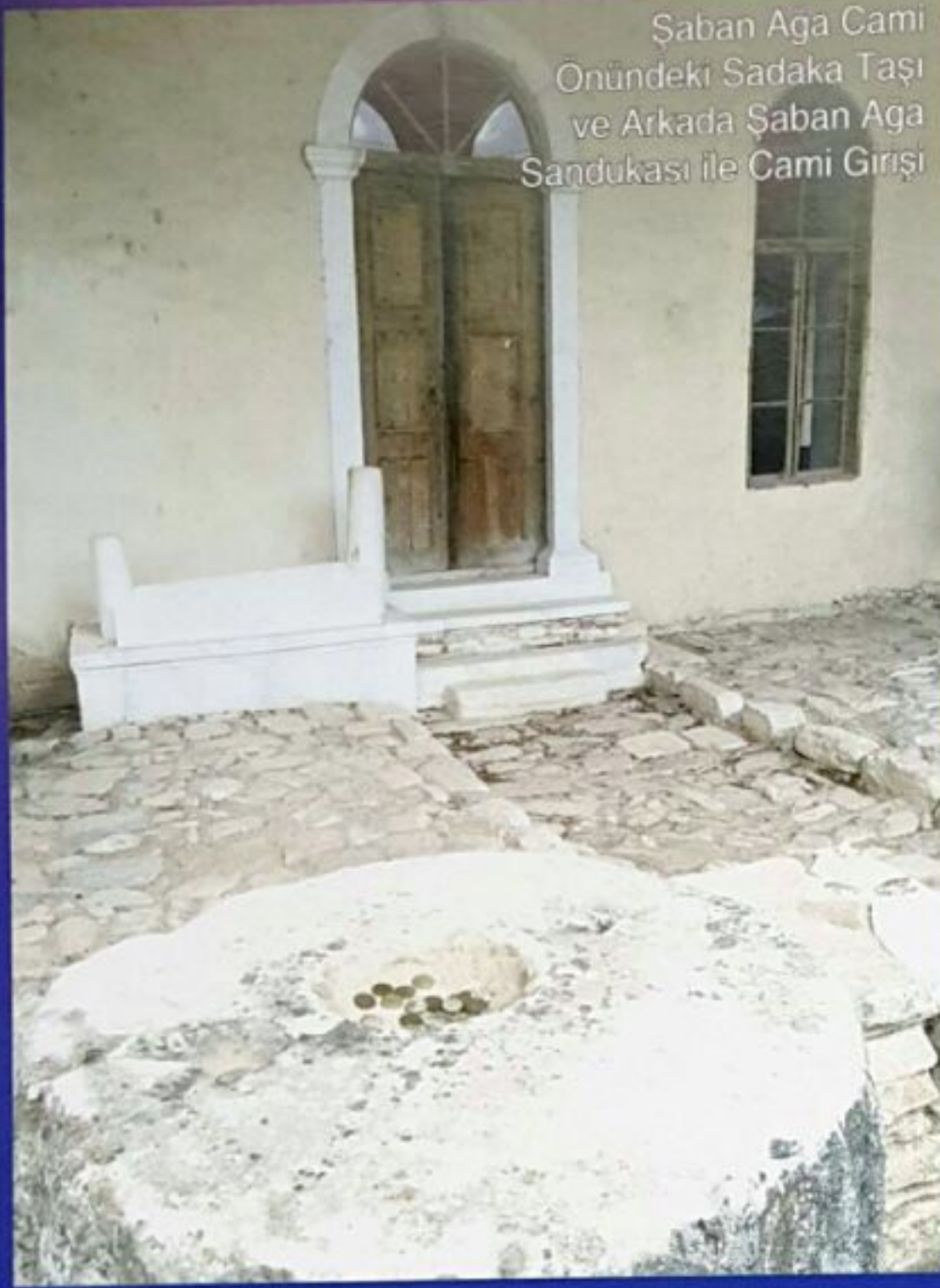
Saban Ağa Cami Önündeki Sadaka Taşı ve Arkada Şaban Ağa Sandukası ile Cami Girişi

sevilerek kullanılmış, taşçı ustaları ve heykeltıraşlar sanatlarındaki ileri başarıyı bu malzemedeki göstermişlerdir.