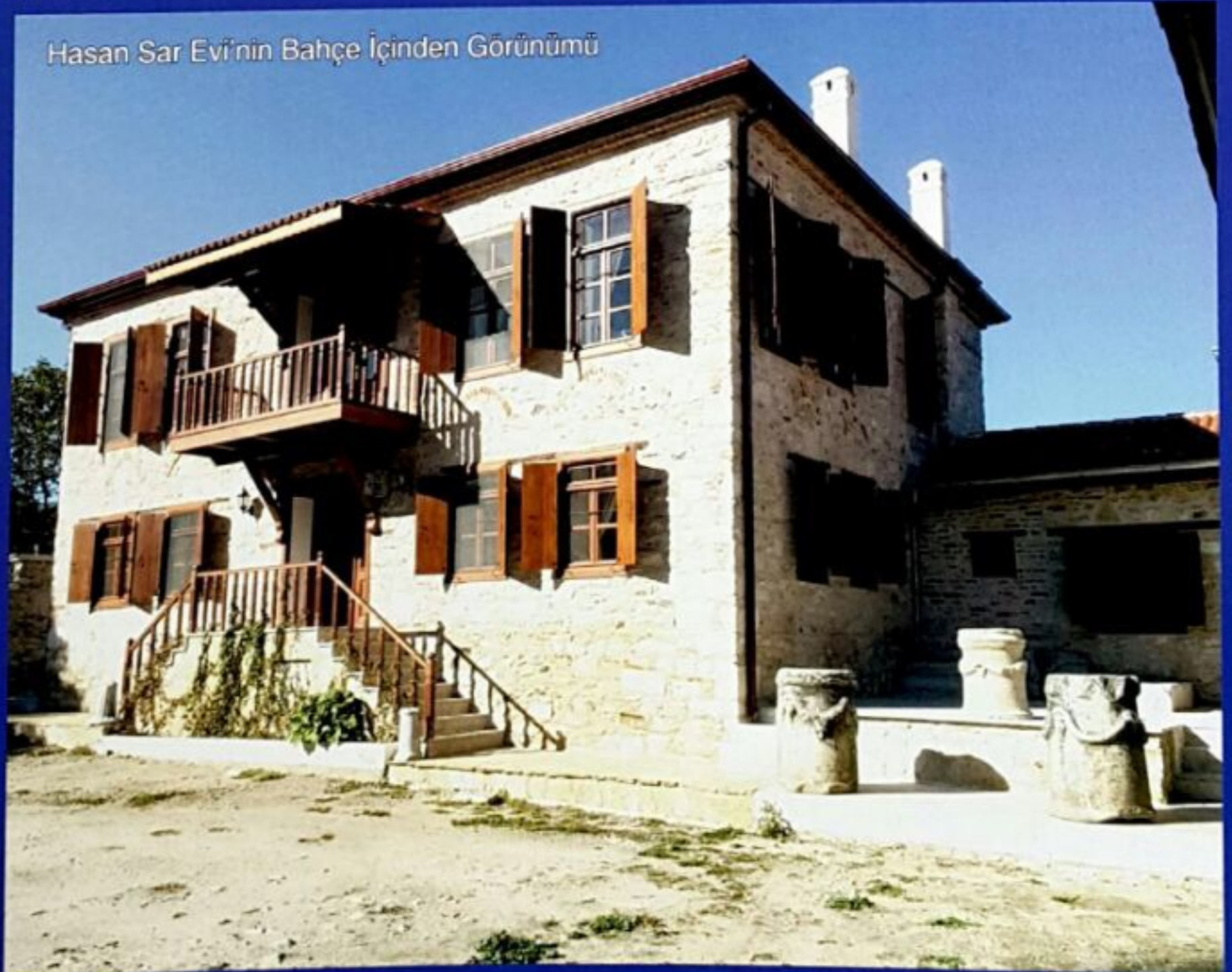
Hasan Sar Evi'nin Bahçe İçinden Görünümü

Dönemi sivil mimarisinin en güzel örneklerinden birisini oluşturan Hasan Sar Evi'nin restorasyonu yapıldığından, tüm ihtişamıyla sizi ayakta karşılar. Böylelikle bir sivil mimari örneği olan ev, ana binası, bahçesi, müştemilatı, fırını ve zıbranı ile birlikte bütün olarak