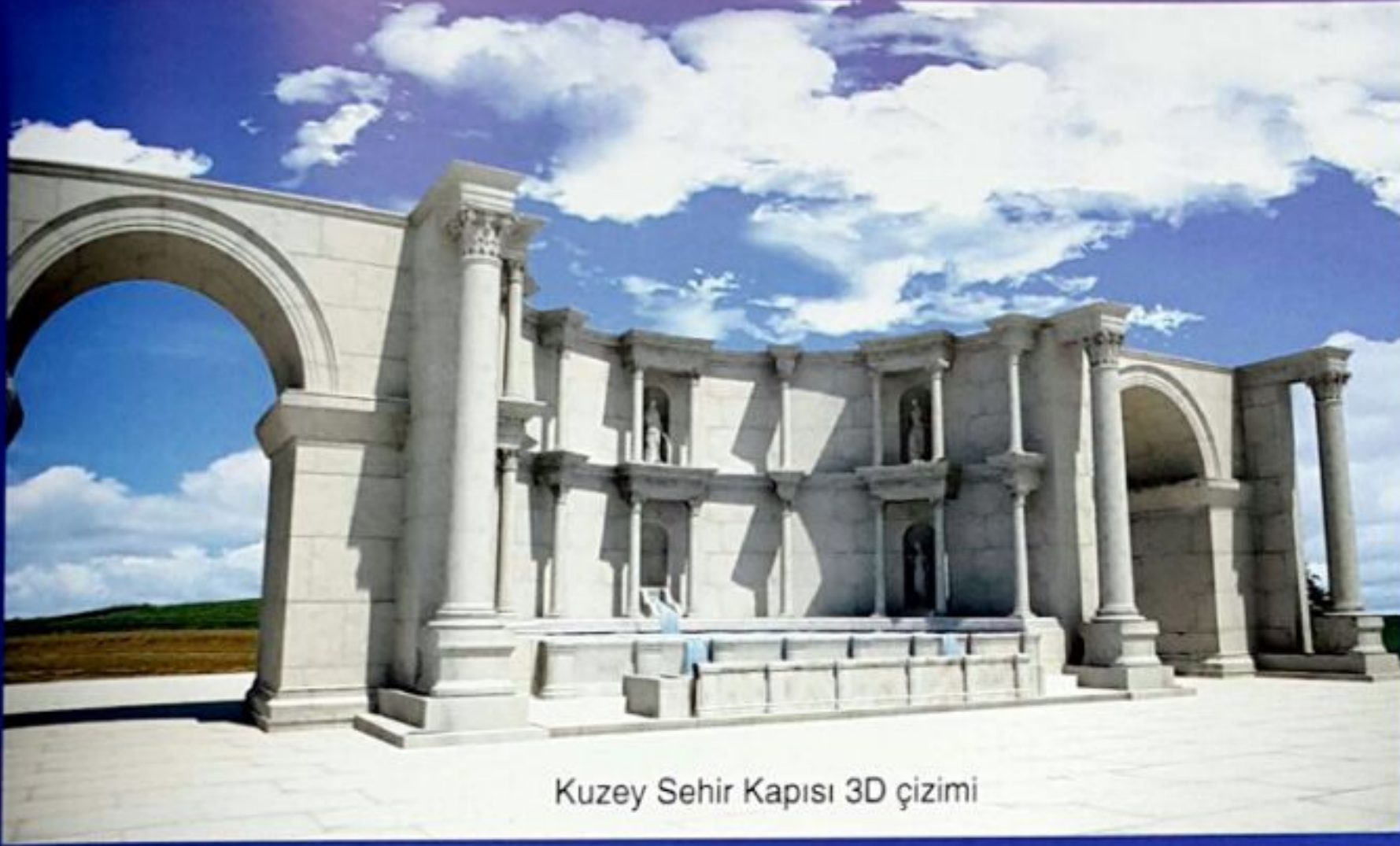
Kuzey Sehir Kapısı 3D çizimi

nemin nadide eserlerinden birisidir. Çeşmenin cephesindeki nişlerin heykelle donatılmış olduğunu düşündüğünüzde, buraya Roma İmparatoru'nun verdiği desteğin sonuçlarını anlamanız kolay olacaktır.