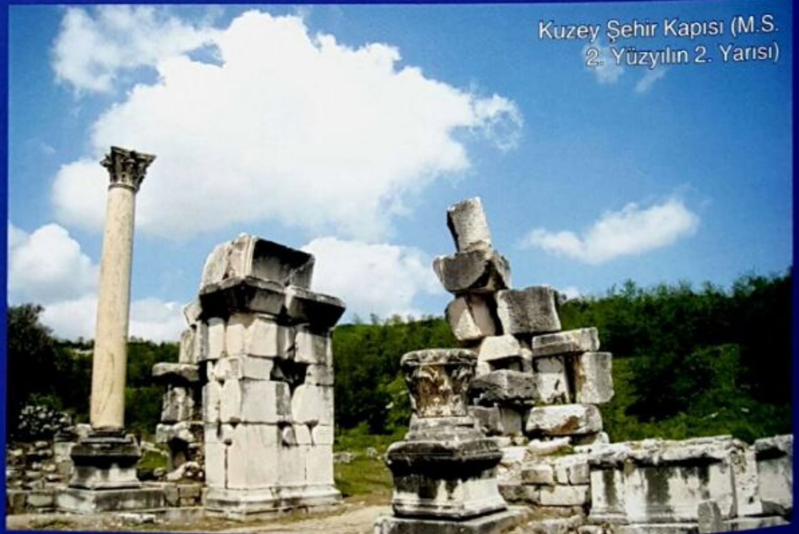
Kuzey Şehir Kapısı (M.S. 2. Yüzyılın 2. Yarısı)

Taş döşeli yolun devamında Kuzey Şehir Kapısı ve Kuzey Sütunlu Caddesiye varırsınız. Kuzey kapı hem kente giriş yerlerinden birisi, hem de Lagina Hekate Kutsal Alanı'ndan gelen kutsal yolun kente ulaşan tören kapısıdır. Kuzey Sur Duvarı üzerinde bulunan bu kapı, bir giriş olmasının dışında, her iki kenarında kemerli geçişler ve arasındaki iki katlı çeşme anıtı ile antik dö-