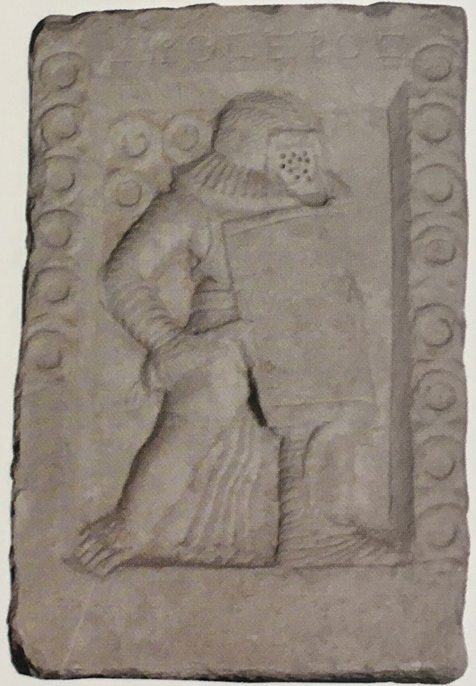
Provocator tipinde Droseros'un mezar steli.

ğüs koruma levhası takmaları, orta boyutlu kalkanları, dizlerinin biraz üzerine çıkan metal bacak korumalıkları ve kısa kılıçları, bir bütün olarak provocator armaturasının özellikleridir ve Stratonikeia stelleri üzerinde de aynen görülmektedir. Kentte bulunan eserlere göre provocator tipinin yazıtıyla birlikte bütün olarak görülebildiği güzel bir örnek Droseros'un mezar stelidir.