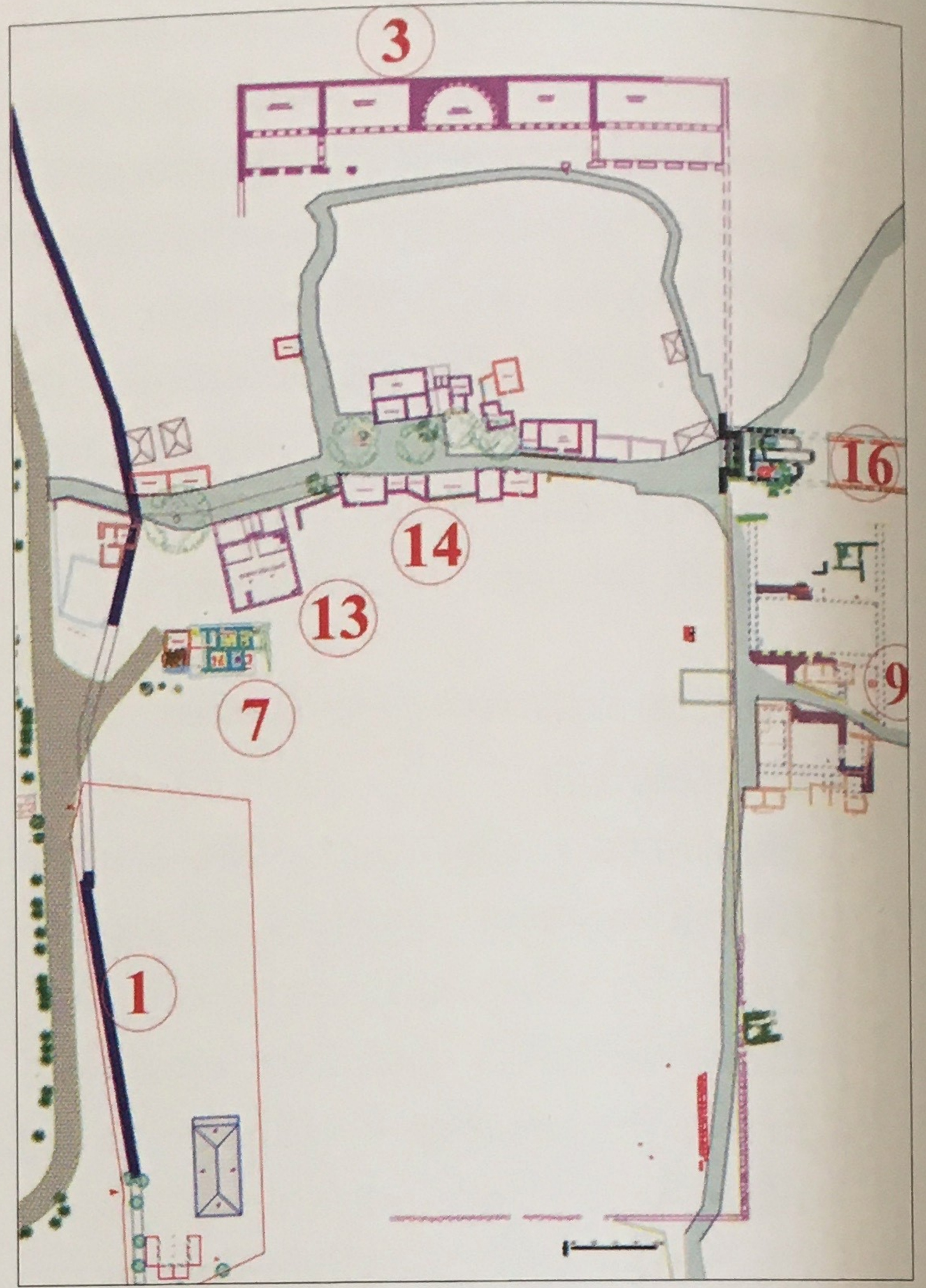
Gymnasionun kapladığı alan ile üzerinde ve yanında bilinen yapılar.

Ludus 'un olması için barınma ve dövüşler için uygun bir alanın bulunması gerekmektedir. Stratonikeia'da bu tür bir yapı henüz açığa tespit edilmemiştir. Açığa çıkarılan yapılar ve kentin topoğrafyası dikkate alındığında bu tür gösteriler için yeni bir yapının kentin doğusunda aranması doğru olacaktır. Bunun dışında, mevcut yapılardan, Helenistik Dönemde inşa edilen gymnasion bu ihtiyaçlara cevap verebilecek büyüklükte, 105x267 m ölçülerinde geniş bir yapıdır. Gymnasion 'un yalnızca kuzey kenarı ve