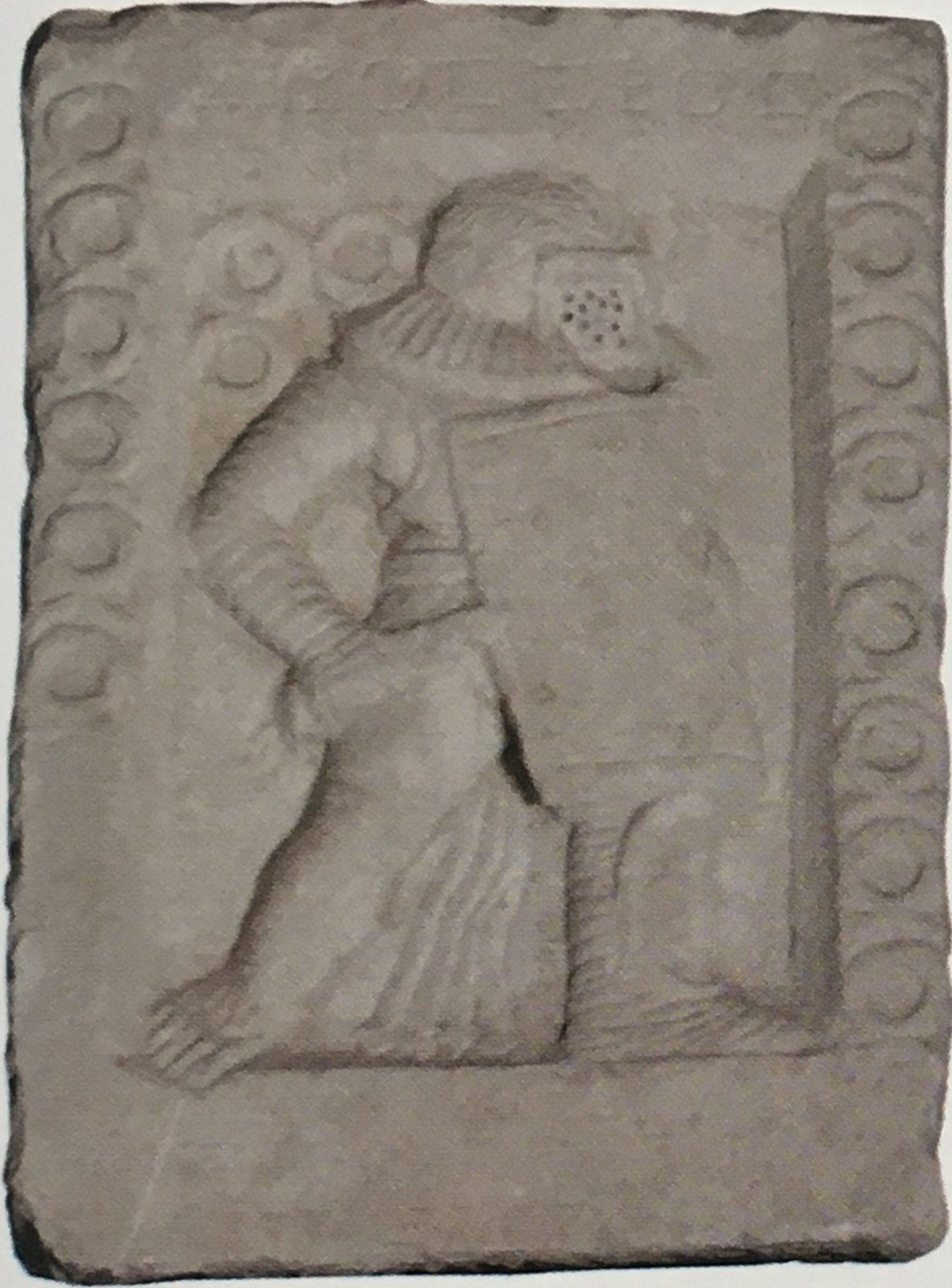
Provocator tipinde Droseros'un mezar steli.

ler içermektedir. Mezar stelinde Üçüncü kategoriden Droseros. Beni, Droseros'u, Kader Tanrıçası'nın oyunlarıyla Akhilleus öldürdü. Bir zamanlar sahnelerde ben vardım; şimdi stadionlarda Akhilleus var yazmaktadır. Dövüşlerin gerçek-