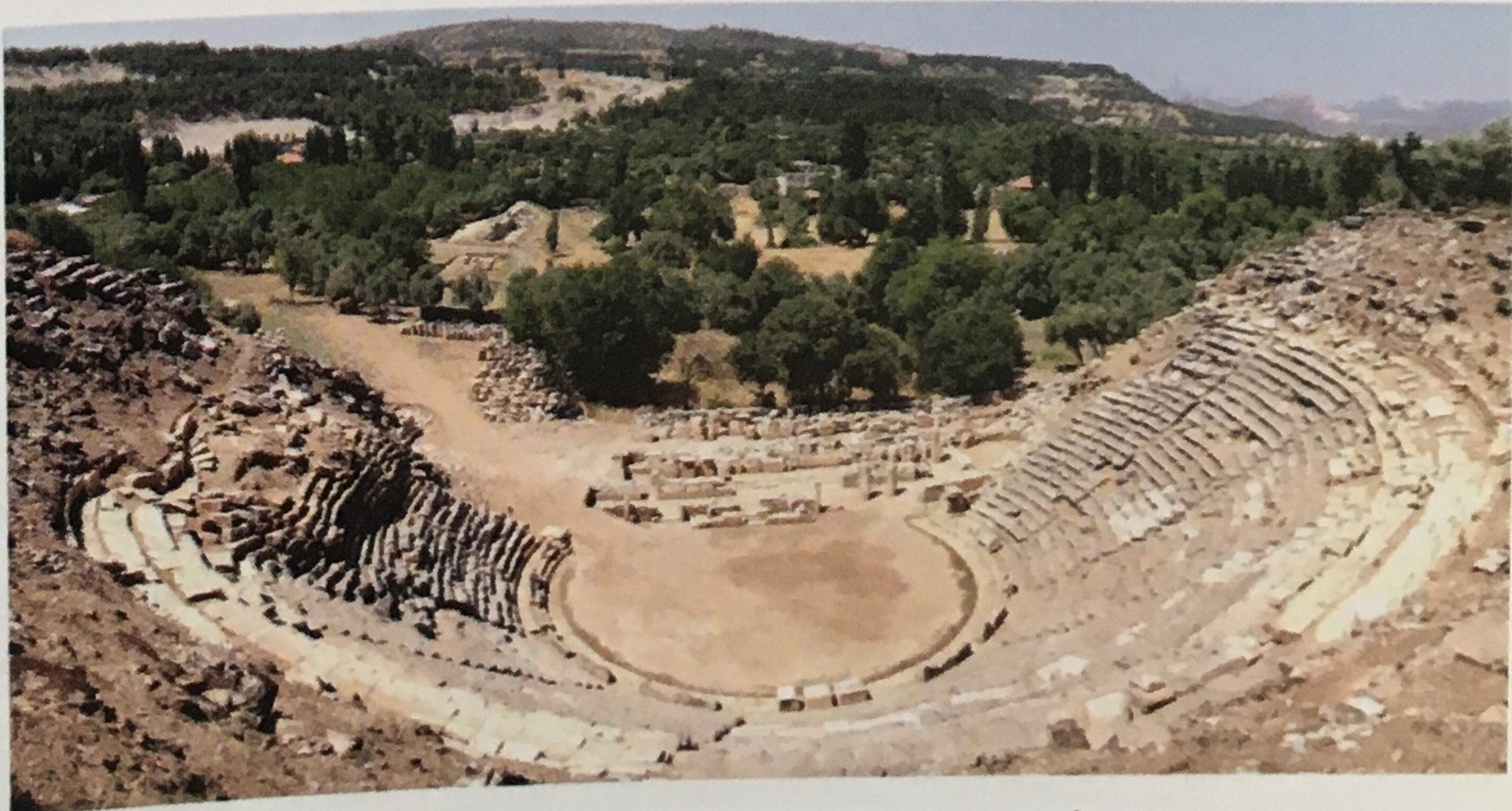
Tiyatro ve orkestrası.

Anadolu'da gladyatör gösterileri için inşa edilen amfi tiyatrolar oldukça azdır. Bunun dışında dövüşler için stadion ve tiyatrolarda değişiklik yapıp kullanan Hierapolis, Nysa ve Milet gibi kentler de mevcuttur. Stratonikeia tiyatrosu incelendiğinde, Augustus Dönemi ve sonrasında düzenlemelerin yapıldığı bilirse de Helenistik geleneğin devam ettiği ve dövüşler için uygun bir alan olmadığı açıktır. Dövüşlerin yapılmasına uygun hale getirmeye yönelik bir düzenleme de yapılmamıştır. Ayrıca or-