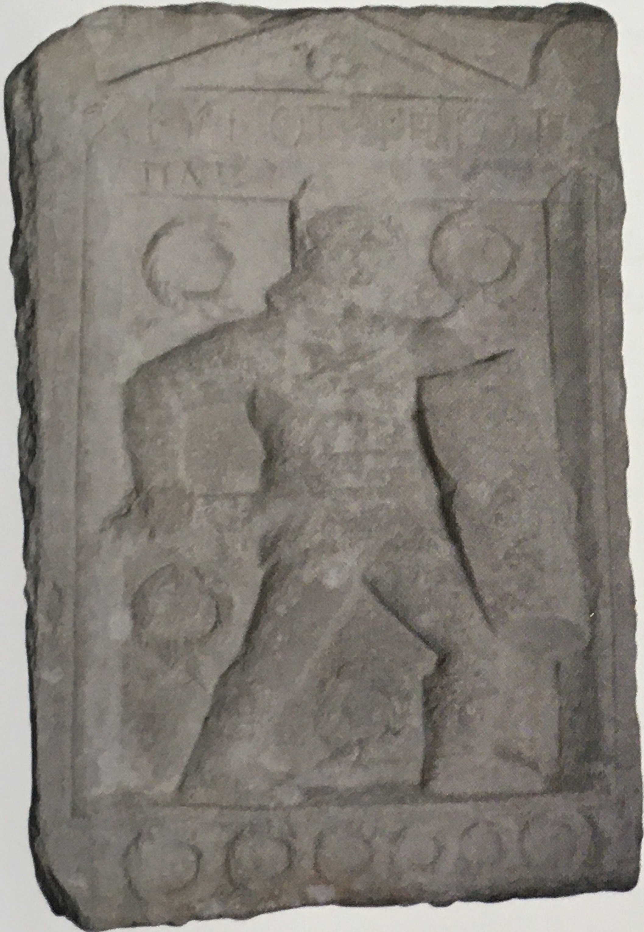
Secutor tipinde Chrysopteros'un mezar steli.

ağır silahlanmış gladyatör sınıfın- dan farklı olarak, silahları tridens adındaki üç dişli bir yaba, bazen kısa bir kılıç ve 3 metrelik ağdan oluşmaktadır. Bu ağın kenarlarına hamle esnasında kullanışlı olması için kurşun ağırlıklar takılmakta- dır. Kentteki retiarius sınıfı gladya- törlere güzel bir örnek Eumelos'un mezar stelidir.