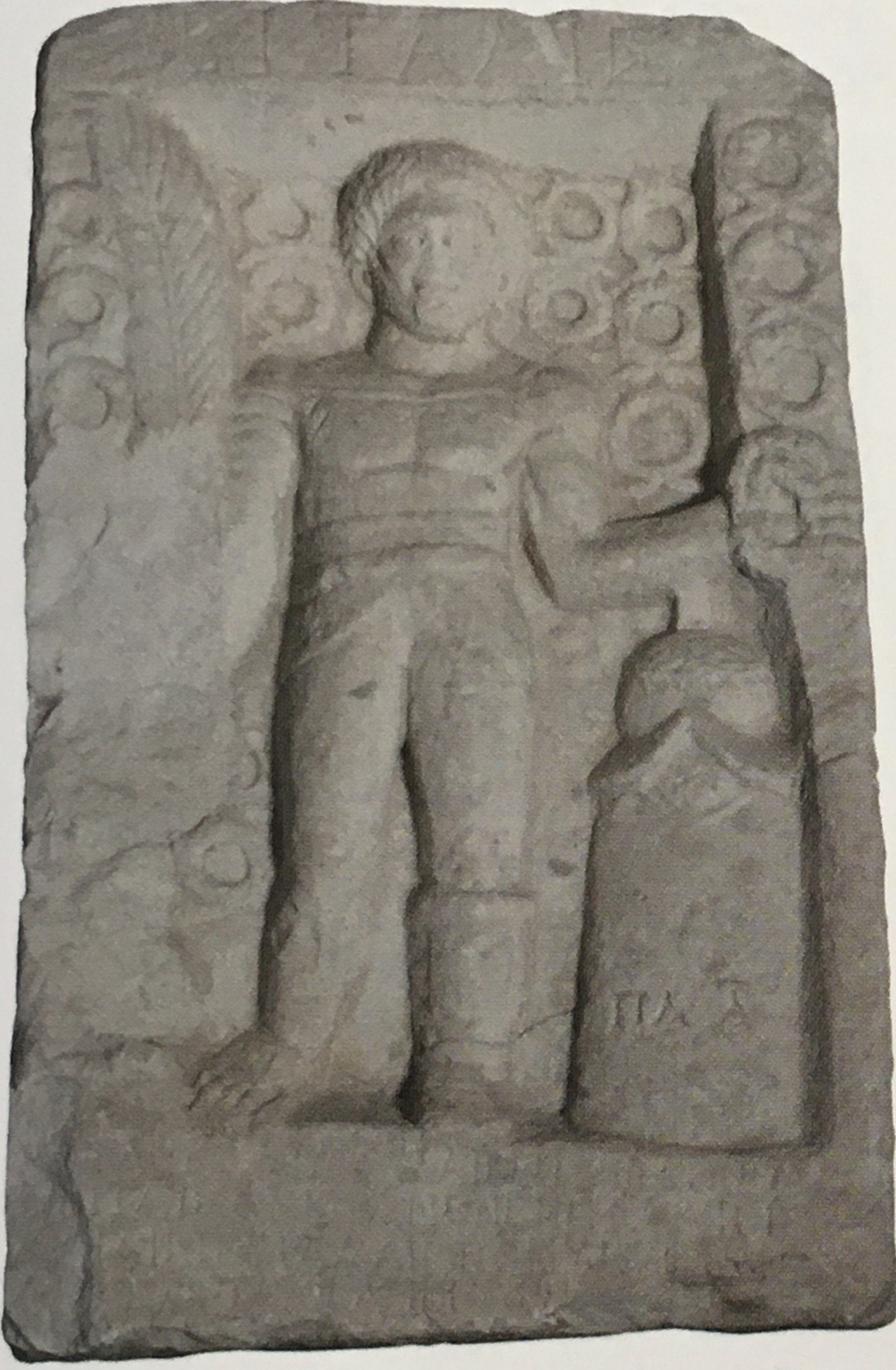
Murmillo tipinde, Şanlı Gladyatör Vitallis'in mezar steli.

duğu öğrenilen gladyatörün elinde bir palmiye dalı tutması üstün başarılar kazandığını ve “Şanlı Gladyatör” olarak onurlandırıldığını göstermektedir. Etrafında yer alan çelenkler, elde ettiği başarıların bir