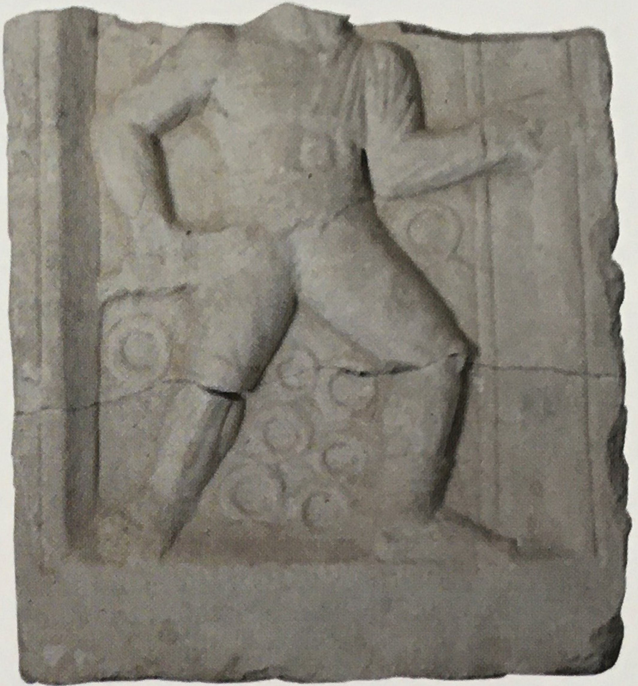
Retiarius tipinde Eumelos'un mezar steli.

meleri arasında en dikkat çekici olanıdır. Ağır silahlı sınıfa dahil olmayan bu gladyatörler deri bir bel kemeri ve kasık önlüğü giy- mektedir. Sol kolu üzerinde omzu ve enseyi koruyan galerus adındaki omuz kalkanından başka bir koru- yucusu bulunmamaktadır. Bunların