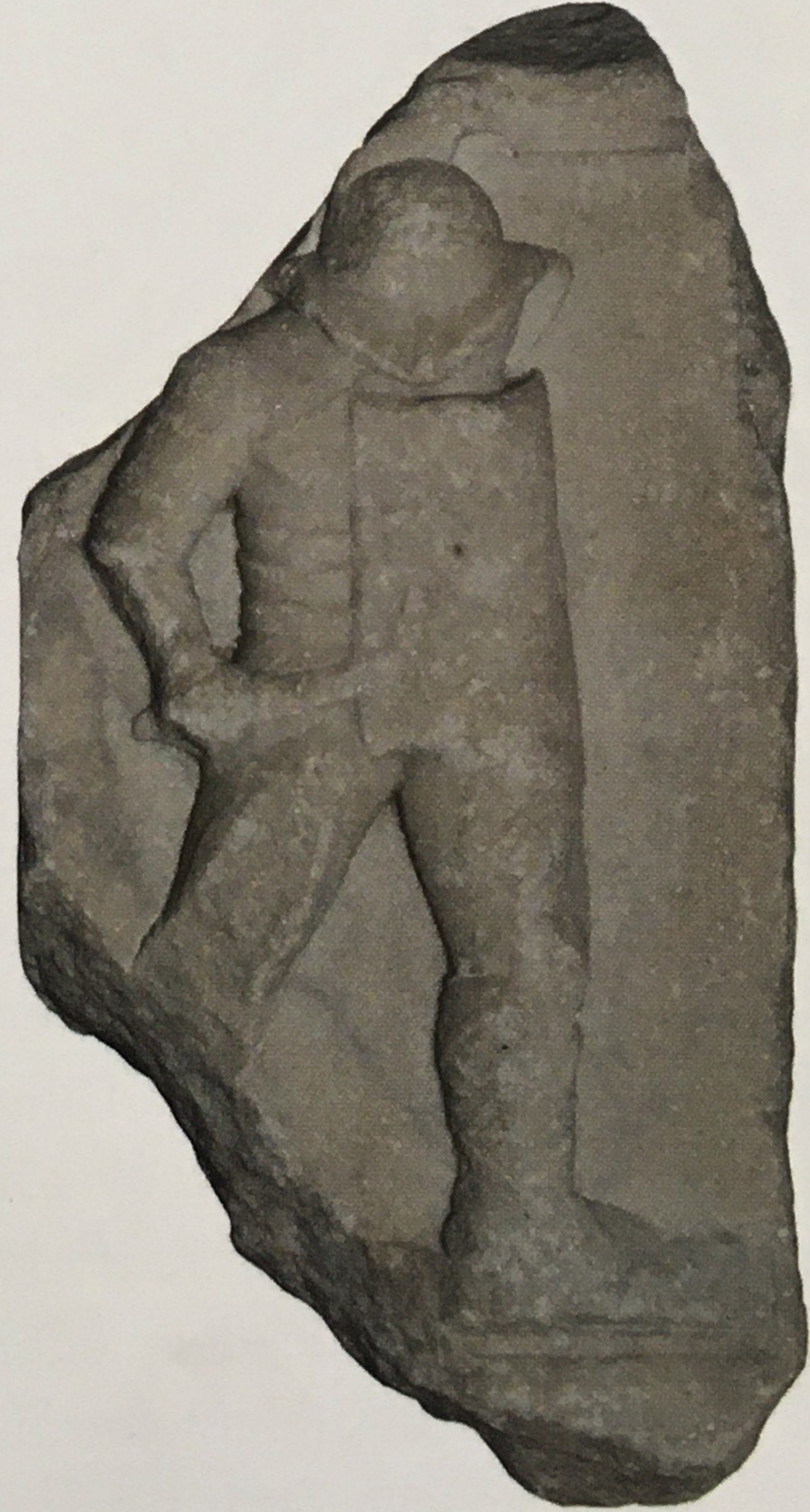
Thraex tipinde gladyatör steli.

Tek bir stel üzerinde belirlenebilen bir başka gladyatör tipi thraex 'dir. Trakyalı esirlerin gladyatör olarak dövüştürülmesiyle ortaya çıkan ve thraex olarak adlandırılan bu glad-