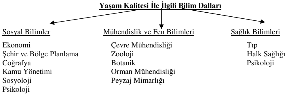
Şekil 2.1: Yařam Kalitesi ile İlgili Bilim Dalları

Bu konu hakkında, “yařam kalitesi” bařlıęı altında birçok makale ve arařtırma yayımlanmıřtır. Yařam kalitesi, farklı dalları temsil eden arařtırmacıların inceledięi bir kavramdır. Çok boyutlu bir kavram olan yařam kalitesi, hem sosyal bilimler, hem mühendislik ve fen bilimleri, hem de saęlık bilimlerinde arařtırma konusu olmuřtur. Bu nedenle, her bilim dalına göre yařam kalitesi konusunda çeřitli tanımlar yapılmaktadır. Hatta, yařam kalitesi refah ve mutluluk kavramları yerine de kullanılabilir. 11