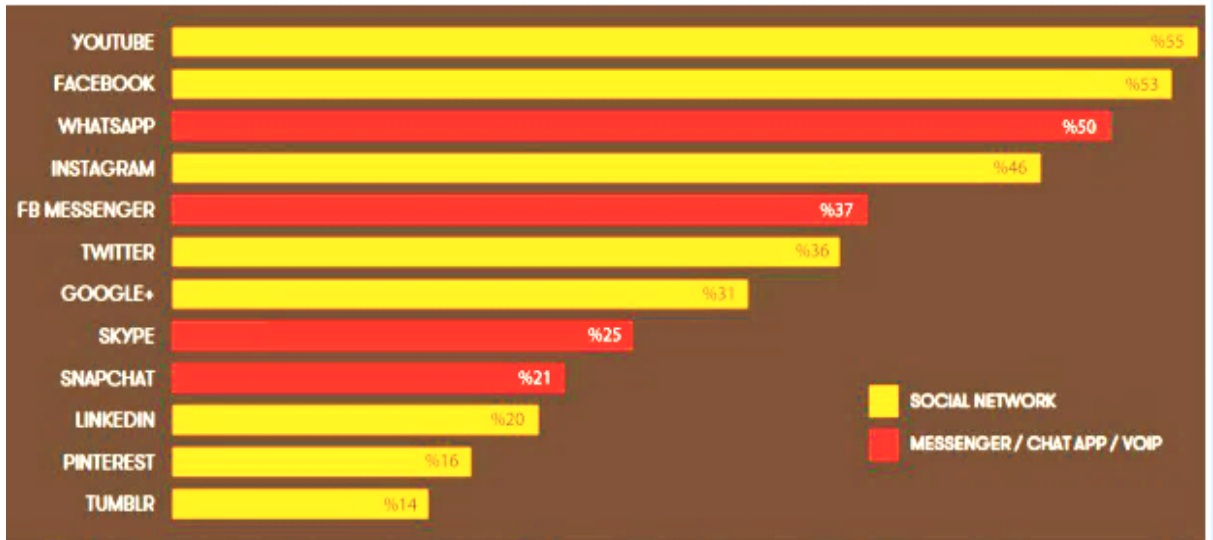
Tablo 5: Türkiye’de Aktif Olarak Kullanılan Sosyal Medya Ağları (We Are Social,2018).

Türkiye’de yetişkin bireylerin %98’i cep telefonu kullanırken, bu bireylerin %77’sinin akıllı telefon sahip olduğu bilinmektedir. Bilgisayar kullanım oranı yaklaşık %50 iken, tablet kullanım oranı %25’tir ve televizyon kullananların oranı %99’dur. Bütün bu kullanımlar dışında akıllı saatler, bileklikler ve gözlükler gibi giyilebilir teknoloji kullanan bireylerin oranı ise %9 olarak saptanmıştır. İnsanlar günde ortalama 7 saatlerini internette geçirmektedirler ve bu kullanıcıların günde ortalama 2 saat 48 dakikalarını sosyal medyada, 2 saat 45 dakikalarını ise televizyon karşısında geçirdiği bilinmektedir. Tüm bu rakamlar değerlendirildiğinde elektronik cihazların ve sosyal medya uygulamalarının bireylerin gündelik yaşamının bir parçası haline geldiğini söylemek mümkündür ( We are Social,2018).Ülkemizde aktif kullanılan sosyal ağlar sırası ile incelendiğinde ilk sırada Youtube sonrasında Facebook, Whatsapp ve Instagram’ın geldiği görülmektedir.