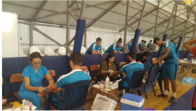
Resim 4. 2. Gün Test Öncesi, Sonrası ve 2 Saat Sonrası Kan Alımı

Aynı test protokolü akşam saat 17.00-19.00 saatleri arasında yapılmıştır. Yine test öncesinde, testin sonrasında ve testten 2 saat sonra sağlık personelleri tarafından için ön kol dirsek venasından toplam 8 cc kan alınmıştır (Resim 4). Bütün kan alımları tamamlanınca kadar sporcular aynı ortamda tutulmuştur. Alınan kanlar saklama koşullarına uygun olarak korunmuş ve en kısa zamanda laboratuvar ortamına ulaştırılmıştır. Test sırasında, deneklerin kat ettikleri mesafe kaydedilmiştir. Testin bitiminin 3 dakika sonrasında kulak memesinden alınan kanla laktat değerleri ölçülmüştür. Testin yapılacağı 2 ayrı gün arasında verilen 1 hafta dinlenme süresince, deneklerin herhangi bir antrenman veya fiziksel aktivite yapmalarına izin verilmemiştir.