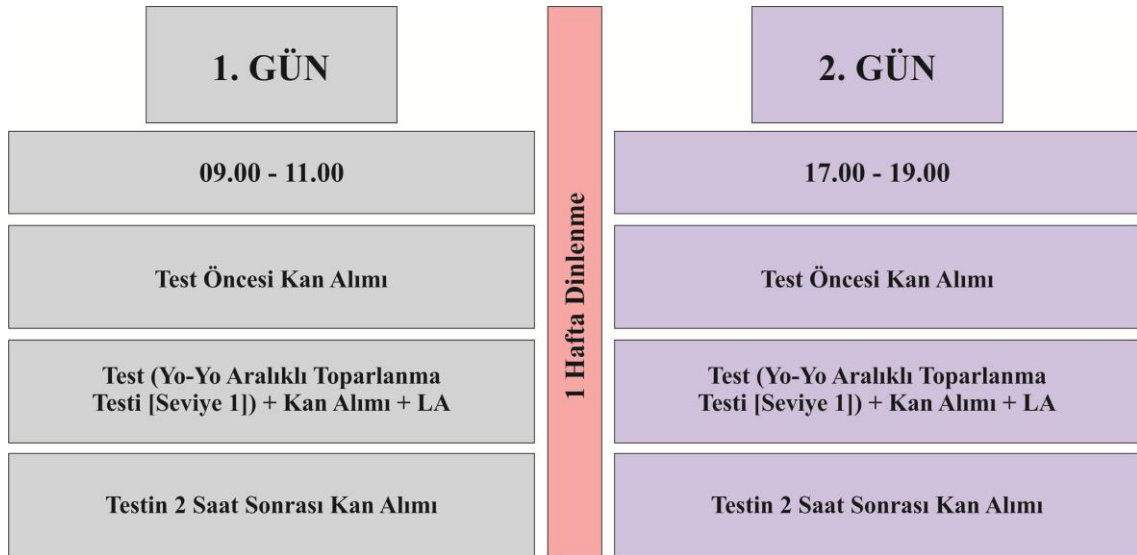
Şekil 1. Protokol