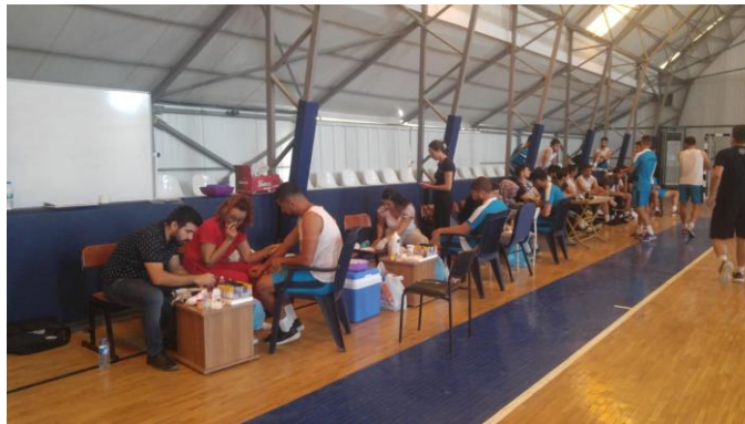
Resim 3. 1. Gün Test Öncesi, Sonrası ve 2 Saat Sonrası Kan Alımı

Test sabah 09.00-11.00 saatleri arasında yapılmıştır. Tüm deneklerden test öncesi, test sonrası ve testten 2 saat olmak üzere bir sefer için ön kol dirsek venasından toplam 8 cc kan alınmıştır (Resim 3). Bütün kan alımları tamamlanincaya kadar sporcular aynı ortamda tutulmuştur. Alınan kanlar saklama koşullarına uygun olarak korunmuş ve en kısa zamanda laboratuvar ortamına ulaştırılmıştır. Test sırasında, deneklerin kat ettikleri mesafe kaydedilmiştir. Testin bitiminin 3 dakika sonrasında kulak memesinden alınan kanla laktat değerleri ölçülmüştür. Sporculara 1 hafta dinlenme süresi verilmiştir.