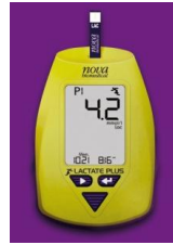
Resim 2. Laktat analizörü

Testi tamamlayan sporculardan, testi bitirmelerinden 3 dakika sonra kulak memesinden alınan kanla, laktat analizörü (Lactate Plus) cihazı ile ölçülmüştür.