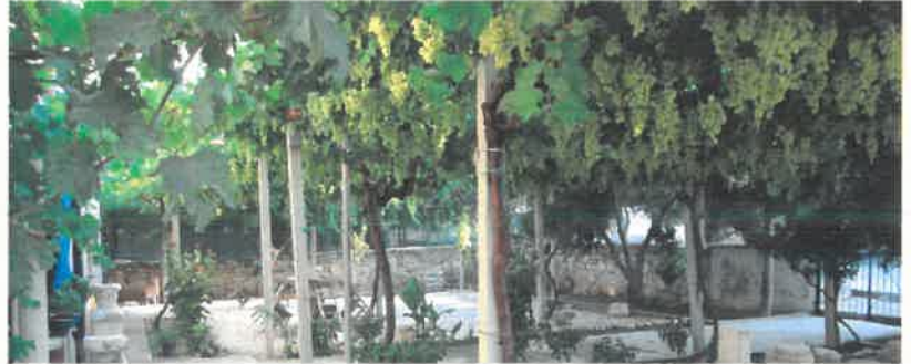
Res.8 Kazı Evi bahçesinden görünüm