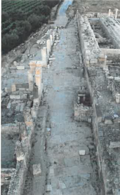
Res. 7 Sütümlü Caddesi'ne ait hava fotoğrafı