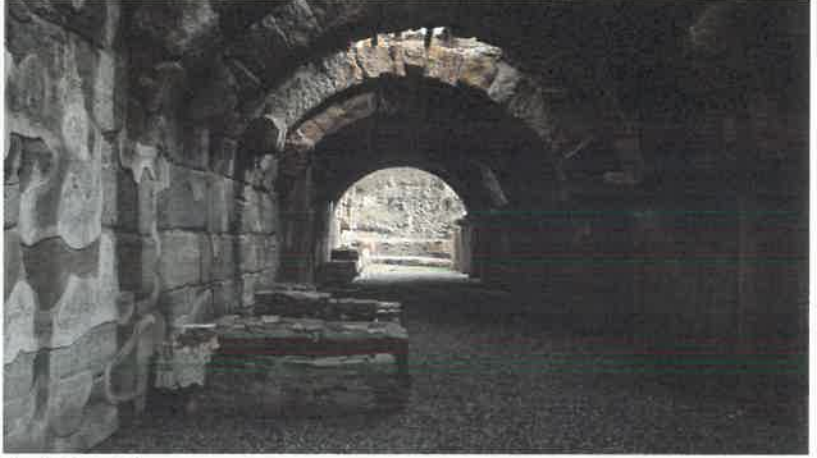
Res. 12 Kemerli Yapı