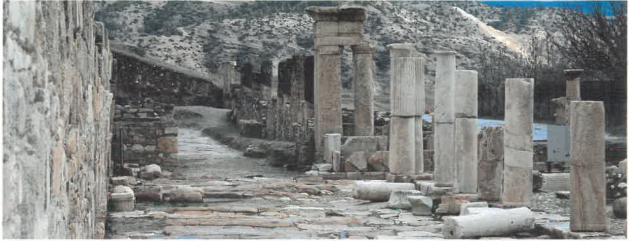
Res.6 Sütümlü Caddesi ve Orpheus Çeşmesi

polis Koruma ve Tanıtım Projesi" başlıklı projemiz ajans tarafından kabul edildi. Proje kapsamında kentin etrafı tel çit ile çevrilecek, kentte kazısı ve restorasyonu tamamlanan yapıların her biriyle ilgili çizim, fotoğraf ve açıklayıcı bilgilerden oluşan tanıtım levhaları yerleştirilecek, kenti tanıtıcı Türkçe ve İngilizce olmak üzere basılan yaklaşık 20 bin broşürün basımı sağlanacaktı. Kazı evinden sonra koruma ve tanıtıma yönelik ikinci yapı taşı da sağlam temeller üzerindeki yerini almıştı.