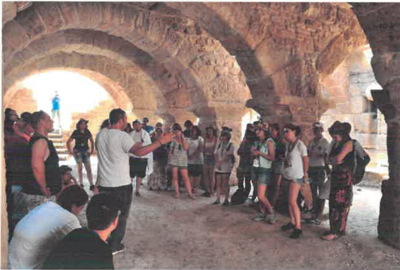
Res. 23 Tripolis Antik Kenti'ni ziyarete gelen Turmepa Deniz Temiz Derneği

landırmaları için 23 adet sütun ayağa kaldırılarak sergilenmeye başlanmıştır.