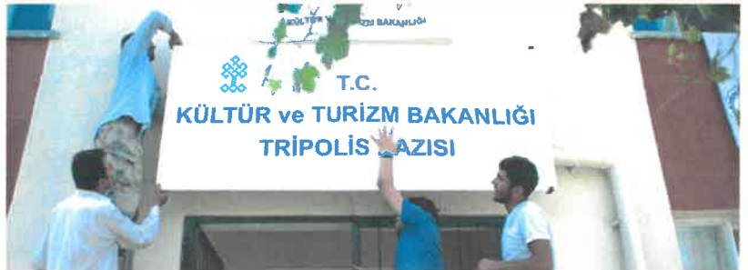
Res.9 Kazı Evi