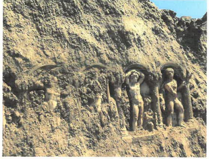
Res. 25 Tripolis Lahdi'nin gün yüzüne çıktığı an

üstünde bir kent ile karşılaşınca şaşkınlık içinde çevrelerine anlatmışlar ve kentin tanıtımlarını birinci ağızdan dinleyerek ilk fırsatta görmek için 2015 yılında yoğun bir şekilde kentimizi ziyaret etmişlerdir. Mayıs ayı içerisinde Amerikan Kültür Derneği, temmuz ayında Turmepa Deniz Temiz Derneği, kasım ayı içerisinde ise Rus medya temsilcileri, Buldan M.Y.O. Mimari ve Restorasyon Bölümü öğrencileri, öğretmenler günü etkinliği olarak kentimize gezi düzenleyen Denizli'nin güzide öğretmenleri, Anadolu Üniversitesi Arkeoloji Topluluğu ve ODTÜ koleji öğrencileri kenti ziyaret eden bazı gruplardır.