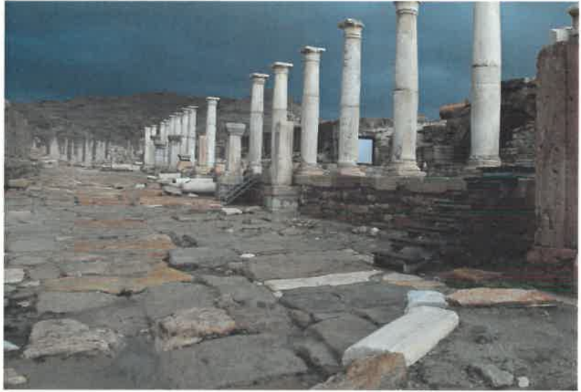
Res. 19 Hierapolis Caddesi güneyden görünümü

Aynı alanın doğusunda portiğin çatısını taşıyan 3.50 m. yüksekliğindeki sütunların restorasyonu yapılarak antik dönemde olduğu gibi konumlandırılmışlardır. Batı Stoa üzerinde yapılan çalışmaların sonunda ziyaretçilerin antik kenti daha iyi anlamaları ve o dönemin şartları göz önüne alındığında heybetli yaşamını gözlerinde can-