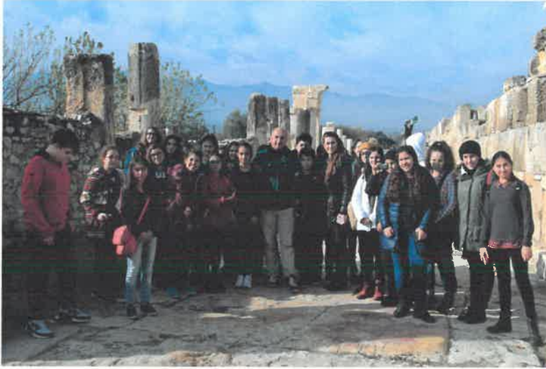
Res. 22 Tripolis Antik Kenti'ni ziyarete gelen ODTÜ Koleji öğrencileri