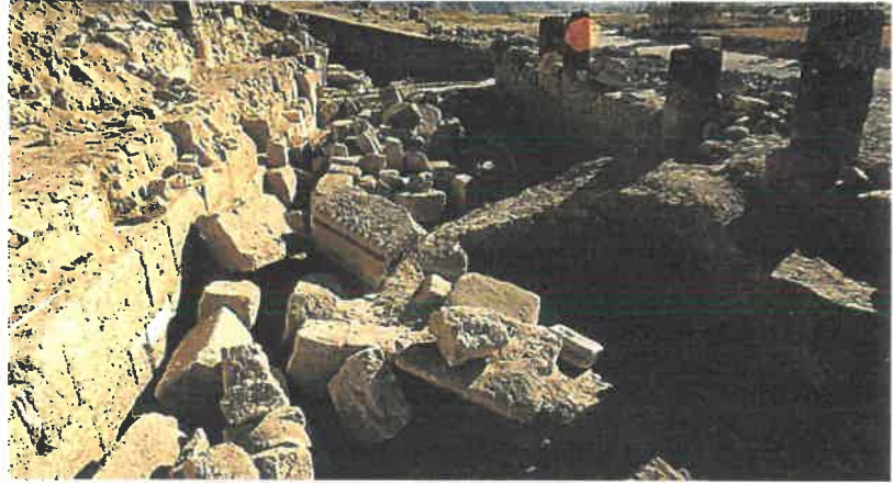
Res. 2 Sütunlu Caddesi, 2012 yılı öncesine ait fotoğraf