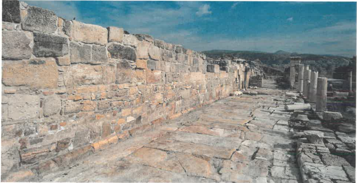
Res. 5 Sütunlu Caddesi