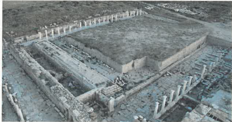
Res. 3 Agora Hava Fotoğrafı (2015)

Denizli'nin Buldan İlçesi yakınlardaki Tripolis'te yeni bir ekip ve vizyonla uzun bir aradan sonra tekrar başlatılan çalışmalarda toprağın metrelerce altındaki tarihsel verilerin bir bir açığa çıkarılmasının yanı sıra, kazı çalışmalarıyla eş zamanlı yürütülen restorasyon faaliyetleriyle birlikte kentin çehresi de bir anda değişmeye başladı.