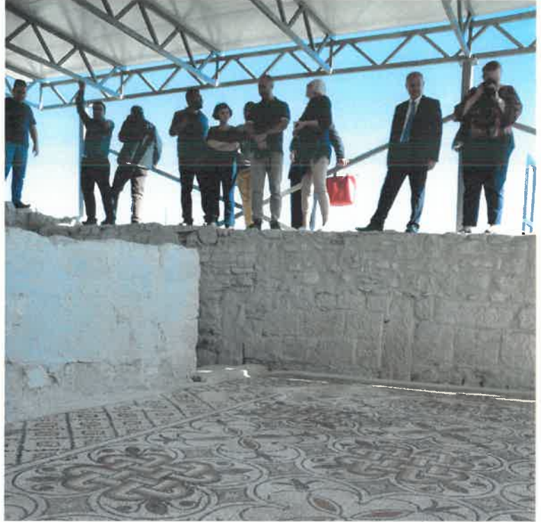
Res. 15 Mozaikli Villa

Anıtsal caddenin doğu bitişiğindeki sütunlu galeri ile cadde arasında yerleştirilen heykellerin tamamı çağdaş olup MS. 4 yy. ın son çeyreğine aittir. Bu yüzyılın sonlarına doğru meydana gelen Tripolis'i de kökten etkileyen bir deprem nedeniyle yıkılmalarının ardından binlerce yıl aradan sonra kazı ekibi Antoninus, Nebridius, Hypatios ve niceleriyle tekrar tanışıyor. Bu sadece Anadolu Arkeolojisi için değil tüm Akdeniz havzasında 14 heykelin bir arada aynı alanda bulunmasıyla bir ilkti. 2014 Tripolis için altın yıl olmaya devam ediyordu, bir yandan kentin atar damarını oluşturan 2500 m 2 alana sahip açık ve 360 m 2 kapalı Pazar yeri, bir yandan mozaikli villa ve tabernalar kentin bundan sonraki yıllarda yapılacak kazı çalışmaları