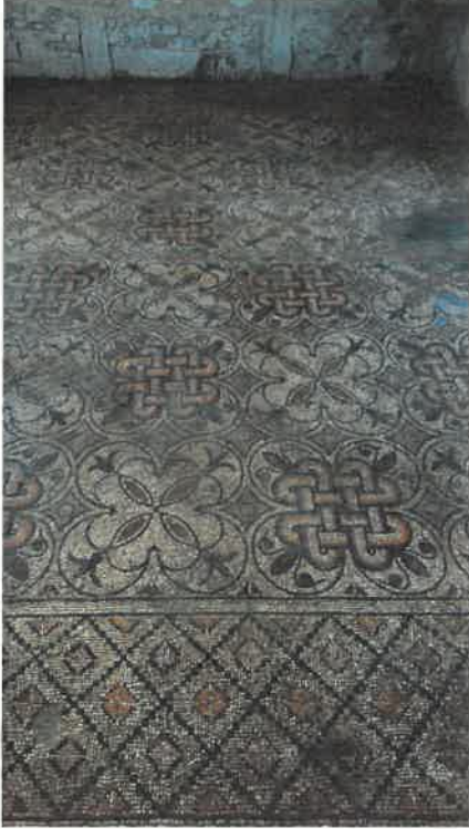
Res. 14 Mozaikli Villa büyük salon

Cadde sadece alt yapısıyla değil zemin üzerinde belli aralıklarla yazıtlı kaideler üzerine yerleştirilen heykellerle de eşsiz bir örnek olarak binlerce yıl aradan sonra gün yüzüne çıkarılmıştı.