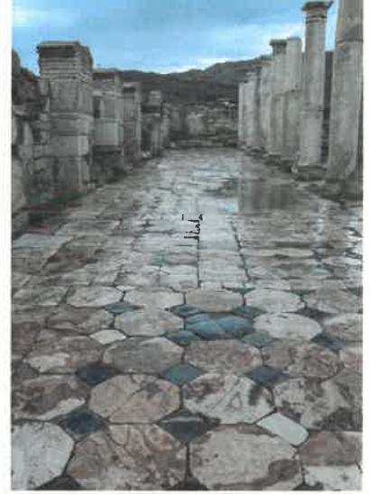
Res. 11 Agora Batı Stoa güneyden görünüm