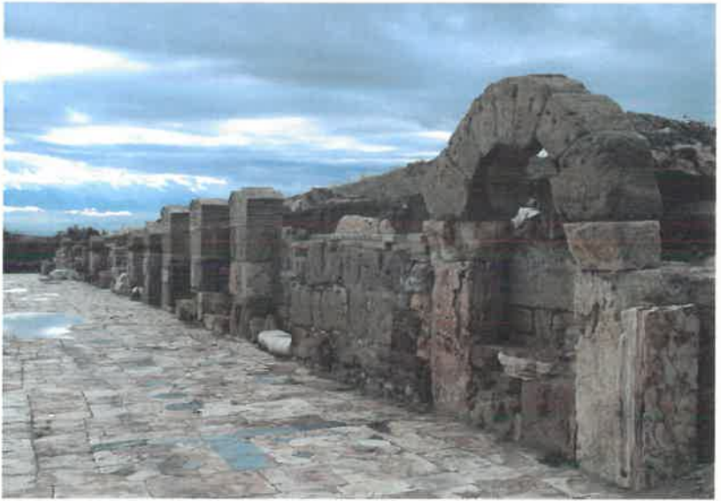
Res. 20 Batı Stoa