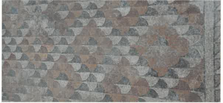
Res. 16 Mozaikli Villa küçük salon zemin döşemesi