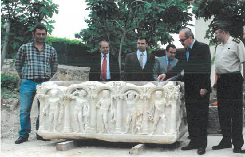
Res. 21 Tripolis Labdî, Valî Şukru Kocatepe ve Buldan Kaymakamı Hacı Uzkuç