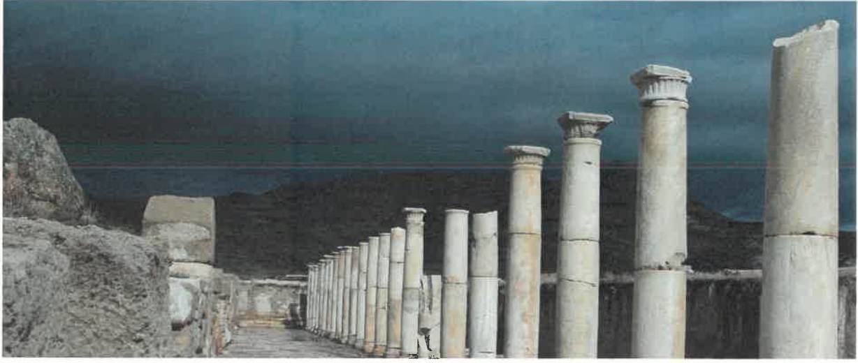
Res. 18 Batı Stoa

rıyla elde edilecek sonuçlara dair önemli çalışmalarından sadece bir kaçını oluşturmaktaydı.