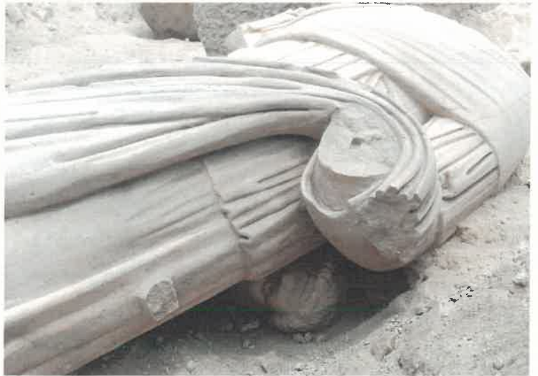
Res.17 Heykelin açığa çıkarıldığı an