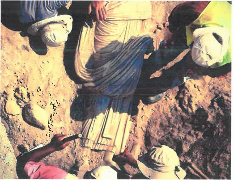
Res. 13 Heykelin açığa çıkarılma anı