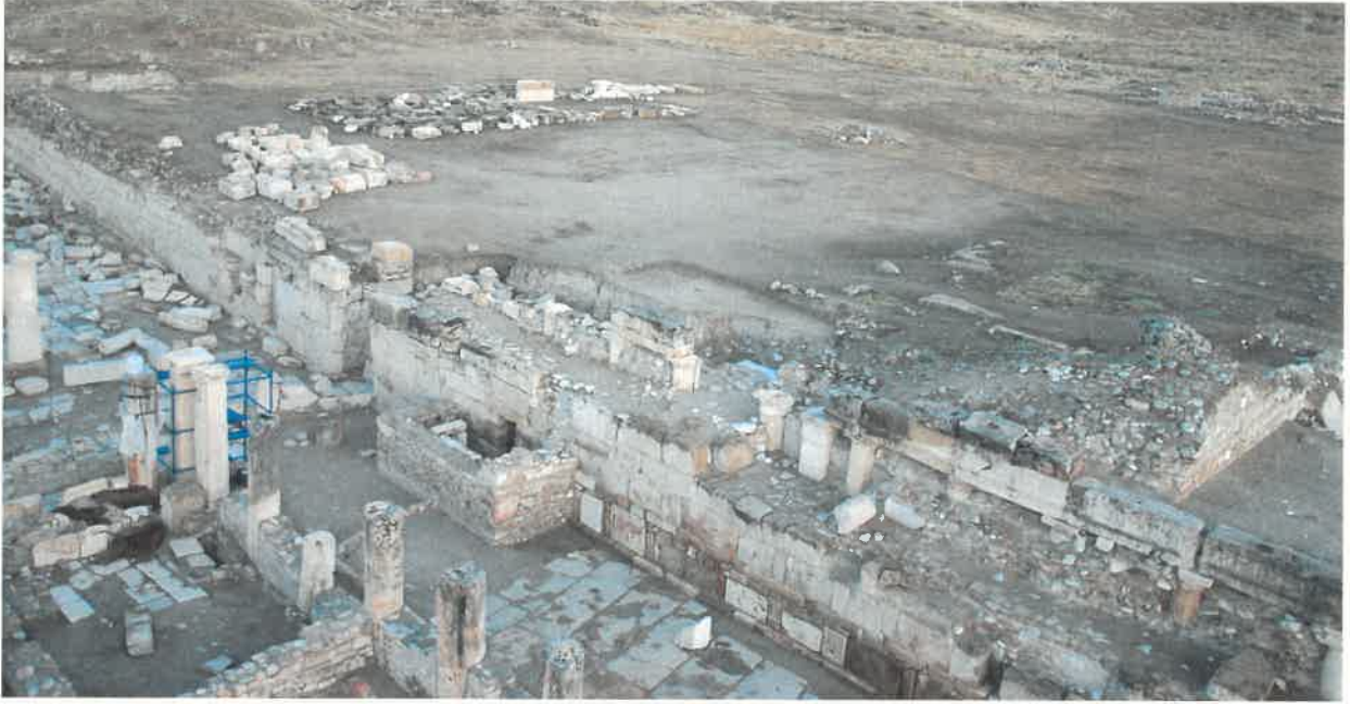
Res. 1 Kazı öncesi Agora hava fotoğrafı (2012)