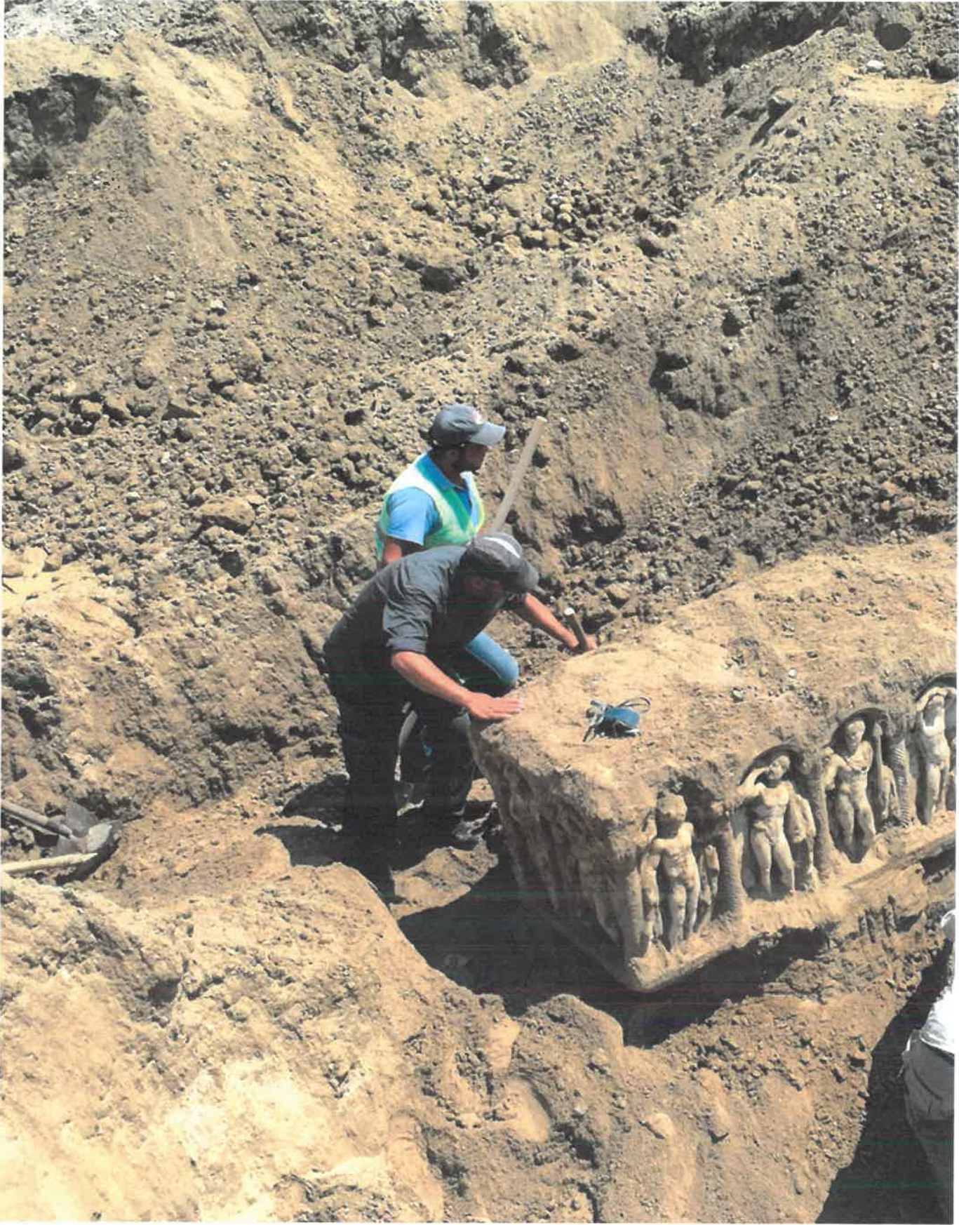
Res 24 Tyropolis Lahdi'nin gün yüzüne çıktığı an