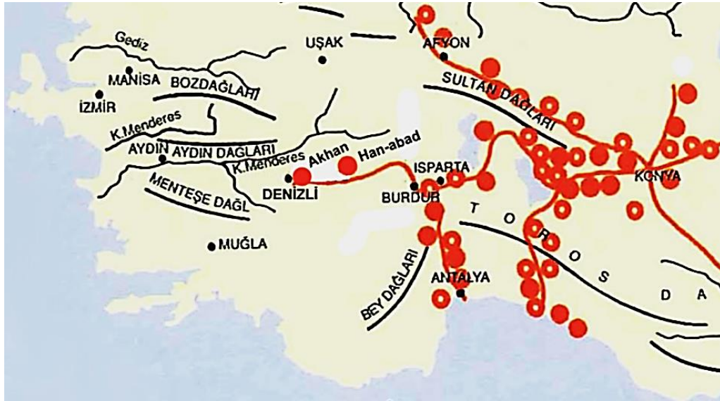
Harita 2: Anadolu Selçuklu Kervan Yolları (C. Bektaş 1999'dan işlenerek)

Antik dönemde Efes'ten Pamfilya'ya ve Orta Anadolu'daki İconium ve Ancyra gibi merkezlere giden tarihî ana yol Akhan yakınlarından geçmektedir. Ayrıca Büyük Menderes nehrinin kollarından biri olan Çürüksu (Lykus) vadisinde yer alan antik kentlerden Laodikea (Lâdik-Denizli), Hierapolis (Pamukkale) ve Chonae (Honaz) aralarındaki yolun üzerindedir. 2