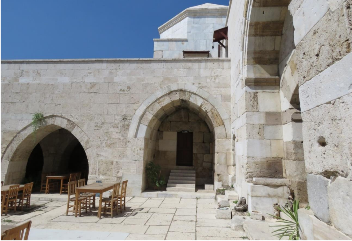
Fotoğraf 6: Mescit işlevi gördüğü düşünülen mekân

Anadolu Selçuklu kervansaraylarında tasarımları ve büyüklükleri ile servis mekânlarının sayısı, donanımı ve karmaşıklığı, bazılarının diğerlerinden farklılaşan işlevleri yüklenmesinin bir delili olarak sayılabilir. Yavuz'a göre Akhan'ın servis mekânlarının donanımına bakılarak devlethane işlevini kolaylıkla yüklenebileceğini söylemek mümkündür. Yavuz mekân-işlev ilişkilerine yönelik analizlerinde, Akhan'ın geniş ve ferah mekânları ile hamam ve çeşme gibi suya ilişkin servis mekânlarının donanımına dayandırarak bu sonuca ulaşmaktadır. 68 Bununla birlikte Yavuz'un belirttiği mimari özelliklerin yanı sıra Ladik'in (Denizli) Bizans sınırındaki bir Uç vilayetinin merkezi olması ve bu bağlamda bazı tarihi şahsiyetleri oynadığı roller de Akhan'ın devlethane işlevini görmesini destekler. Özellikle Maurozomes ailesinin Lâdik (Denizli) ile köklü bağları ve faaliyetleri Akhan'ın aktif şekilde devlethane olarak kullanıldığına dair işaretler taşımaktadır.