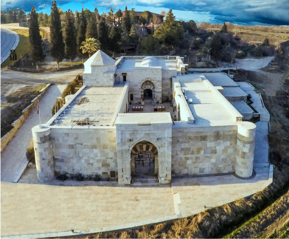
Fotoğraf 1: Akhan Kervansarayının Genel Görünümü

Denizli şehir merkezinden 8 km uzaklıkta, Denizli-Ankara karayolunun kenarındadır. Eskiden adını verdiği Akhan köyü sınırları içindeyken şu anda Denizli Büyükşehir Belediyesi sınırları içindeki Akhan Mahallesiindedir.