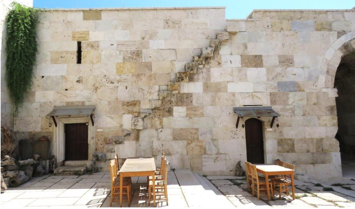
Fotoğraf 4: Devlethane işlevine yönelik mekanlar

konsollar şeklindedir ve üzerlerinde sadece yüzleri ve yeleleri betimlenen iki adet aslan figürü bulunur. Bu figürler devşirme değildir.