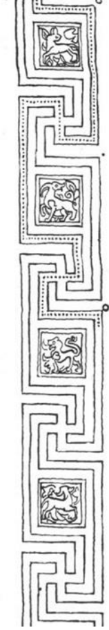
Şekil 1: Süsleme Bordürü Çizimi (Erdmann'dan)

Roux'a göre Akhan'da onaltı adet hayvan ve iki adet insan figürü bulunmaktadır. 71 Öney ise Akhan'daki figürlü bezemeleri Eski Türkler tarafından kullanılan ve Çin takviminden esinlendiği düşünülen Oniki Hayvan Takvimi ilişkili olarak yorumlamıştır. Ancak On iki Hayvan takviminde bulunan bütün hayvanların Akhan'daki figürlerin arasında olmadığını da kaydetmiştir. 72 Yine Öney, Çin takvimi ve Oniki Hayvan takviminin Akhan'daki figürlü bezemeleri açıklamaya yetmediğini kaydetmiş ve özellikle iki adet insan portresi şeklindeki betimlemeleri hesaba katınca Akhan'ın figürlü bezemelerinin Orta Asya'ya doğrudan bağlanarak yorumlanamayacağını belirtmiştir. 73