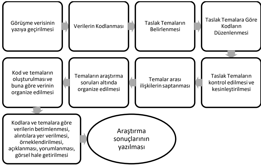
Şekil 1 Veri Analizinde İzlenen Aşamalar