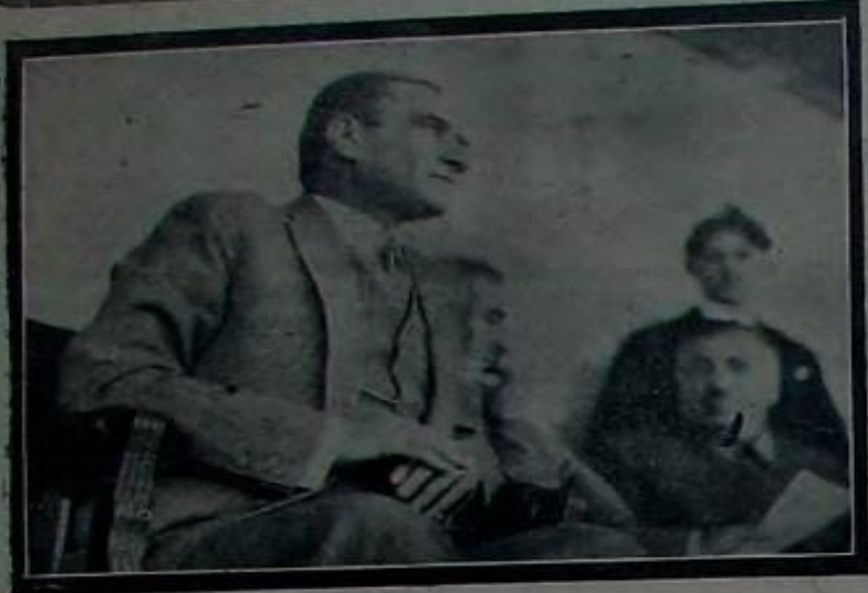
[ انقره قوشو غراف عابريغز رسليتمدن ]

ايكنجى قوشو غازى وعصمت پاتارك، وكيللرك، ميمونتارك ويكلرجه خالقك حضورنده يايلىرى