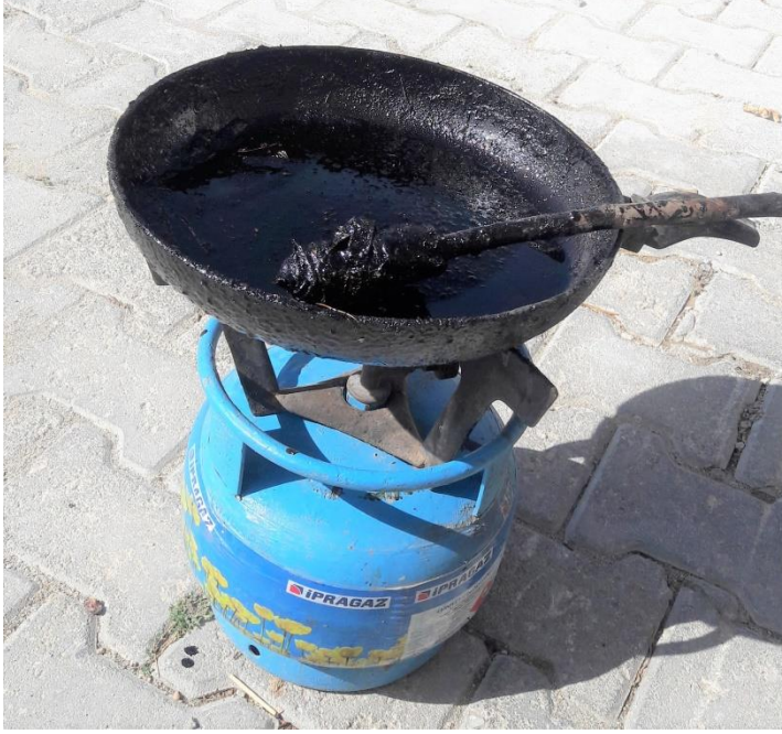
Görsel 11: Temre tedavisinde uygulanan karışım 18.10.2020