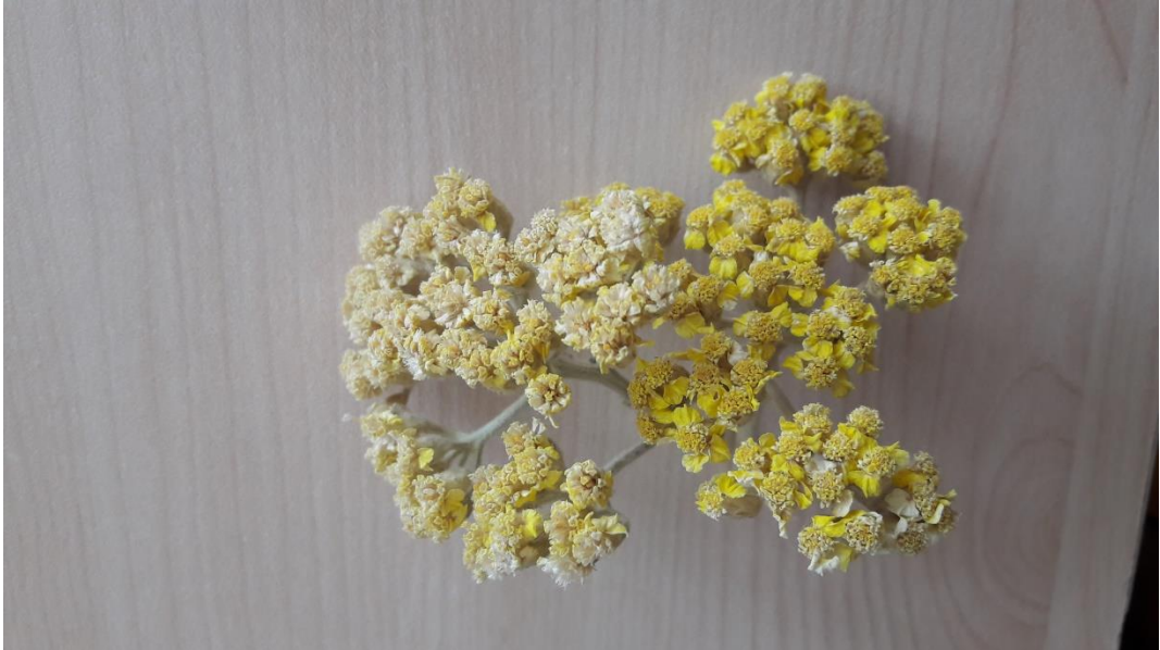
Görsel 8: Egzama ve Temre hastalıklarının tedavisinde kullanılan Civanperçemi Otu 05.10.2020