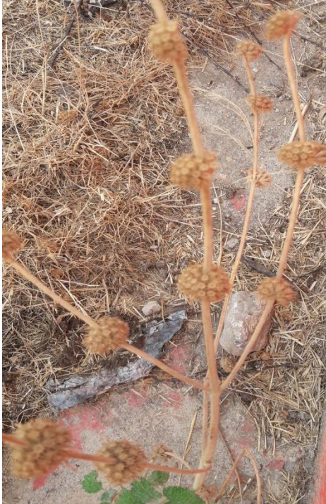
Görsel 10: İğdir Mahallesiinde bulunan Siye Otu, Karın ağrısı tedavisinde uygulanır 24.09.2020