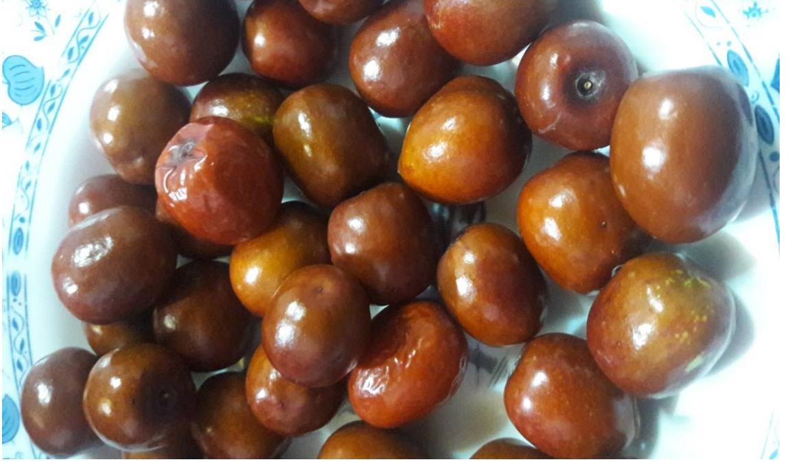
Görsel 7: Astım ve Bronşit hastalığının tedavisinde yenilen Hünnap meyvesi 21.09.2020