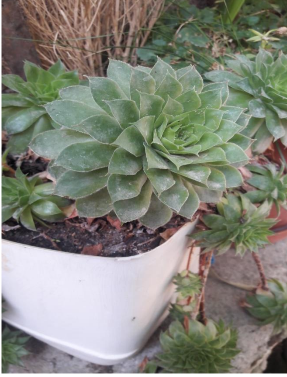
Görsel 9: Temre hastalığının tedavisinde uygulanan Temre Otu 24.09.2020