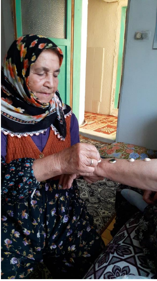
Görsel 3: Gümüşsuyu Mahallesinde ikamet eden yılancık ocağının tedavisi 22.09.2020