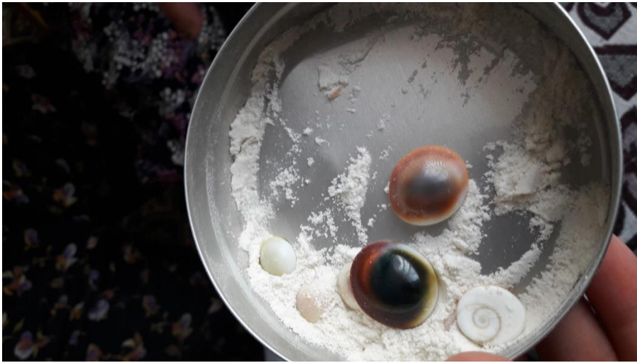
Görsel 4: Yılancık ocağında kullanılan Mekke'den getirilen taşlar 22.09.2020