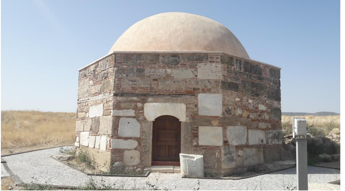
Görsel 2: Çivril ilçesine 6 km. uzaklıkta, Mentеш ve Kocakaya Mahalleleri arasındaki yer alan Beyce Sultan Türbesi 5.10.2020