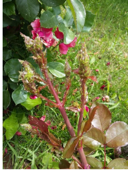
Görsel 14: Bitkilerde Yaprak Biti 16.06.2021