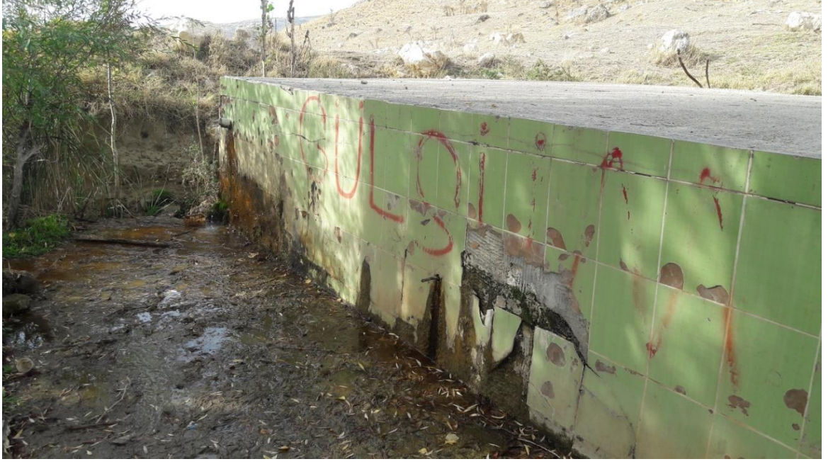
Görsel 5: Özdemirci Mahallesiinde bulunan şifalı Acısu çeşmesi 20.10.2020