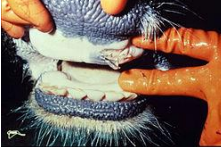
Görsel 13: Şap Hastalığı

( https://tr.wikipedia.org/wiki/%C5%9Eap_(hastal%C4%B1k) ) Erşim Tarihi: 16.06.2021)