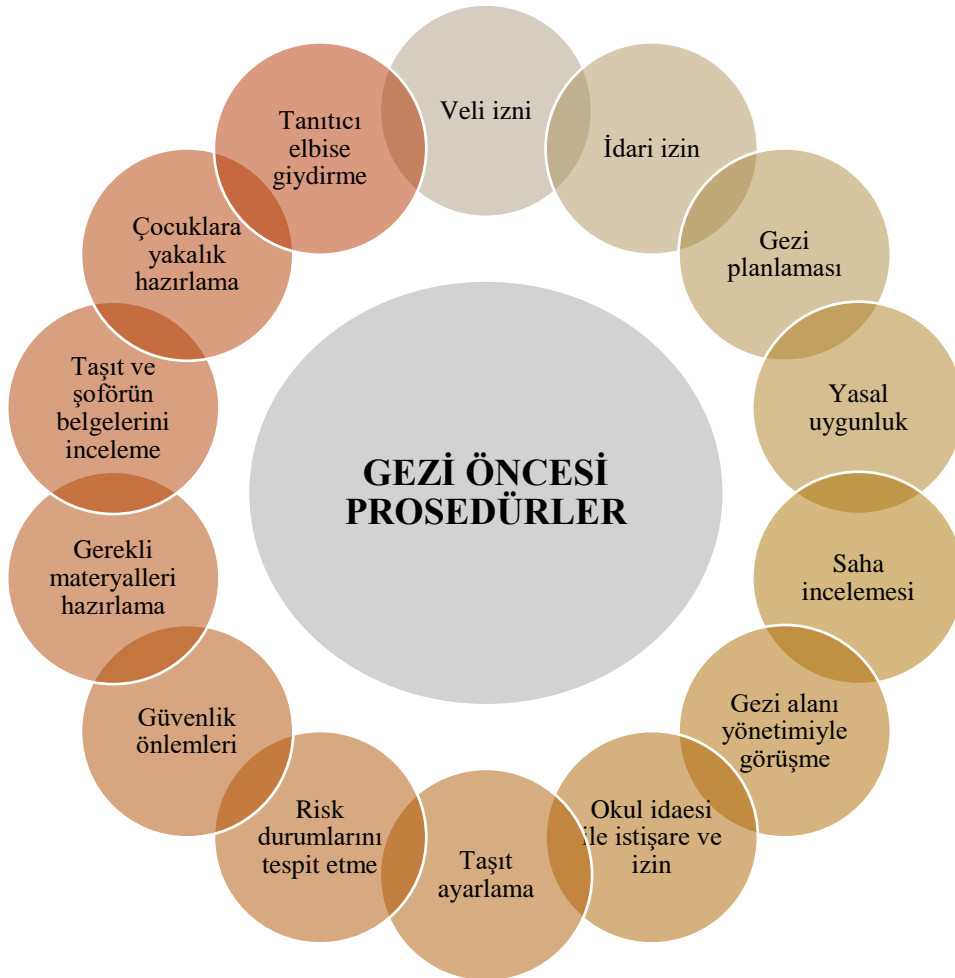
Şekil 4.4. Gezi öncesi öğretmenlerin gerçekleştirdiği prosedürler

Araştırmaya katılan öğretmenlerin alan gezileri öncesinde prosedürel çalışmalar yaptıkları görülmüştür. Bu yöndeki bulgular, Tema 2’de bulunan alan gezisi öncesi hazırlık ve planlama çalışmaları kapsamında değerlendirilmiş fakat bu prosedürel işlerin diğer hazırlık süreçlerinden kısmen ayrılması bakımından bu temanın altında farklı bir alt başlıkla gösterilmesinin uygun olacağı düşünülmüştür. Çalışmaya katılan öğretmenlere gezi öncesi prosedürlerin olup olmadığı, oluyorsa bunların neler olduğu sorulduğunda çok farklı resmi, idari ve güvenlik kapsamında prosedür süreçlerinin olduğu ifade edilmiştir. Bu konuda elde edilen verilerin analizi sonucunda oluşan veriler Şekil 4.4’te sunulmuştur.