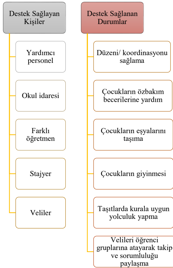
Şekil 4.2. Alan gezilerinde yardımcı kişiler ve destek oldukları durumlar

Şekil 4.2 incelendiğinde, öğretmenler alan gezilerinde okuldaki idareci, farklı bir sınıfın öğretmeni, stajyer öğretmen ya da yardımcı personelden destek aldığını, diğer taraftan velilerden de genel olarak destek aldıkları görülmektedir. Bu durumu bazı öğretmenler şu şekilde dile getirmiştir: