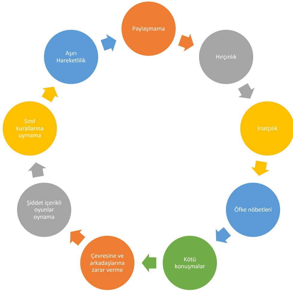
Şekil 4. 3. İstenmedik davranış örneklerine yönelik öğretmen görüşleri

Öğretmenlerin sınıf içi ve sınıf dışı olmak üzere nitelendirdikleri istenmedik davranışları incelediğimizde odak noktanın sınıf düzenini bozan davranışlar üzerinde olduğunu bulgular sonucunda gözlemliyoruz. Etrafına zarar veren ve sınıf düzenini provoke eden davranışların öğretmenler için sorun teşkil ettiğini belirlenmiştir.