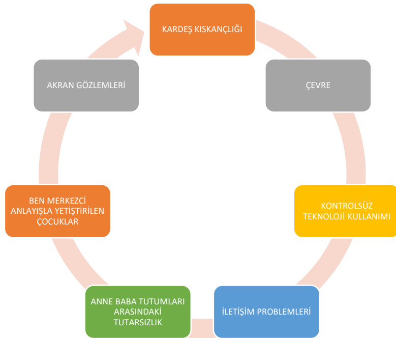
Şekil 4. 1. İstenmedik davranışların nedenlerine yönelik bilgiler

Yukarıda yer verilen katılımcıların ifadelerine dayalı olarak okul öncesi dönemde istenmedik davranışların kaynağı incelendiğinde genellikle bir başkasında bu davranışı gözlemlene ya da kendinin bu davranışa maruz bırakılmasının oluşturduğunu belirlenmiş ve bu nedenler Şekil 4.1’de sunulmuştur.