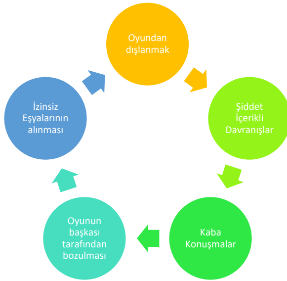
Şekil 4. 2. İstenmedik davranış örneklerine yönelik çocuk görüşleri

Şekil 4.2 incelendiğinde çocukların istenmedik davranışlara karşı görüşleri genellikle kendi alanlarına yapılan müdahaleler sonucu duydukları rahatsızlıkların ifade edilmesi olmuştur. Fiziksel ve psikolojik şiddet tüm çocuklar için bulgular sonucu istenmedik davranışlar olarak ifade edilmiştir.