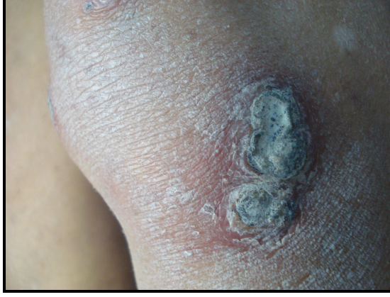
Resim 1. Sol diz lateralinde çevresi eritemli, ortasında kalın krut bulunan yan yana yerleşmiş iki adet plak.

Perforan dermatozlar, histopatolojik olarak konnektif dokunun transepidermal eliminasyonu ve inflamatuvar hücrelerin varlığıyla karakterize bir hastalık grubudur (4). Klasik perforan dermatozlar Tablo 1'de sunulmuştur.