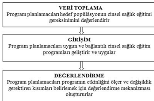
Şekil 3: IMB Modelinin Cinsel Sağlık Eğitim Programlarına Uygulanma Aşamaları

Etkin bir müdahalenin geliştirilmesi için buna karar verme ve tanımlanan davranışın tümüyle değiştirilmesi hedeflenmelidir. IMB modelinde amaç, sağlık davranışlarının değişikliğinde alternatif bir düşünceye/uygulamaya olanak sağlayan yaratıcı bir ortam için detaylı bilgilendirme, kültürel pratiği ve normları kavramaya olanak sağlayan değişimin yapılmasıdır (6,7). IMB modelinin cinsel sağlık eğitim programlarına uygulanması üç aşamalı temel bir işlemi içerir (Şekil 3).