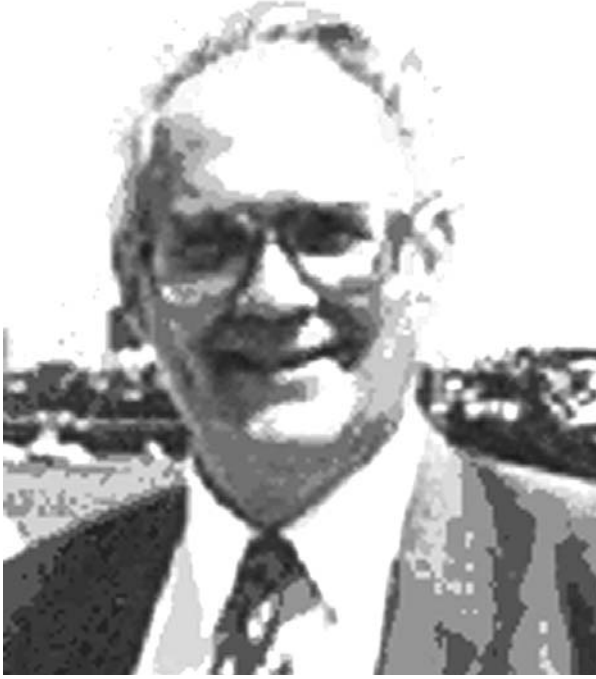
Resim-1. Raymond Roy-Camille (1927–1994).

Raymond Roy-Camille, 25 Nisan 1927'de Karayip adalarından Martinique'nin başkenti Fort-de-France'da dünyaya geldi. Babası oldukça zengin bir işadamıydı. Amcası ise hekimdi ve hekimlik konusunda ilk olumlu etkiyi kendisinde bırakan kişiydi.