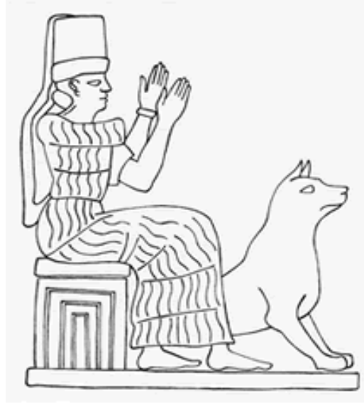
Ek 3: Şifa Ritüeli, Tel-Halaf'tan Ele Geçen Silindir Mühür Baskısı, M.Ö.I.Binyılın ilk yarısı.