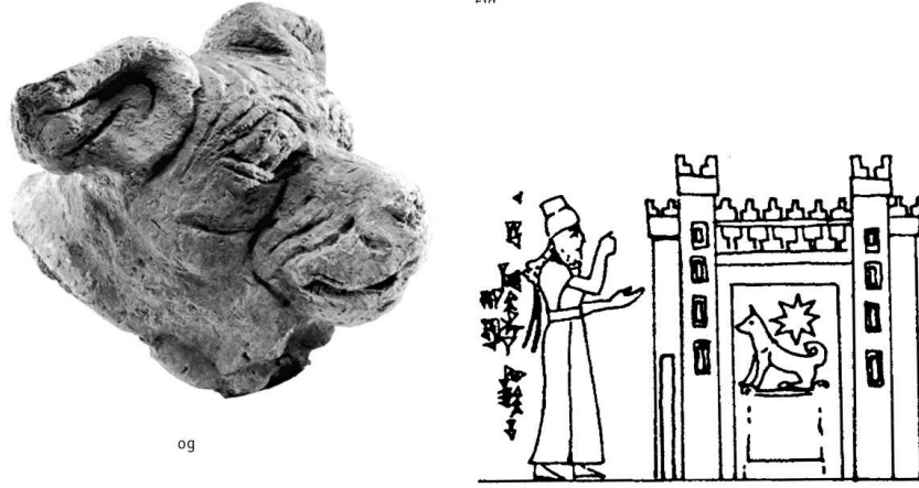
Ek 5: Oturan Köpek, Orta Asur Dönemi Silindir Mühür, Tel el-Rimah'tan.