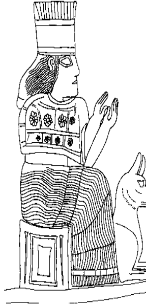
Ek 7: Kil Köpek Figürü