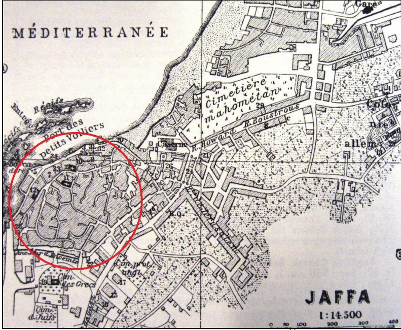
Harita 2. Yafa Kent Planı (1912) 11

Yafa'daki yapılaşma öncelikle Kudüs, Nablus ve Gazze'ye giden ana ulaşım akslarının çevresinde oluşmuştur (bkz. Harita 2). Osmanlı yönetimi eski kent dışındaki bu yapılaşma hamlesine bazı idari binalar inşa ederek iştirak etmiştir. 1897 yılında kent sakinlerinin ve eşrafın katkılarıyla inşa edilen hükümet konağı, askeri kışla, belediye binası ve diğer yönetim daireleri kentin yeni idari merkezini oluşturmuştur. 1901 yılında hükümet konağının hemen yanına yapılan saat kulesi ise pek çok başka kentte olduğu gibi, II. Abdülhamit'in 25. cülus yıldönümünün hatırasıdır (bkz. Resim 1).