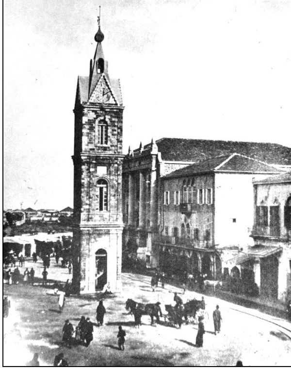
Resim 1: Yafa Hükümet Konağı ve Saat Kulesi (20. Yüzyıl Başı) 16

yakın çevredeki kırsal alanda “ ihracata yönelik tarım işletmeleri ” olarak tanımlanabilecek kolonilerin oluşturulmasıdır. Çeşitli Avrupa ülkeleri ile Amerika’dan gelen kolonizatörlerin çoğunluğu Yahudi olmakla birlikte, Alman kolonisinde olduğu gibi bazıları da bütünüyle Hristiyanlardan oluşan gruplardır. Yafa’daki kolonizasyon 1850’lerde küçük gruplarla başlamıştır. 1866 yılında Amerika’dan gelen 156 kişilik grup belki de gerçek anlamdaki ilk kolonizatör topluluğudur 13 . Yafa’ya bir mil uzaklıktaki Sarona köyüne yerleşen Amerikan kolonisinin önemli bir bölümü, yerel iklime, yaşam tarzına ve tarım koşullarına uyum sağlayamayarak geri dönmek zorunda kalsa da 1869 yılında bunlardan boşalan bölgeye Alman Templar kolonisi yerleşmiştir 14 . 20. yüzyıl başına gelindiğinde 360 kişiden oluşan Templar kolonisinin büyük çoğunluğu tarımla uğraşmaktadır 15 .