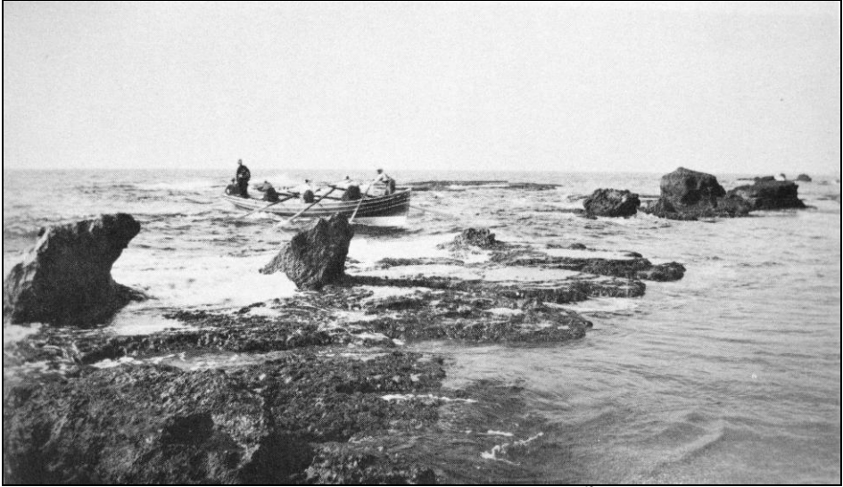
Resim 2: Yafa Kıyısı (1900) 69

Osmanlı yönetiminin Yafa'daki en önemli sorunlarından biri limanda giderek büyüyen uluslararası ticaret trafiğine uygun bir altyapının hazırlanmasıydı. Bu arada kutsal makamları ziyaret etmek üzere sadece Avrupa ülkelerinden değil, Amerika'dan, hatta Hindistan, Afganistan gibi uzak ülkelerden Filistin'e gelen binlerce ziyaretçi Yafa limanından karaya çıkıyordu 68 . Aslında Yafa limanı sadece küçük yelkenli gemilerin yanaşabileceği sığ bir limandı (bkz. Resim 2). Bundan başka, kıyı boyunca uzanan kaya yatakları da yük tonajı yüksek buharlı gemilerin limana girişini engelliyor, gemiler özellikle kış aylarında açıkta demirleyerek yüklerini kayıklar veya küçük tekneler aracılığı ile boşaltmak zorunda kalıyorlardı. 1860'lı yıllardan itibaren Yafa limanının gelişen ticarete uygun bir hale getirilmesi için, Amerikalı, Avusturyalı, Alman, İngiliz, Fransızların içinde olduğu çok çeşitli çevrelerden projeler geliştirildi. Böylece Yafa'da modern bir liman inşası, Avrupa devletleri arasındaki emperyalist rekabeti görünür kılan bir diğer gündem maddesi haline geldi.