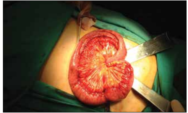
Resim 3. Transversus abdominis plan blok sonrası batın dışına çıkarılan barsak ansları

lenerek alt abdominal bölgeyi ilgilendiren cerrahi işlemlerde uygun olduğu vurgulanmıştır (10). Biz de olguda literatürde belirtildiği gibi 20 mL hacimle tek taraflı TAP blok uygulamamızı USG eşliğinde başarıyla gerçekleştirdik. Hastanın postoperatif 48 saatlik dönemde ek analjezik kullanım ihtiyacı olmadı.