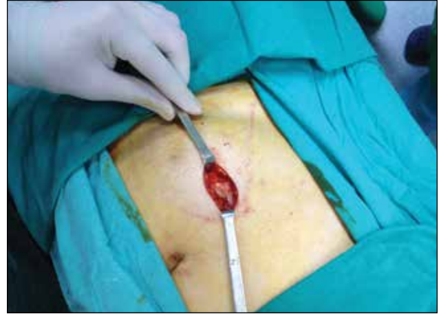
Resim 2. Cerrahi insizyon