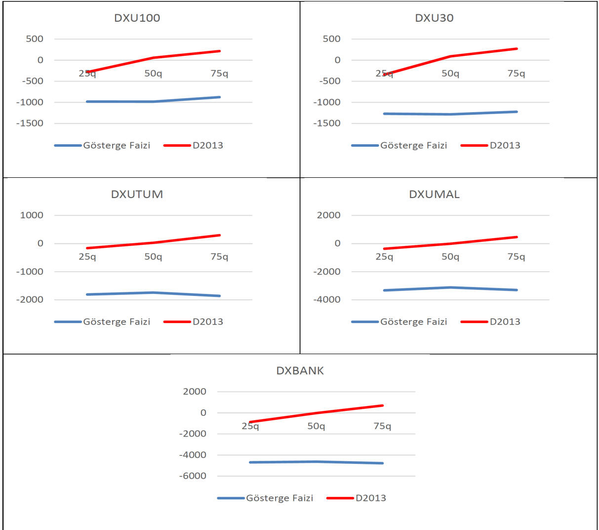
Grafik 3: Eşanlı Kantil Regresyon Tahmin Sonuçları Grafikleri

Tablo 3 ve Grafik 4'de yer alan analiz sonuçlarına göre, analize dâhil edilen tüm endeksler üzerinde gösterge faiz oranı beklendiği üzere negatif etkiye sahiptir. Negatif etkinin şiddeti ise, tüm endekslerde 0.75'inci kantilde kuvvetlenmektedir. Bu durum, endekslerin yüksek olduğu dönemlerde gösterge faiz oranı hareketlerinden daha şiddetli etkilendiğini göstermektedir. Yüksek endeks dönemlerinde (75q) gösterge faiz oranının artışı, endeks değerini diğer kantillere göre daha fazla düşürmektedir. Ayrıca, XUMAL ve XBANK endekslerinin gösterge faizinden diğer endekslere göre daha fazla etkilendiği görülmektedir. Borsa İstanbul'da yer alan mali işletmelerden oluşan XUMAL ve bankalardan oluşan XBANK endekslerinin gösterge faiz oranından daha