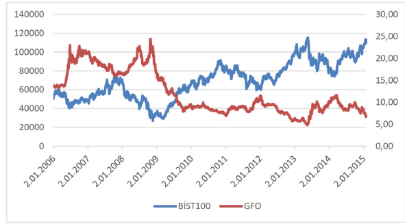
Şekil 1: Ocak 2006 - Ocak 2015 Gösterge Faiz Oranı (GFO) ile BİST-100 İlişki Grafiği

Türkiye'nin ekonomik göstergeleri ve sermaye piyasaları açısından konuya yaklaşılacak olursa, Borsa İstanbul (BİST) ile önemli bir faiz değişkeni olan gösterge faizi arasındaki ilişki oldukça ilgi çekici görünmektedir. Temel olarak sığ ve dalgalı bir yapıya sahip olan BİST, bünyesindeki yüksek orandaki yabancı yatırımcı nedeniyle birçok değişkenden aynı anda etkilenen bir yapıya sahiptir. Dalgalı yapısı nedeniyle ikameleri olan diğer dünya borsalarına göre yüksek oranda getiri elde etme fırsatı barındırmaktadır. Bu nedenle yerli ve yabancı yatırımcıların makroekonomik göstergeler konusunda önemli bir hassasiyete sahip olduğu söylenebilmektedir. Bu göstergeler içerisinde Gösterge Faiz Oranı olarak isimlendirilen "Benchmark Index" özellikle diğer faiz oranı değişkenleri arasında öne çıkmaktadır. Vadesi 5 yıl olan ve yıllık kupon ödemesi yapılan Devlet Tahvil faizini ifade eden gösterge faiz oranı, ikincil piyasalarda en fazla işlem gören tahvil çeşitlerinden biri olduğu için referans olarak kullanılmaktadır. Gösterge faiz oranının önemi, BİST endeksleri ile arasındaki korelasyon incelendiğinde açık bir şekilde görülmektedir. Şekil 1'de Ocak 2006 ile Ocak 2015 arasındaki günlük gösterge faiz oranı (GFO) ile BİST-100 endeksi arasındaki ilişki grafiği yer almaktadır.