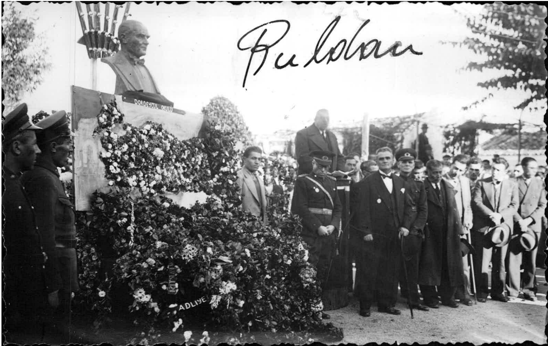
Ek-4: 21 Kasım 1938'de Atatürk'ün cenaze töreni nedeniyle Buldan'da Yapılan törenden bir fotoğraf