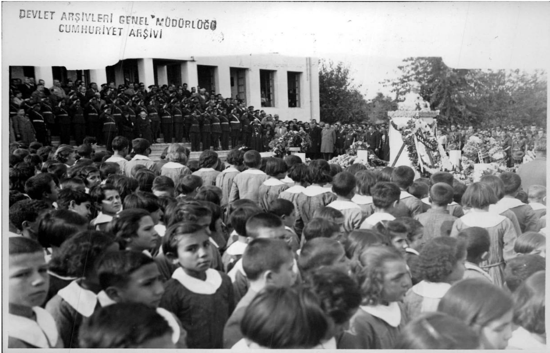
Ek-2: Denizli Halkevi önündeki tören(21 Kasım 1938)