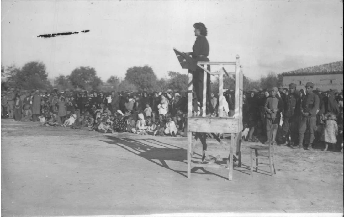
Ek-16: Sarayköy'de cenaze töreninde söylev