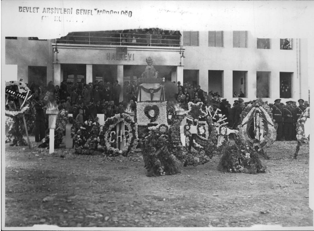
Ek-1: Denizli Halkevi önünde meşaleler yanarken. Açıkça okunabilen CHP, ordu ve Halkevi çelenkleri dışında, en önde Denizlispor'un, sağda Hisar köyünün çelenkleri bulunmaktadır. En soldaki çelenkte 1880-1938 tarihleri dikkat çekmektedir. (21 Kasım 1938)