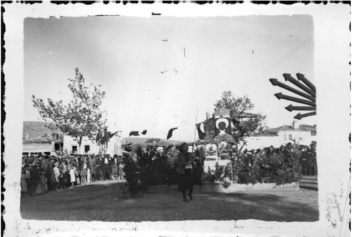
Ek-11: 21 Kasım 1938'de Atatürk'ün cenaze töreni nedeniyle Tavas'ta Yapılan törenden bir fotoğraf.