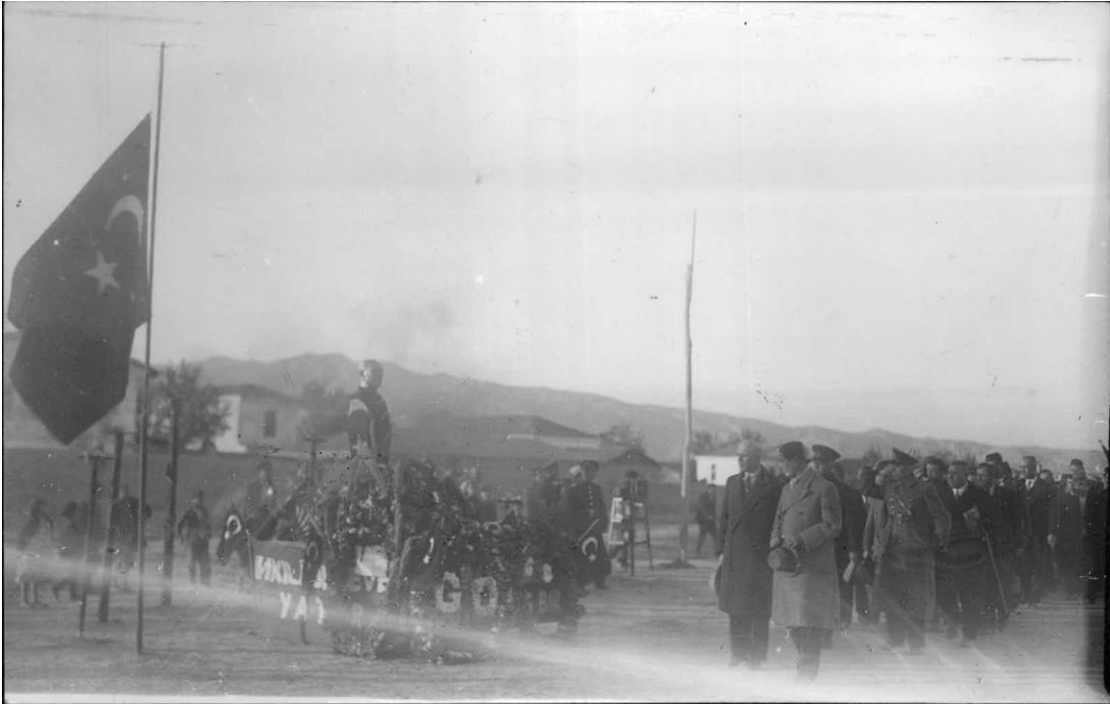
Ek-15: Sarayköy'de cenaze töreninde katafalkın önünden geçilirken