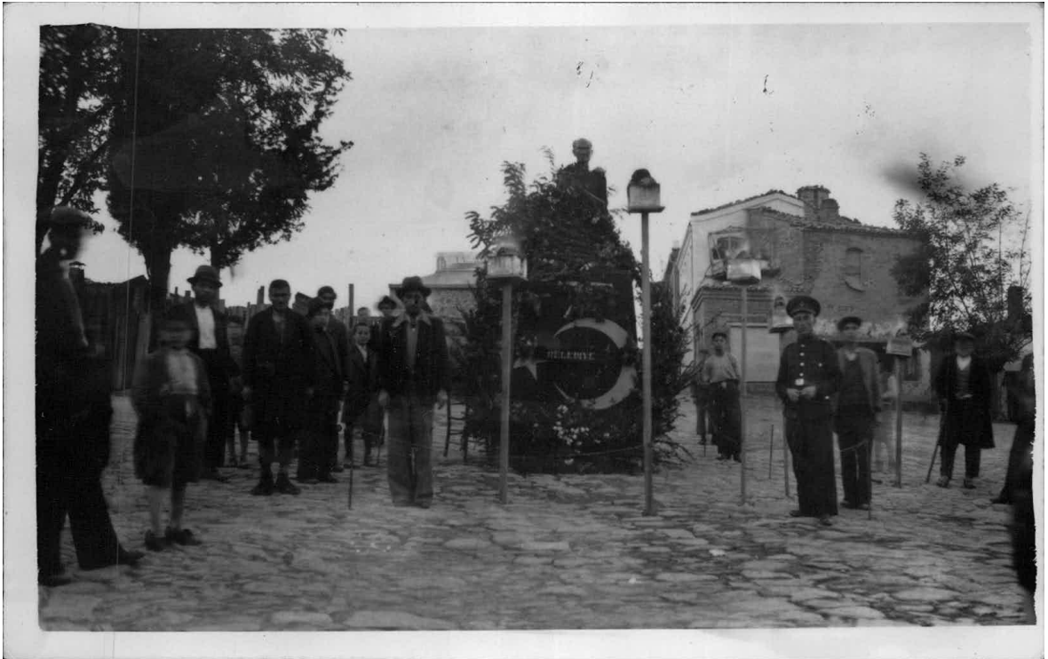
Ek-13: Babadağ'da Atatürk büstü önünde yanan meşalelerin görünüşü