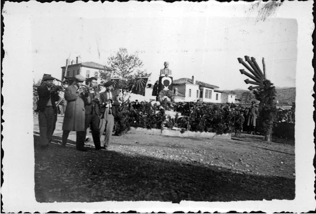
Ek-9: 21 Kasım 1938'de Atatürk'ün cenaze töreni nedeniyle Tavas'ta Yapılan törenden bir fotoğraf.