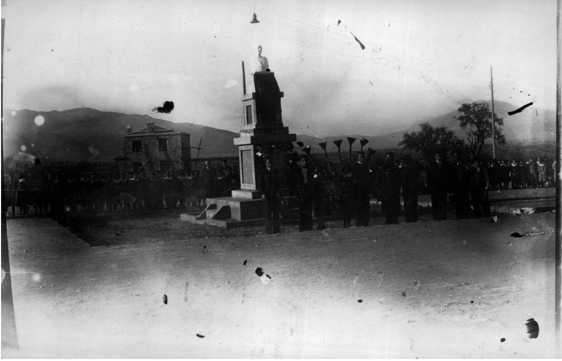
Ek-18: 21 Kasım 1938 Acıpayam Cumhuriyet Meydanından bir fotoğraf