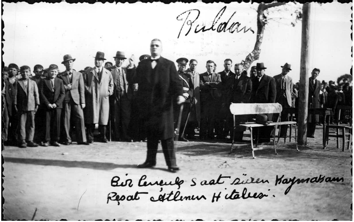
Ek-4: Buldan'da Kaymakam Reşat Altın'ın bir buçuk saat süren hitabesinden bir fotoğraf