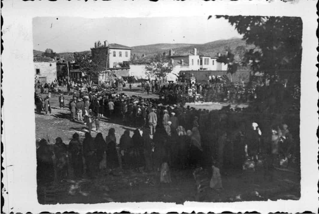
Ek-8: 21 Kasım 1938'de Atatürk'ün cenaze töreni nedeniyle Tavas'ta Yapılan törenden bir fotoğraf.