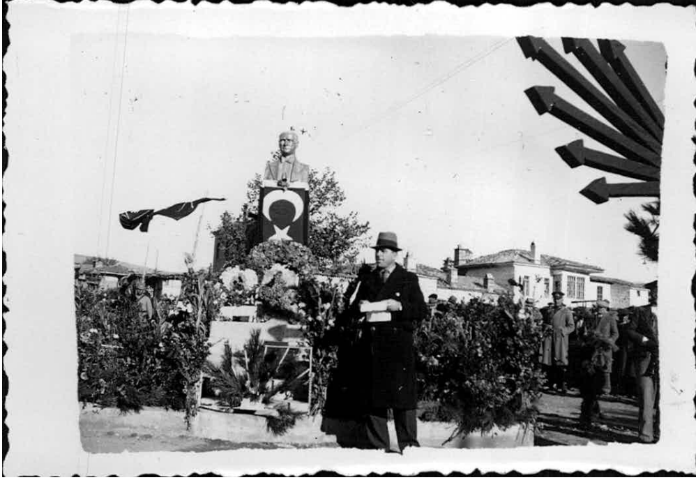
Ek-10: 21 Kasım 1938'de Atatürk'ün cenaze töreni nedeniyle Tavas'ta Yapılan törenden bir fotoğraf.