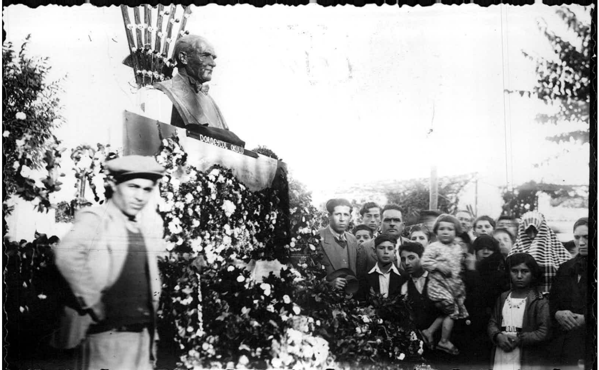
Ek-5: 21 Kasım 1938'de Atatürk'ün cenaze töreni nedeniyle Buldan'da Yapılan törenden bir fotoğraf.