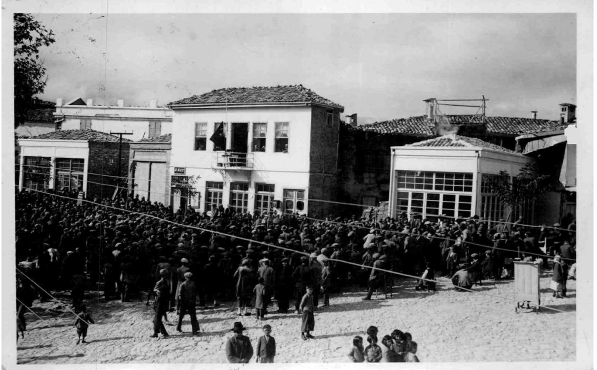
Ek-12: Babadağ'da Belediye önünde toplanan halk Ankara'da yapılan töreni radyodan takip ederken.