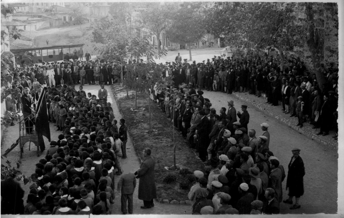
Ek-19: 21 Kasım 1938 Çal'daki tören.