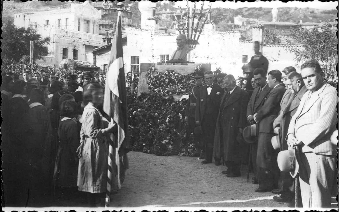
Ek-7: 21 Kasım 1938'de Atatürk'ün cenaze töreni nedeniyle Buldan'da Yapılan törenden bir fotoğraf